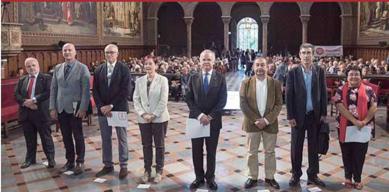
Els rectors i rectores de la UOC, la UdG, la UPF, la UAB, la UB, la UPC, la UdL i la URV abans de començar l'acte al paranimf