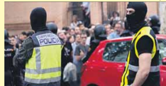
Dos agents d'informació de la policia, l'1-0