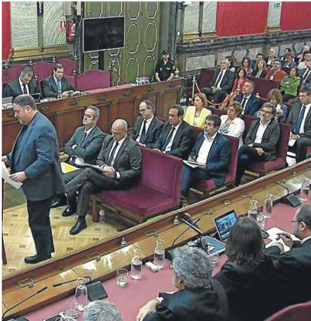
Tots els polítics i activistes jutjats al Tribunal Suprem, durant el judici que va acabar al juny ■ EFE

Tot i que algunes veus, com la presidenta de l'ANC, Elisenda Paluzie, n'han dubtat aquest estiu per si això podria després "tallar el camí jurídic internacional", la reivindicació d'una amnistia sembla l'opció majoritària entre l'independentisme, "com a part d'una solució política al conflicte polític de Catalunya amb l'Estat", segons la proposta de resolució dels tres grups aprovada en l'últim debat de política general. De fet, ERC ja va proposar durant la campanya electoral del 28-A, tot i que no ho duia en el programa, el que va batejar com a llei de llibertat, una iniciativa legislativa al Congrés que aixequi totes les causes judicials obertes i posi fi a la repressió com a punt de partida al diàleg. "La llei hauria de partir d'una premissa: el que ha passat a Catalunya no es pot considerar delictes, i no es poden