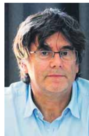
El cas dels escons de Junqueras i Puigdemont al Parlament Europeu l'ha de resoldre el TJUE