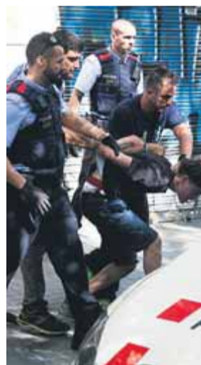
Detenció dels Mossos al centre de Barcelona

El conseller d'Interior, Miquel Buch, va afirmar ahir que els Mossos d'Esquadra han d'estar preparats per resoldre “qualsevol escenari” que es pugui plantejar complint el marc jurídic, és a dir, la llei de cossos i forces de seguretat i la llei de policia. Per Buch, i fent referència a la resposta ciutadana a la sentència del judici de l'1-O, la “complexitat” dels darreres temps es podria “incrementar encara més” els pròxims dies i per això va