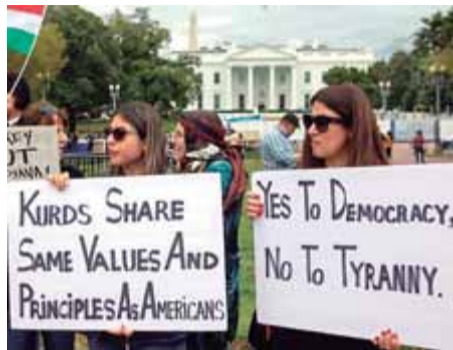
Manifestants davant de la Casa Blanca

L'exercit turc ja té enllestits tots els preparatius per a la invasió del Kurdistan siria