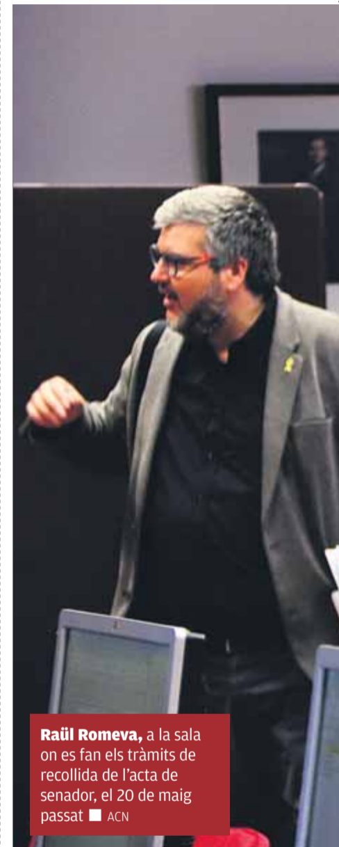
Raül Romeva, a la sala on es fan els tràmits de recollida de l'acta de senador, el 20 de maig passat

Davant d'una sentència injusta cal que la ciutadania també dicti la seva sentència. Estic segur que les institucions estan treballant en la resposta, i no vull afegir més soroll al debat. Sí que considero que aquesta s'ha de basar en una solidaritat ferma, creixent, pacífica, però sobretot integradora de totes les persones que volen participar de la defensa de totes les llibertats democràtiques i de la justícia contra tota repressió. Perquè aquesta és la immensa majoria de la societat catalana, i hem de saber articular-la. L'independentisme, després de la sentència, necessitarà actuar amb el cap fred, no en la lògica visceral, o d'acció-reacció. Malgrat les emocions, el moment demana fermesa, intel·ligència col·lectiva i visió de conjunt. I passi el que passi, no hem de defallir mai, hem de mantenir sempre l'actitud cons-