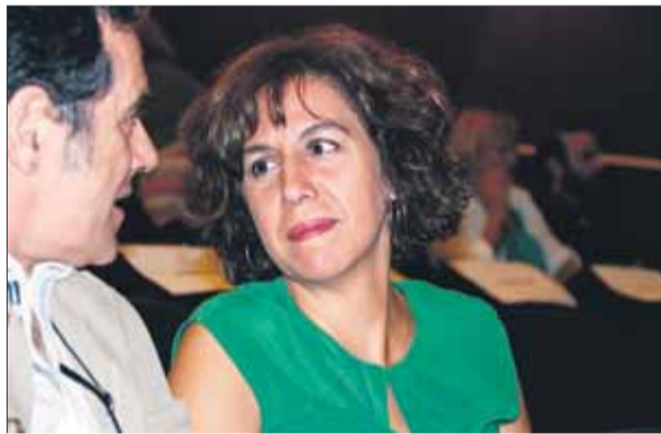
Lozano, en un acte de Societat Civil Catalana aquest any

El president Quim Torra va presentar ahir a la fiscalia de Barcelona una denúncia per calúmnia, obstrucció a la justícia i prevaricació contra la secretaria d'Estat d'Espanya Global, Irene Lozano, per l'informe que va difondre l'organisme sobre el procés independentista i en què es donen per fets els delictes dels presos polítics sense que hagin estat condemnats. La base de la denúncia és que l'informe considera delictius els fets