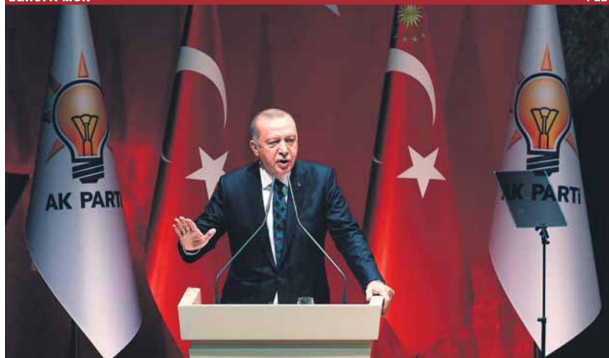
Erdogan, ahir, durant la intervenció en l'acte en què va amenaçar d'enviar a la UE milions de refugiats sirians