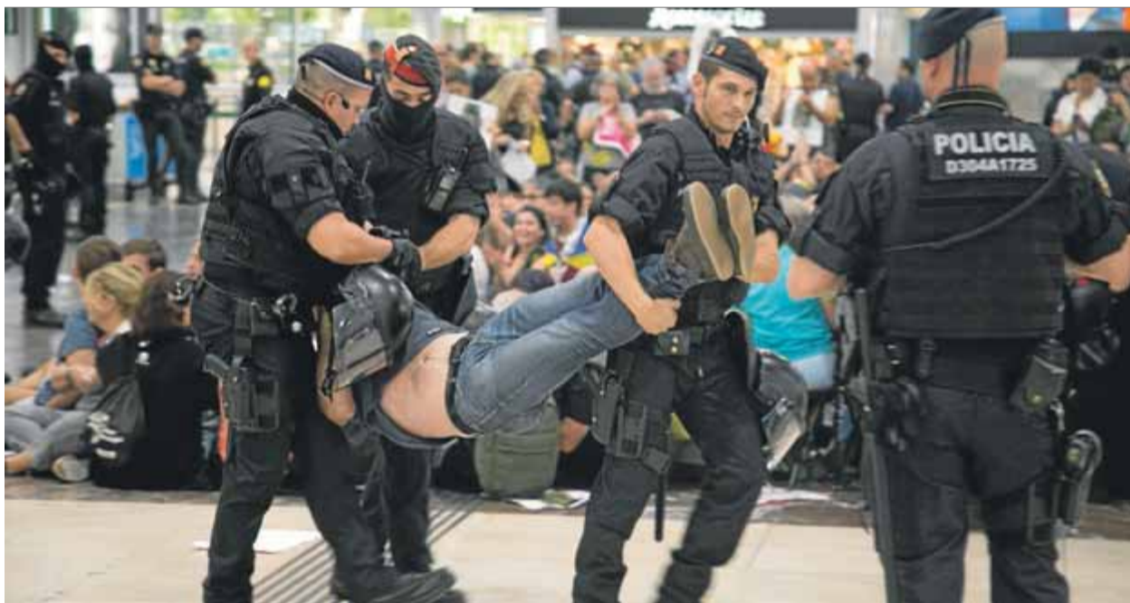
Agents dels Mossos d'Esquadra traient un dels participants en l'acció al vestíbul de l'estació de Sants, ahir

1-0 • El Suprem farà pública previsiblement avui la sentència dels dotze polítics catalans acusats pel referèndum