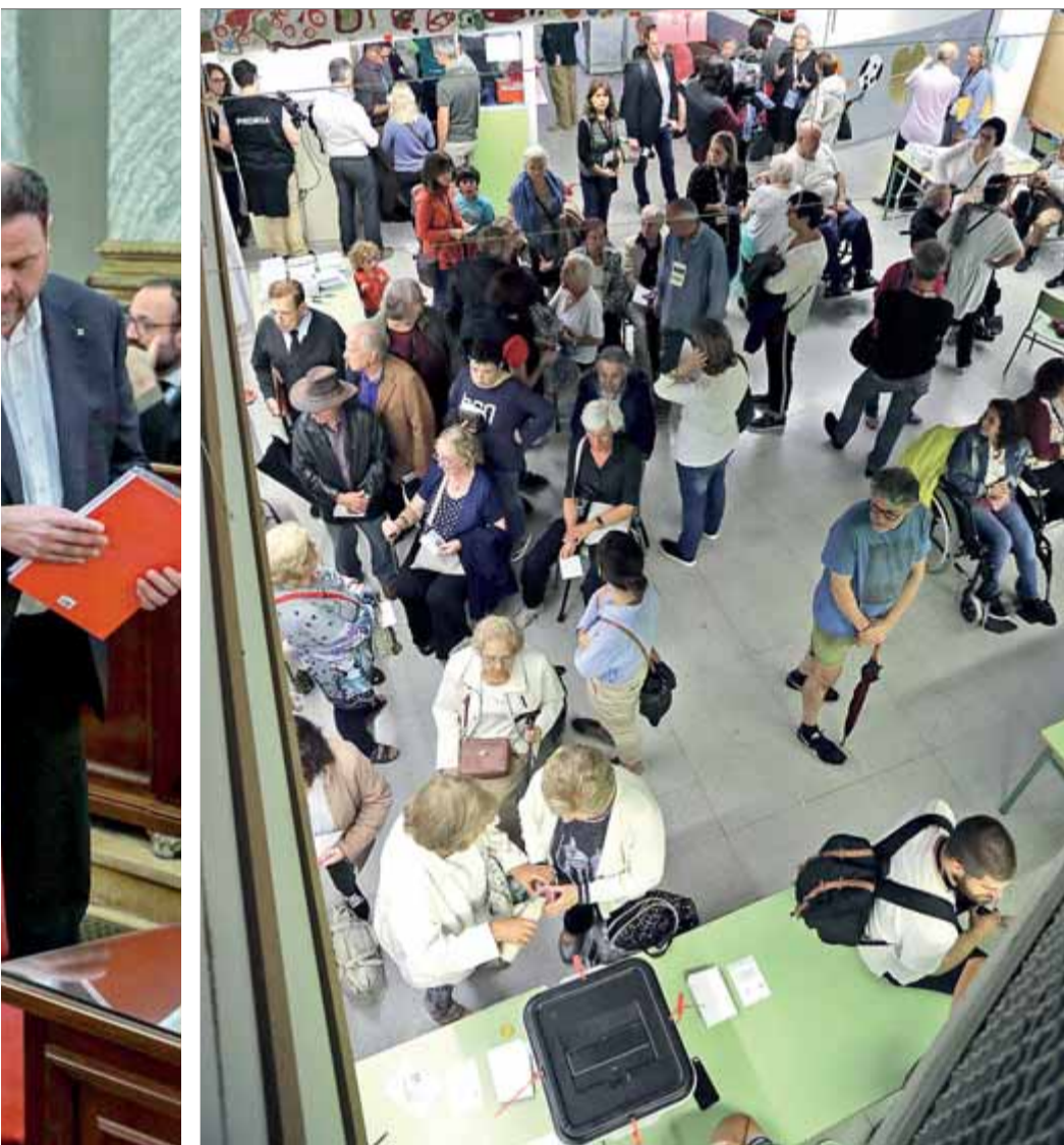
Els dirigents presos i acusats durant el judici al Suprem i cues de votació a l'escola Concepció de Barcelona en el referèndum de l'1 d'octubre del 2017