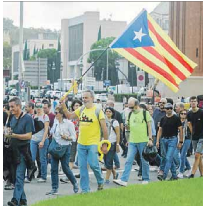
A dalt, la seguda que Pínic per la República va convocar al vestíbul de l'estació de Sants. A sota, a la dreta, agents dels Mossos, desallotjant un participant. Al costat, la marxa a la plaça Espanya