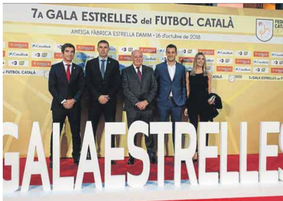
Imatge de gala del futbol del 2018 i que s'havia de repetir avui, però que s'ha suspès ■ J. L.