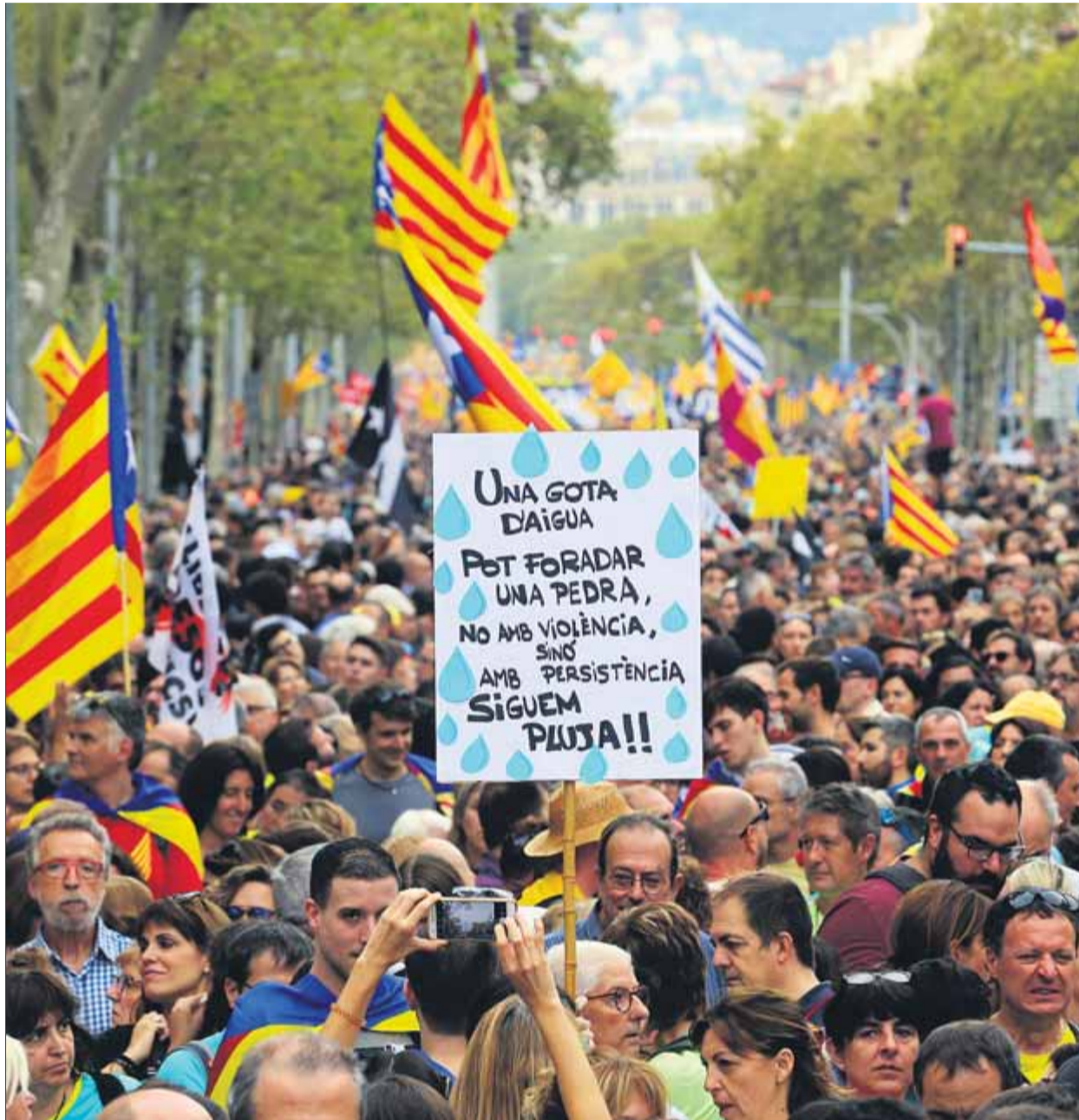
Un tram de la manifestació de la tarda que va desbordar carrers a la zona de Gran Via i passeig de Gràcia

També l’ANC i Òmnium van celebrar com un èxit la gran mobilització de les marxes i de les manifestacions a les principals capitals del país. La presidenta de l’ANC, Elisenda Palu-