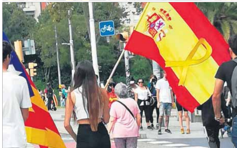
Imatges de la gran manifestació d'ahir al passeig de Gràcia, que va tornar a ser un acte multitudinari i cívic, i una noia amb una bandera espanyola amb llaç groc

que comporta una bona organització, va prendre la paraula la presidenta de l'Assemblea Nacional Catalana, Elisenda Paluzié, que es va referir a les marques per la llibertat que havien confluït en aquella manifestació. "Hem omplert les carreteres del país d'una dignitat col·lectiva", va dir Paluzié, que va fer esclatar un gran aplaudiment en afirmar: "Des de la societat civil hem fet el que ja vam dir