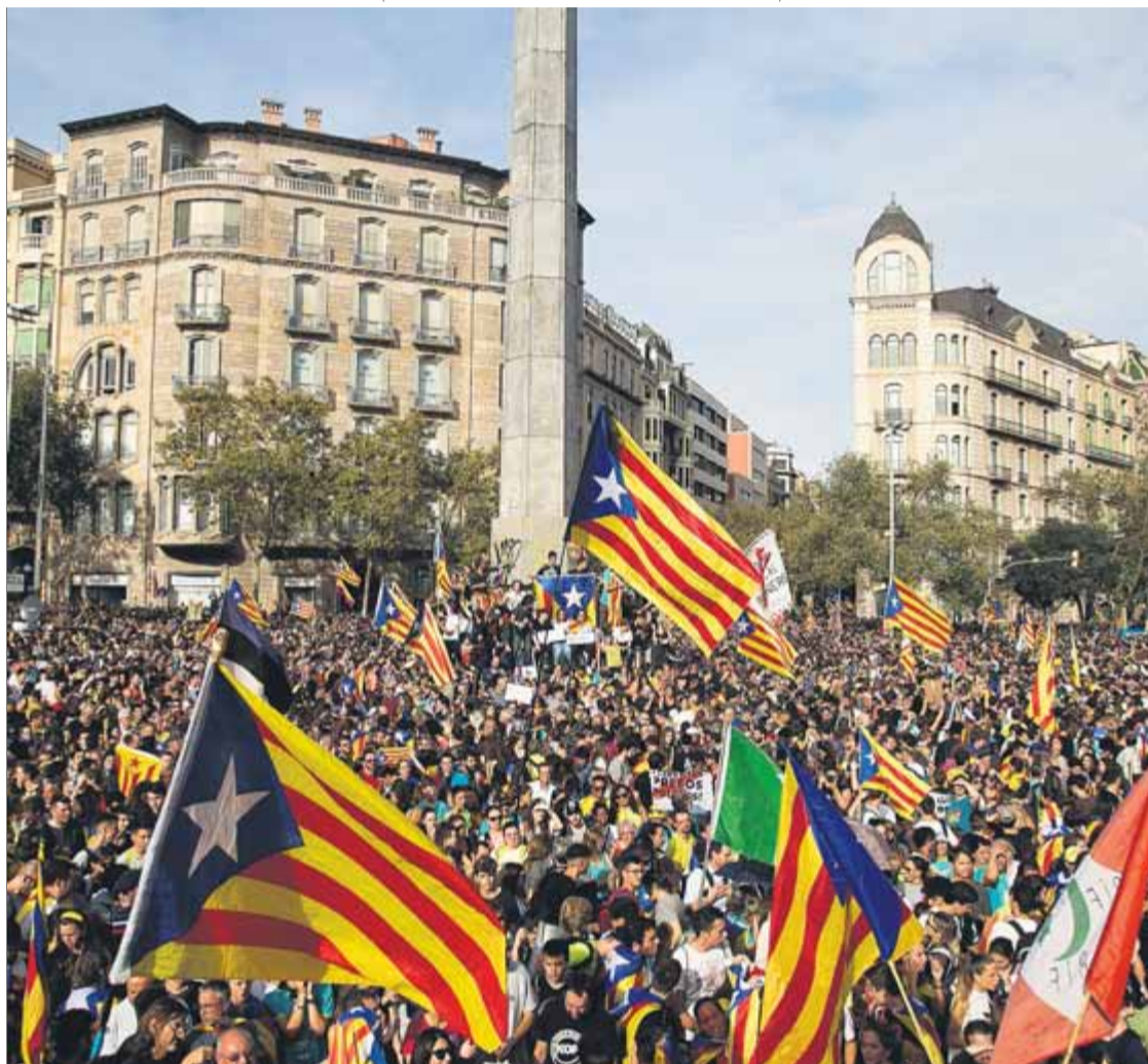
Epicentre de la manifestació d'ahir a la plaça del Cinc d'Oros

El més semblant que ha viscut aquest país va ser el 3 d'octubre del 2017, el dia que molts van dir a posteriori que hauria d'haver estat el moment de proclamar la independència. Un grup de joves es preguntava ahir pel carrer què volia dir "govern de Vichy". Els carrers hi són, la gent hi és, els mateixos tractors del 2017 llaurant la ciutat, les mateixes camionetes dels forestals en marxa lenta, joves i adolescents que han crescut amb les mobilitzacions, que ja anaven a col·libè a les de l'Estatut, avis amb els nets, els mateixos estudiants, dos anys més grans, el temps que els Jordis han passat a la presó. També es repetien alguns lemes reclamant l'autodeterminació, la llibertat, la independència, contra la repressió, però d'altres eren nous, com ara el clam per l'alliberament dels presos polítics (el 3-0 faltaven pocs dies perquè Cuixart i Sànchez ingressessin a la presó), o càntics en honor als fanals. El ventall de colors havia augmentat: s'hi veien les samarretes corall del 2018 i turquesa del 2019 dels Onze de Setembre. Feia riure recordar els titulars maliciosos i les ànimes de càntic que van creure veure l'independentisme