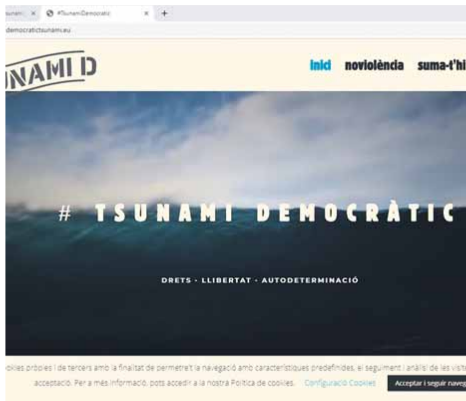
La web de Tsunami Democràtic és accessible amb el domini "eu"

El ministre de l'Interior en funcions, Fernando Grande-Marlaska, també va voler parlar ahir del que està passant a Catalunya, i ho va fer per atribuir els aldarulls a grups minoritaris amb "estratègia i comandament" davant dels quals hi haurà una "resposta proporcional, adequada i necessària". També va subratllar la "professionalitat" amb la qual estan treballant els agents dels diferents cossos, que actuen segons criteris de "proporcionalitat i necessitat" i als quals ha mostrat "el seu suport i agraïment". El ministre també va revelar que, abans de la sentència del Suprem, ja s'havia previst un escenari en què "radicals" de diferents ideologies i procedència poguessin fer acte de presència a Catalunya, sobretot a Barcelona. Una de les teories que ja s'han difós, és que hi hauria activistes anarquistes de Grècia o Itàlia implicats en els disturbis. Finalment, el titular d'Interior va censurar les "polítiques de desinformació" que, segons ell, s'estan donant en aquest moment, amb la difusió de "narratives" que atribueixen a les forces de seguretat de l'Estat i als Mossos accions de provocació violenta amb infiltrats aliens i que inclouen "suposades proves video-gràfiques". ■