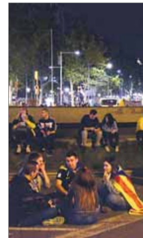
Joves al passeig de Gràcia cantonada Gran Via ■ R.G.A.

Però a aquella hora, i encara unes hores més tard, aquella confluència és plena de gom a gom de manifestants vinculats d'arreu del país. Passen les hores i l'aire comença a circular entre la gent. Apareix una tenda flotant a l'aigua del petit bassiol que hi ha al bell mig de la rotonda. No se'n veurà cap més. Si més no, fins a