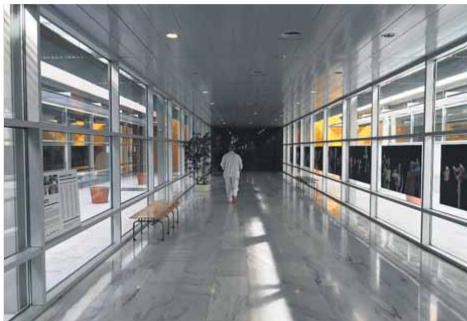
Un sanitari passeja per un passadís buit de l'hospital de Mataró, ahir al matí

SANITAT • L'activitat cau en picat als centres d'atenció primària i hospitalària, malgrat que les xifres oficials apunten que només el 23% de la plantilla secunda l'aturada de país