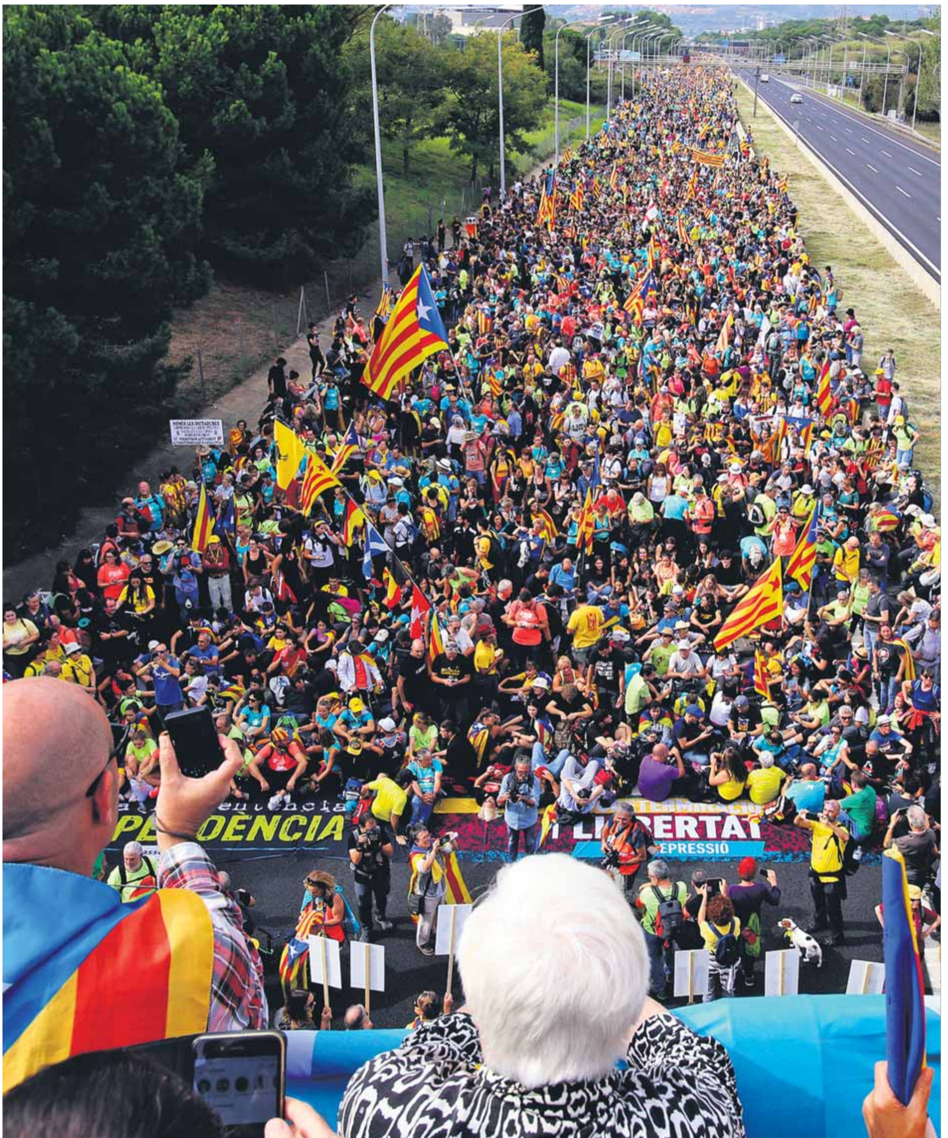
Participació desbordant. Un home i una dona saluden la marxa que havia sortit a primera hora del matí des de Martorell, que reunia les provinents de Tàrraga i de Tarragona, en el moment de passar per sota del pont de TV3, entre Sant Joan Despí i Sant Just Desvern, a pocs quilòmetres de Barcelona ■ JUANMA RAMOS