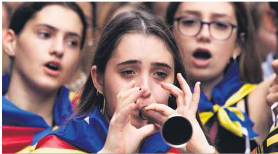
Els estudiants han posat música i cànctics a la resposta a la sentència ■ ORIOL DURAN

Per entendre'ns: mentre que la majoria de les editorials funcionaven als seus pisos, els museus han quedat pràcticament tancats. Maria Palau ens informa de la llarga llista d'entitats museístiques importants tancades: Museu Dalí, CCCB, Macba, Miró, Marés, Museu d'Història... Al matí, el MNAC mantenia només una part oberta a causa dels problemes de personal. També funcionava la Sagrada Família, que ha estat tancada –amb turistes dins– a causa d'un piquet, que més tard ha marxat. Jordi Bordes, periodista teatral, informa que “els teatres tan-