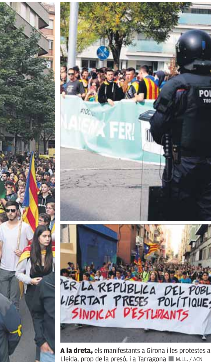
A la dreta, els manifestants a Girona i les protestes a Lleida, prop de la presó, i a Tarragona

que la gent surti al carrer". Els veïns de Tàrrrega també van decidir sortir a protestar al carrer omplint la plaça Major. A Manresa, prop de 10.000 persones van sortir al carrer per reclamar la llibertat dels presos independentistes i van omplir la plaça Major, que va quedar petita, on es va llegir un manifest crític amb les últimes actuacions policials. En acabar, un grup va traslladar la protesta a