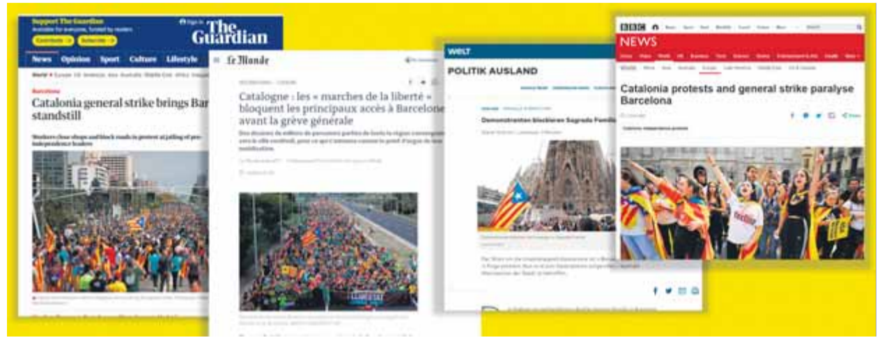
Els mitjans de comunicació de la premsa internacional es feien ressò ahir de la situació a Catalunya

“Centenars de milers de persones es concentren després de la condemna als líders catalans separatistes”, titulava al Regne Unit The Independent . La televisió britànica BBC il·lustrava amb un vídeo la informació dedicada a Catalunya i titulada “Un cinquè dia de protestes i una vaga general han aturat Barcelona pel rebuig a les condemnes dels líders se-