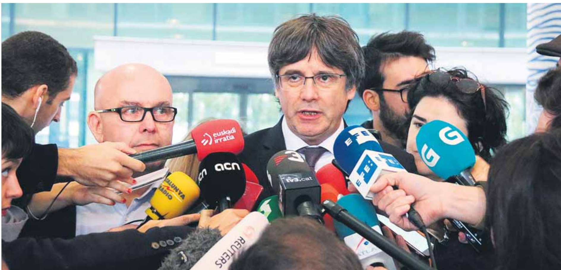
L'expresident de la Generalitat, Carles Puigdemont, i el seu advocat, Gonzalo Boye, atenen els mitjans després de sortir de l'edifici de la fiscalia de Brussel·les