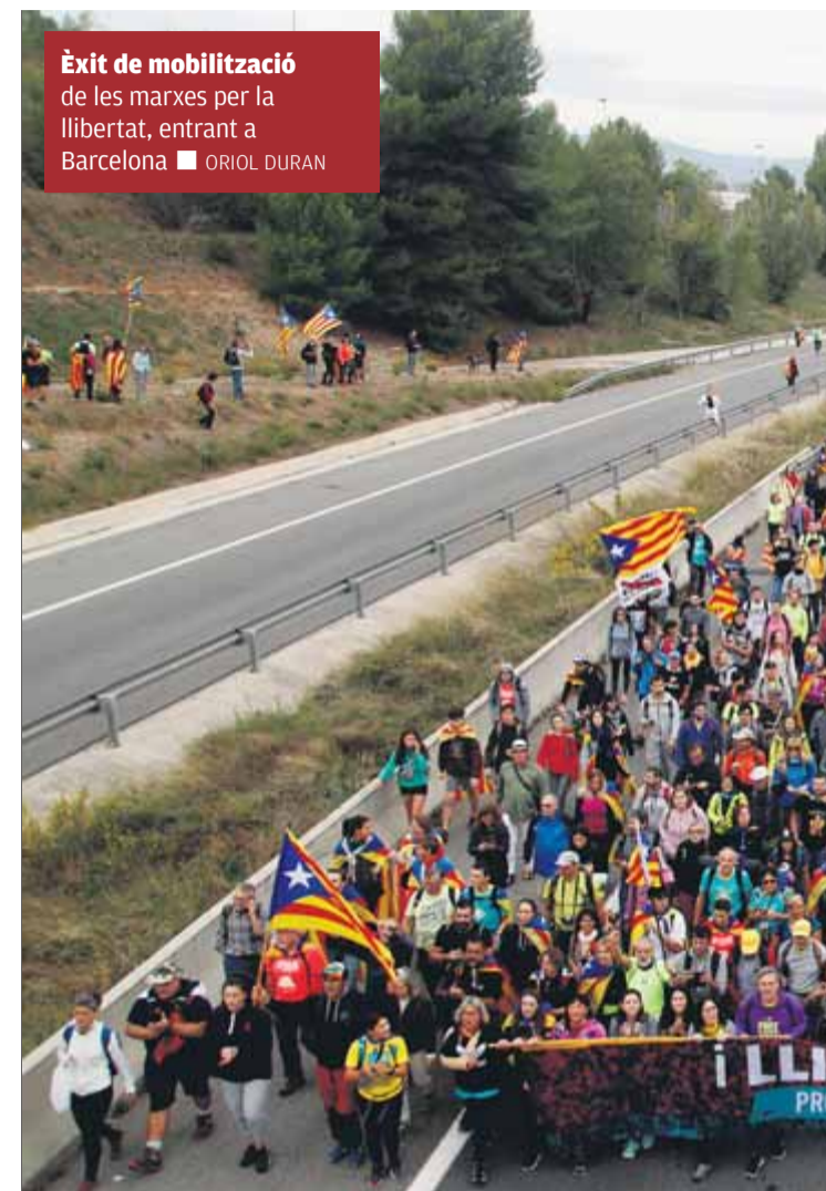
Èxit de mobilització de les marxes per la llibertat, entrant a Barcelona ■ ORIOL DURAN

A partir d'aquí, van començar reunions, trobades i rotllanes entre els partits. Els republicans expressaven de manera oficial la contrarietat, els diputats de JxCat, tot i un cert desconcert entre alguns dels seus membres, perquè no tenien constància de l'anunci, feien pinya amb el president Torra. "És el president i té