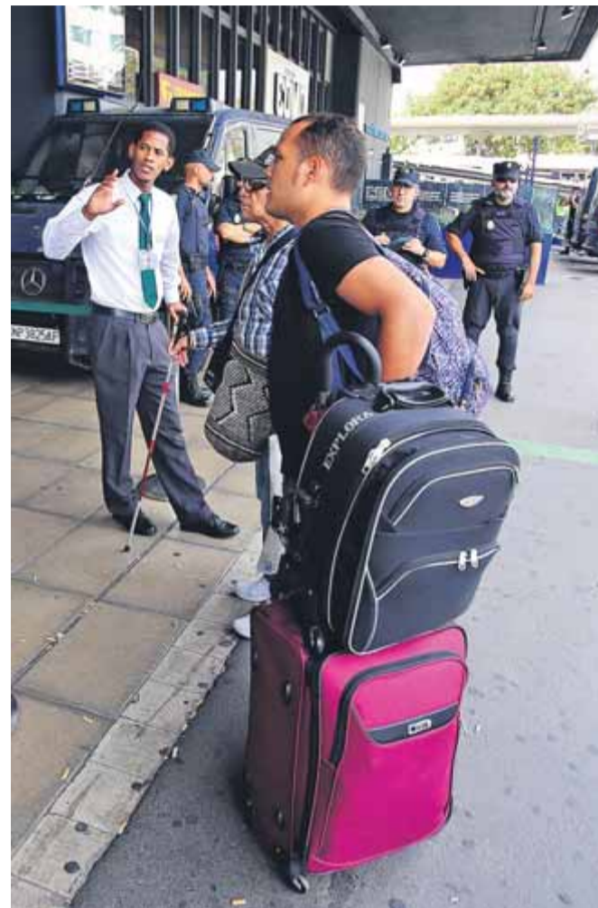
Manifestants bloquen l'AP-7 a la Jonquera, tall a l'N-340 a l'Ampolla i viatgers a l'estació de Sants al matí