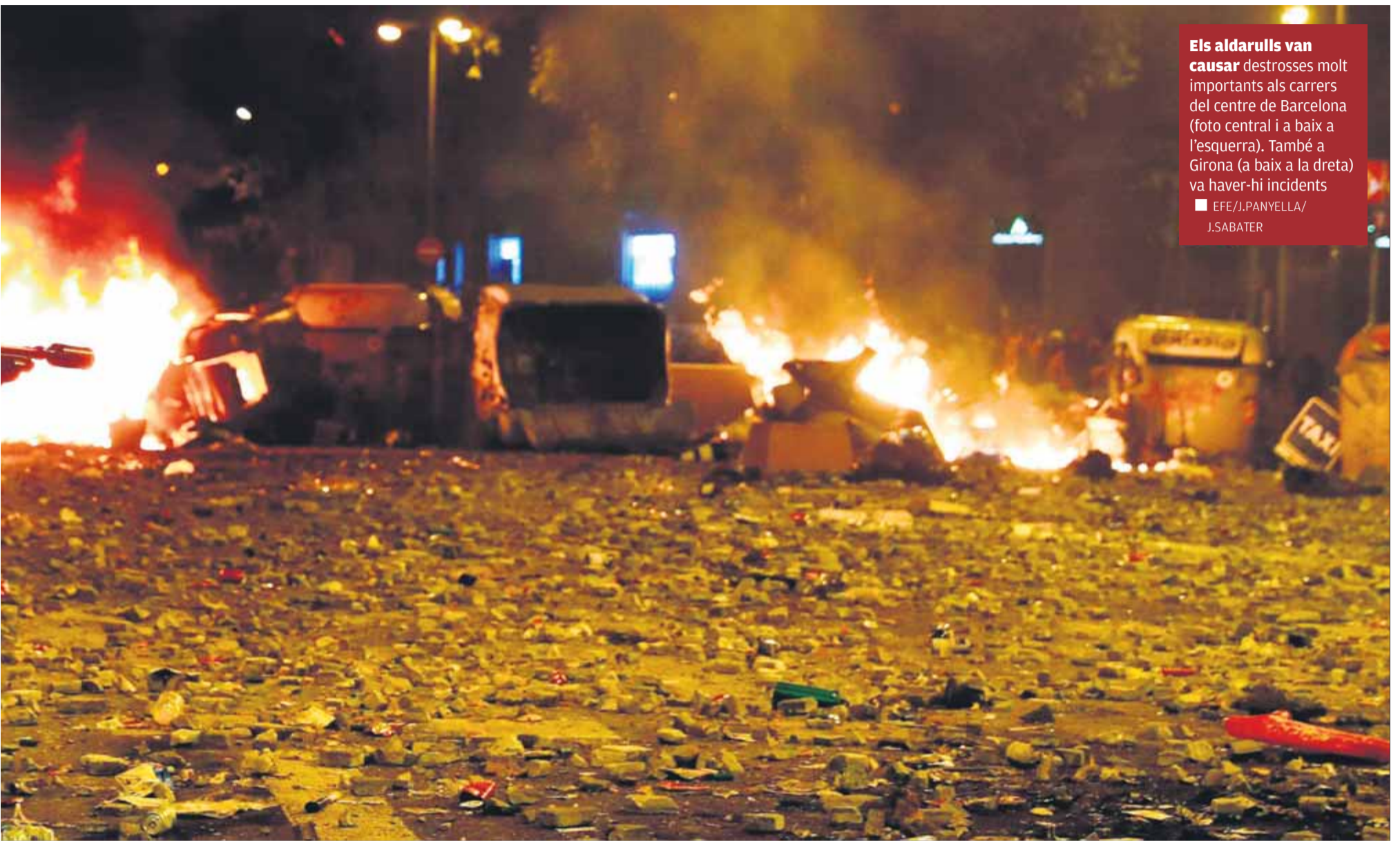
Els aldarulls van causar destrosses molt importants als carrers del centre de Barcelona (foto central i a baix a l'esquerra). També a Girona (a baix a la dreta) va haver-hi incidents