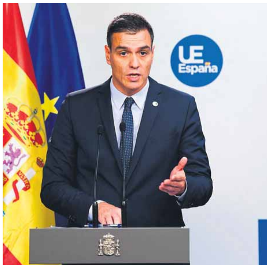
Pedro Sánchez, ahir en la compareixença després del Consell Europeu

El govern tampoc va entrar a valorar si consideraven un èxit la vaga a Catalunya, i es va limitar a donar algunes xifres durant el dia per boca de Marlaska i defensar el dret “constitucional protegit” que assisteix les persones que la vulguin fer sense coaccionar les altres, va assegurar el president espanyol des de Brussel·les. Sánchez sí que va acusar Torra de “banalitzar i frivolitzar la violència” i de menysvalorar-ne els efectes. I va instar-lo a entendre que la societat catalana “està dividida i fracturada” i que el primer que ha de fer és reconèixer que “Catalunya no és un sol poble, és una societat plural i no es pot homogeneïtzar”. Malgrat tot, i davant les peticions