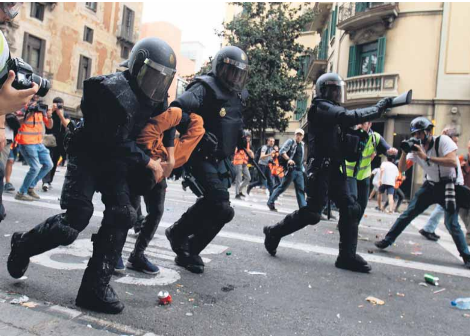
Antiavalots de la policia espanyola detenen un jove, en els disturbis davant la seu de la prefectura de la policia, a Via Laietana, ahir