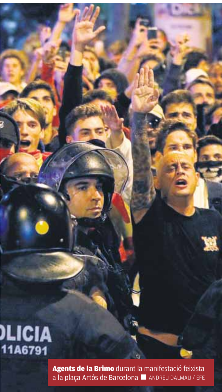
Agents de la Brimo durant la manifestació feixista a la plaça Artós de Barcelona

lar. Ara per ara, però, la possibilitat d'aquesta renúncia no està sobre la taula. Entre molts altres arguments, els comandaments del cos ara mateix fan pinya amb Buch per la defensa que està fent del dispositiu policial enmig d'una tempesta de crítiques que, en molts casos, provenen del mateix cor de la plaça de Sant Jaume.