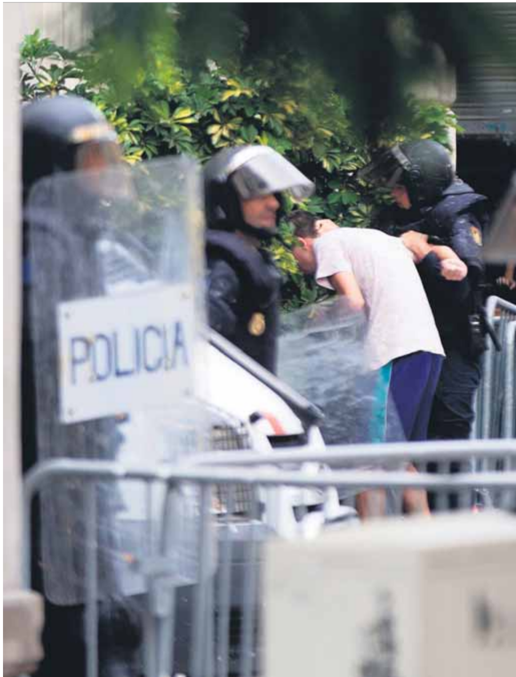
La policia espanyola deté un jove a la Via Laietana en una imatge del divendres 18