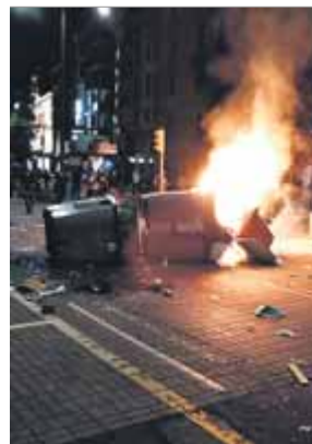
Un contenidor cremant a la ciutat de Lleida

L'Ajuntament de Lleida ha quantificat en uns 144.000 euros els danys provocats pels aldarulls arran de la sentència. 62.000 euros és el cost que suposarà la reposició de paviments de voreres i calçada i de mobiliari urbà, i prop de 82.000, la dels 109 contenidors que han resultat malmesos. ■ REDACCIÓ