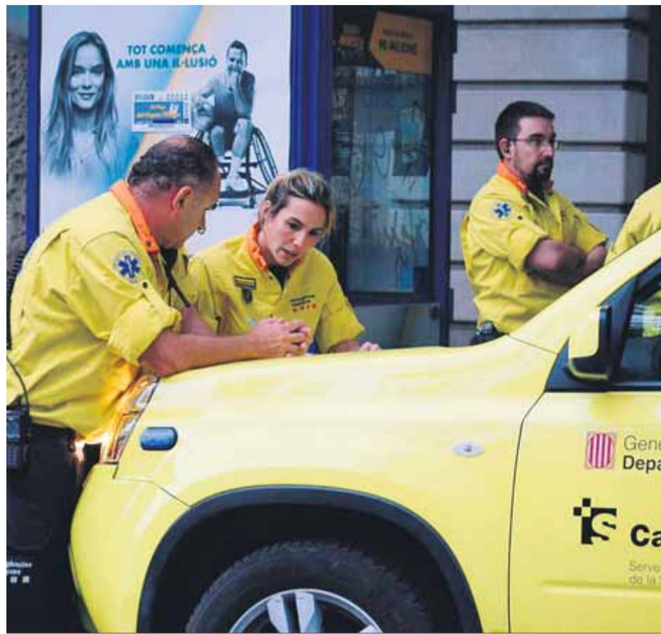
Una unitat del SEM planificant com actuar en una mobilització de la setmana passada

A mesura que els aldarulls s'intensificaven i s'escampaven pel país, el SEM va haver d'anar destinant més recursos i perfilant noves estratègies per atendre els ferits. “Inicialment, les unitats d'intervenció i suport que estaven al terreny feien l'atenció al pacient i, si era necessari, el derivaven a l'hospital. Donades les circumstàncies, però, vam veure que això no era pràctic i vam establir una nova tàctica, creant nous d'am-