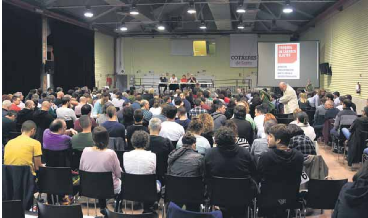
La trobada de càrrecs electes convocada per la CUP, ahir al vespre, a les Cotxeres de Sants de Barcelona

Amnistia, "prou repressió", drets socials i autodeterminació són els quatre eixos que van centrar el debat dels 287 càrrecs reu-