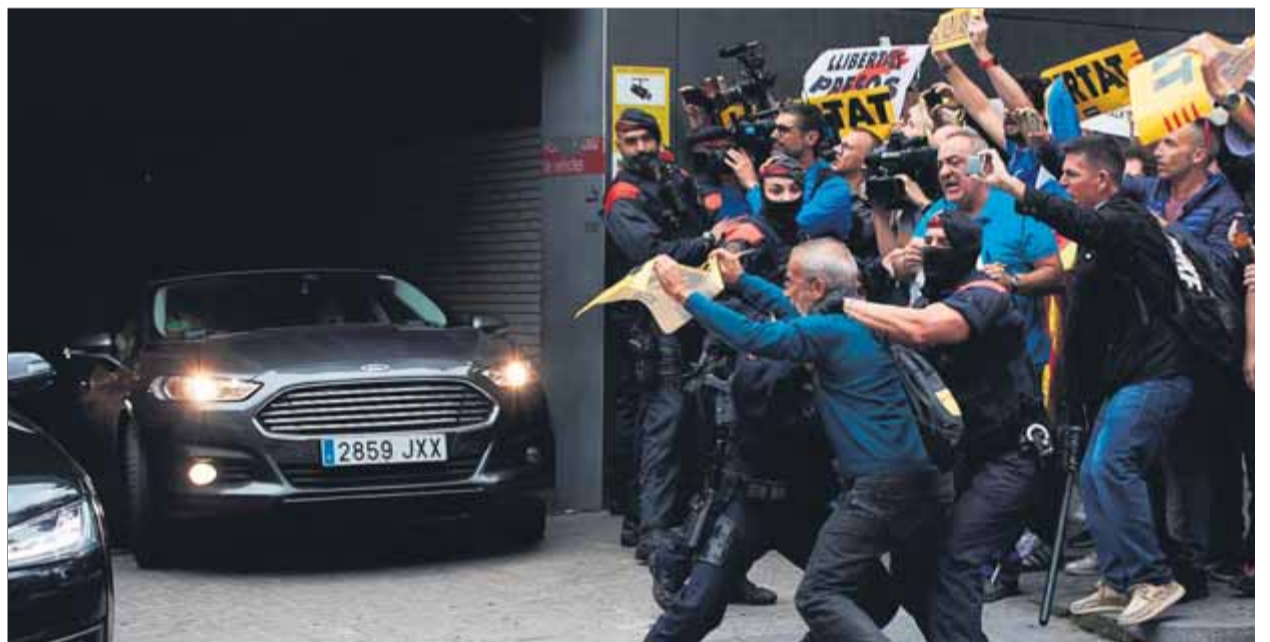
Manifestants criden davant del cotxe del president Sánchez en el moment que surt de l'hospital

Ve a donar suport al CNP i a visitar agents ferits, però continua sense voler parlar amb Quim Torra