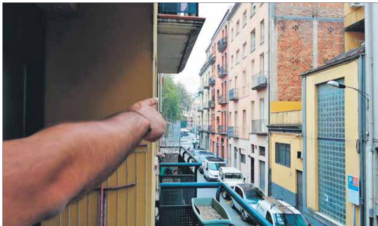
Un veí assenjala la trajectòria de la bola de foc que van veure venir quan eren al balcó

Que la "bola de foc" provenia de la plaça de la Independència i va entrar pel carrer Figuerola, ho té clar la parella que habita al pis de sota del de la dona que