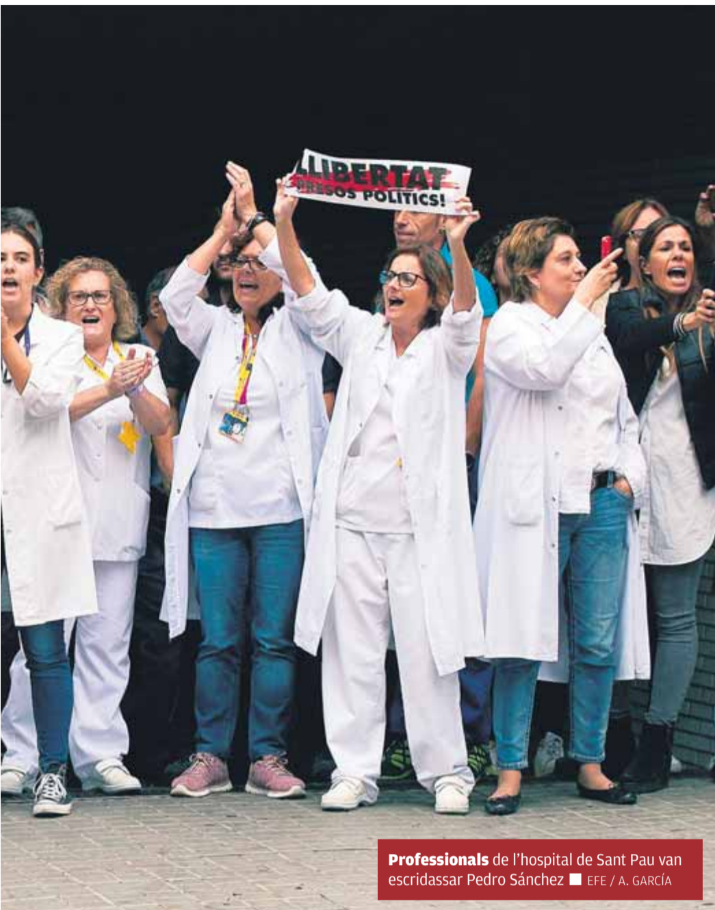
Professionals de l'hospital de Sant Pau van escridassar Pedro Sánchez