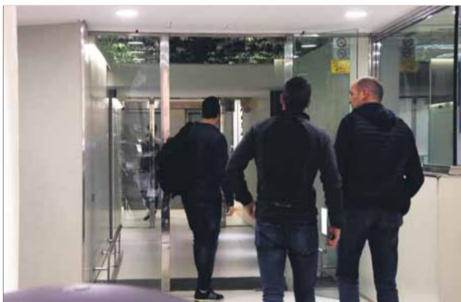
La policia estatal va escorcollar la seu de l'ACM durant hores

Tot i que la fiscalia va acordar arxivar la seva investigació contra els alcaldes pel viatge a Brussel·les després que l'ACM acredités documentalment que els 167 alcaldes havien ingressat els 300 euros que costava el desplaçament i que els que ho havien sufragat amb fons dels consistoris havien tornat després les quantitats corres-