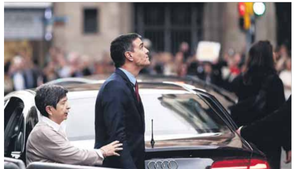
Pedro Sánchez i Teresa Cunillera surten de la prefectura de la policia espanyola

■ Acusen d'electoralisme Sánchez perquè va anar a veure sols els seus ■ Esperen consensuar una resposta al Parlament