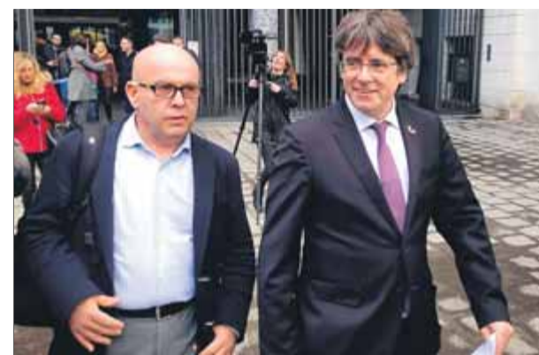
Boye amb Puigdemont sortint, dilluns, de la seu de la fiscalia belga

La candidata de JxCat al 10-N, Laura Borràs, va defensar ahir que els escorcolls de la Policia Nacional a la seu de l'ACM són una “nova ràtzia contra l'independentisme”, ja que el municipalisme és “una de les seves columnes verticals”. “Ja no hi ha casualitats en aquests moments de la pel·lícula”, hi va afegir en una roda de premsa des del Parlament. ■