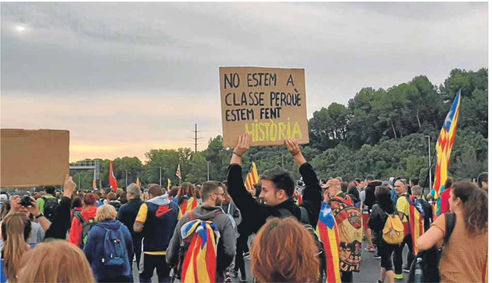
Joves participant divendres en una de les marxes per la llibertat, a l'altura de Sabadell ■ ROSA PELLICER