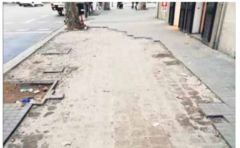
Els carrers de l'Eixample de Barcelona, escenari de les dures càrregues de la policia i dels enfrontaments amb els manifestants, han quedat sense mobiliari urbà ■ JORDI PANYELLA