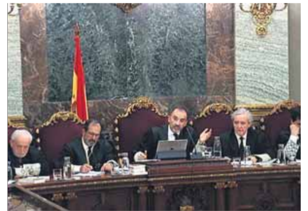
La secció segona del Suprem durant el judici ■

Per fer-ho, hem de partir del fet que en dret penal la gravetat de la pena ha de ser proporcional o adequada a la