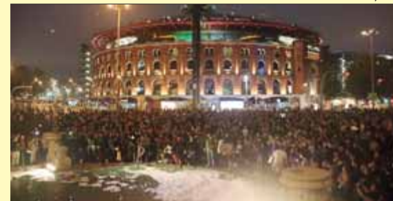
La mobilització d'ahir a Barcelona