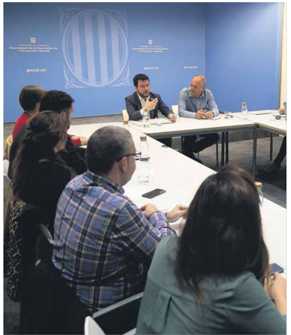
El consell assessor de l'oficina es reunia d'urgència, presidit per Pere Aragonès ■ O. DURAN

Tot i que l'ODCiP no té competències sobre la Policia Nacional, també li demanarà que avalui actuacions i que l'informi d'aquelles que no s'han ajustat als paràmetres exigibles. ■