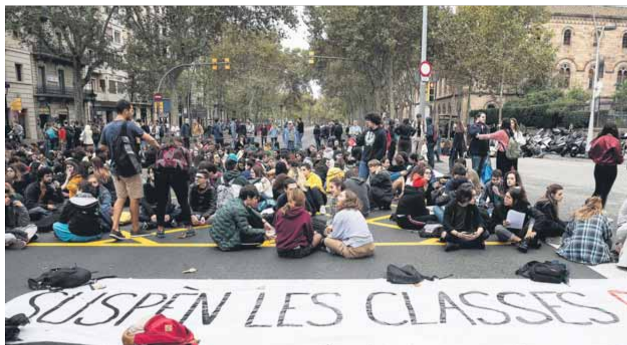
Prop de 200 alumnes van tallar ahir la Gran Via de Barcelona a la cruïlla amb el carrer Balmes

■ Diverses assemblees reclamen als rectors mesures que permetin a l'alumnat mobilitzar-se ■ Acaba el bloqueig a Girona i es talla la Gran Via a Barcelona