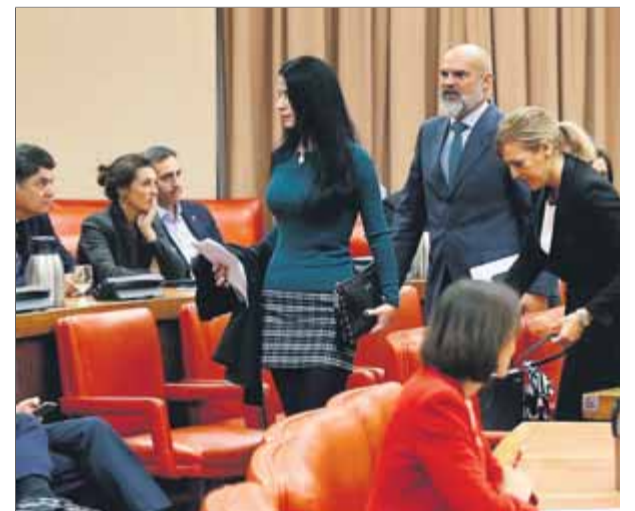
La secretària general del grup ultradretà Vox, Macarena Olona, expulsada de la Diputació Permanent

cia contra els presos polítics, fet que va obligar els uixers a acostar-s'hi per demanar-li que abandonés la sala. Finalment els diputats taronges van seure als llocs que ocupava Vox. Ja a fora, Vox va acusar Batet d'impedir el debat sobre la “crisi” amb Catalunya i d'una “retallada del dret a la paraula”. ■