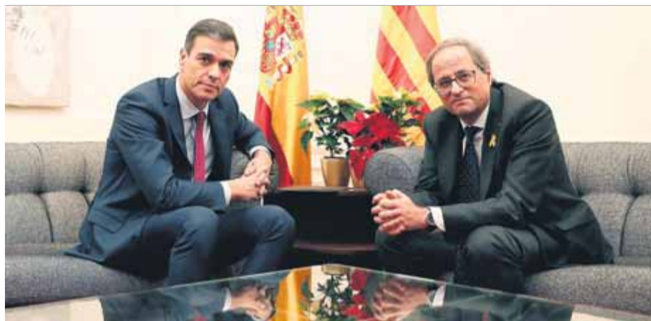
Els presidents Pedro Sánchez i Quim Torra, en una de les reunions que han mantingut