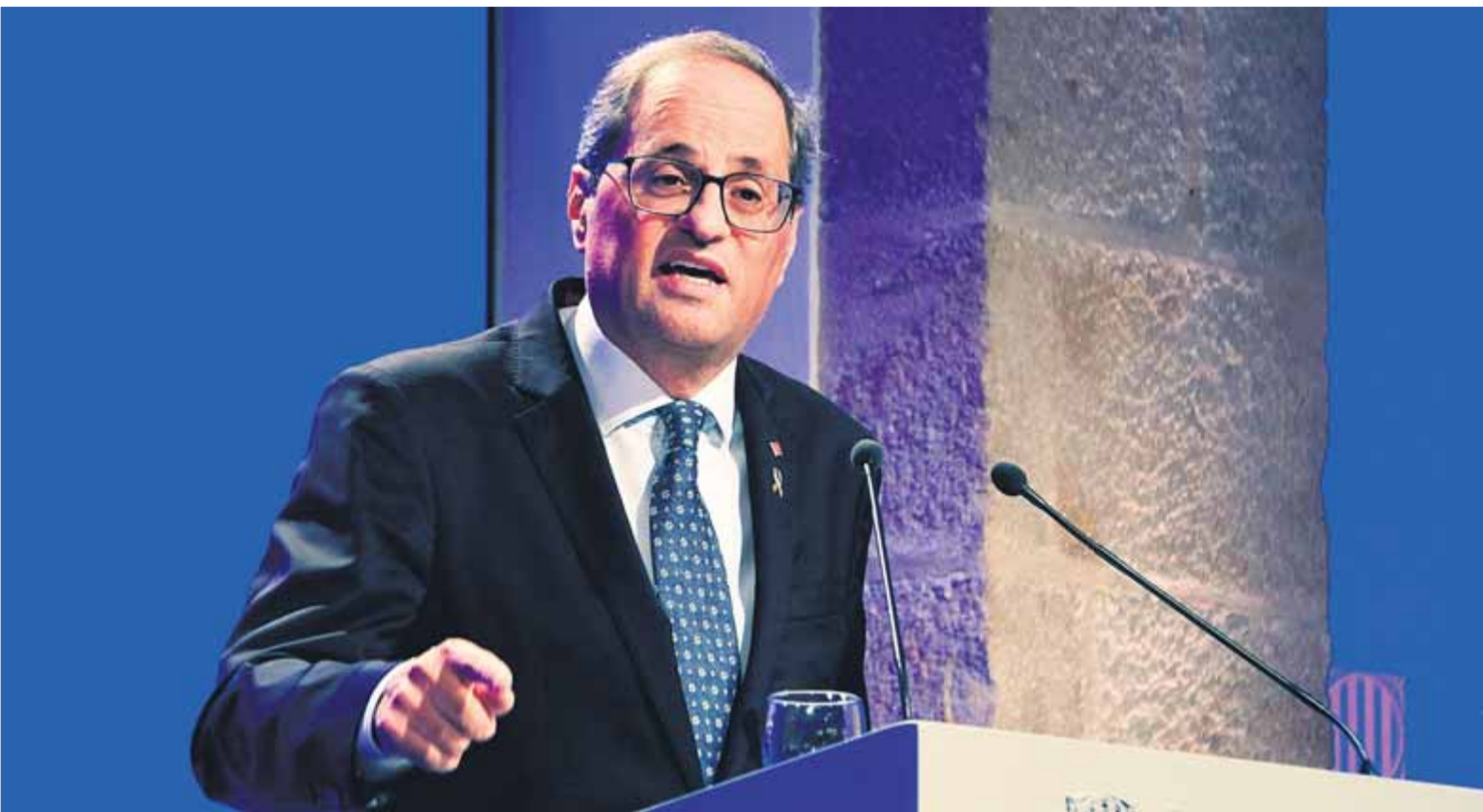
El president de la Generalitat, Quim Torra, durant la roda de premsa posterior a la reunió de l'executiu al Palau