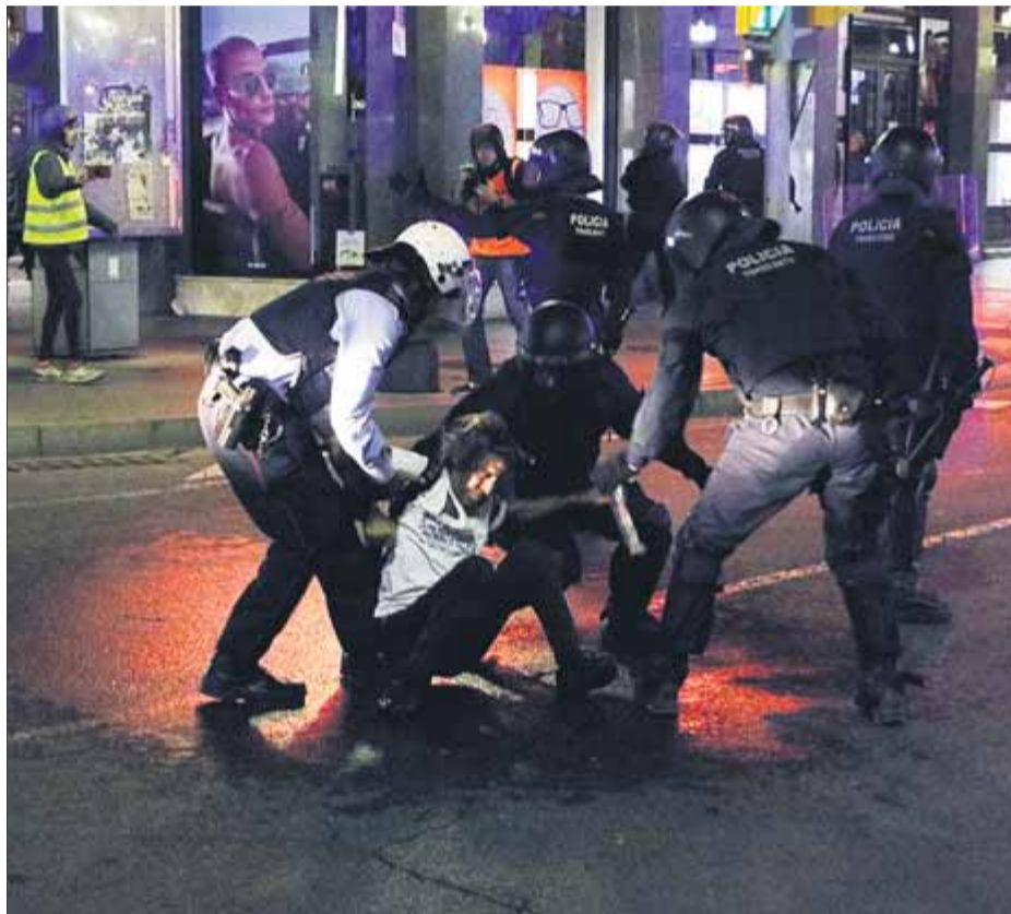
Càrrega dels Mossos d'Esquadra a Tarragona, divendres passat

En la seva compareixença, Buch va tornar a demanar als mitjans de