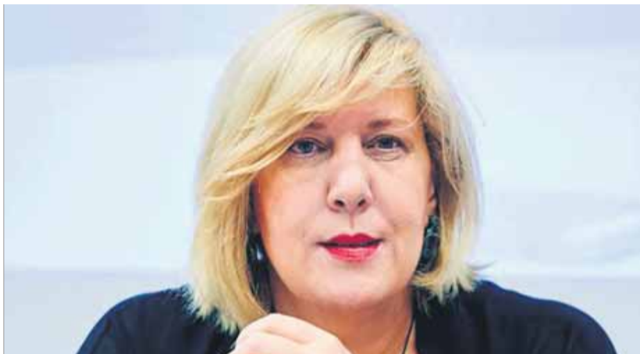
Dunja Mijatovic és la comissionada de Drets Humans a la Comissió Europea

tovic va exigir que s'investigui "l'ús excessiu de la força" per part de la Policia Nacional i els Mossos i va mostrar preocupació pels "nombrosos informes" d'atacs contra periodistes. Conscient dels "reptes" que afronta la policia davant d'"atacs violents" i "nombrosos actes de van-