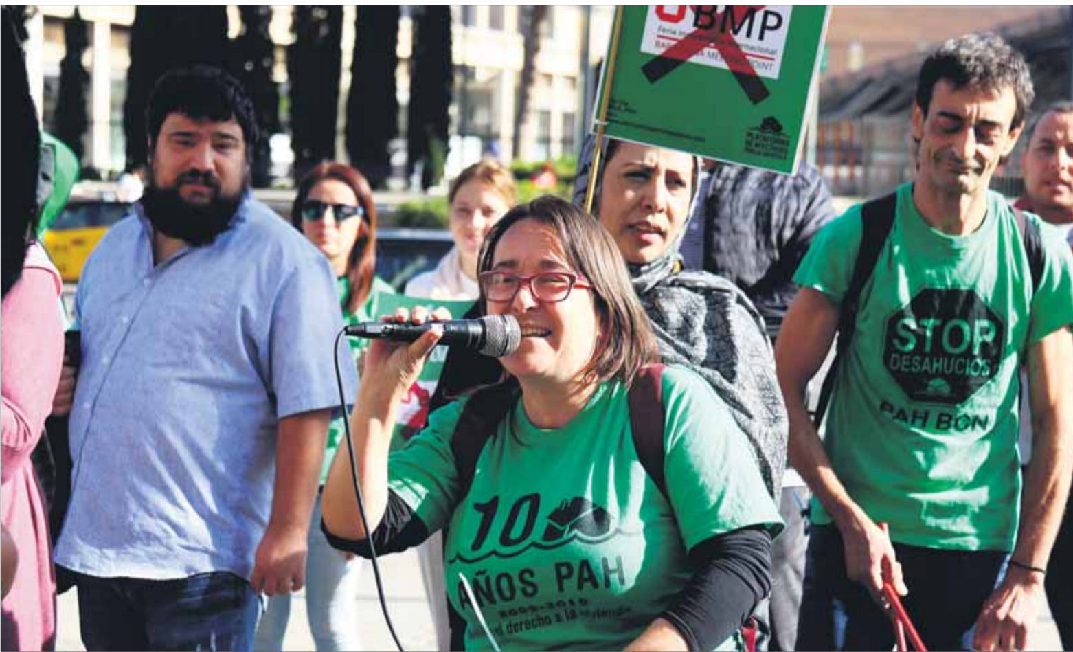
Membres de la PAH de tot Catalunya, en la darrera manifestació de fa uns dies, a la fira del Meeting Point, on una trentena van ser identificats per la policia