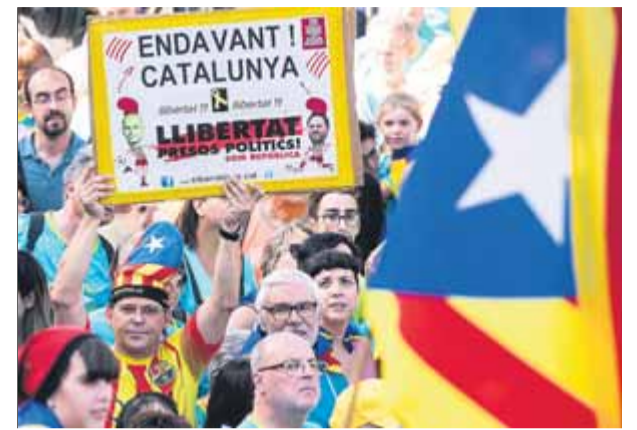
Participants en la manifestació de les entitats sobiranistes, la Diada passada a Barcelona

subdelegació de l'Estat a Tarragona, pel fet que agents antiavalots van entrar a l'hospital de Santa Tecla a buscar manifestants. Hi van detenir una noia. Salut els recorda que els centres sanitaris atenen tothom sense distinció. L'entrada va provocar que alguns col·lectius recomanessin als ferits no acostar-se als centres de salut. ■