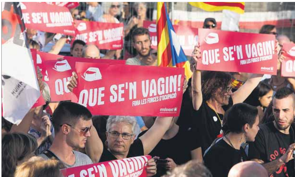
Concentració a Sabadell el 28 de setembre passat, en suport als set detinguts dels CDR