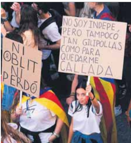
Unes joves en una manifestació

La majoria dels joves, que en grans trets no superen els 25 anys, afirma que no formen part de cap organització ni estudiantil ni política, però que, a partir de les xarxes socials, s'assabenten de les convocatòries i s'organitzen per desplaçar-s'hi amb grups d'amics. No són els primers indicis