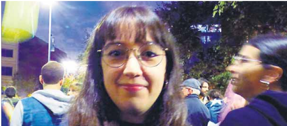
La Haizea, a la concentració de dilluns davant de la seu del Departament d'Interior