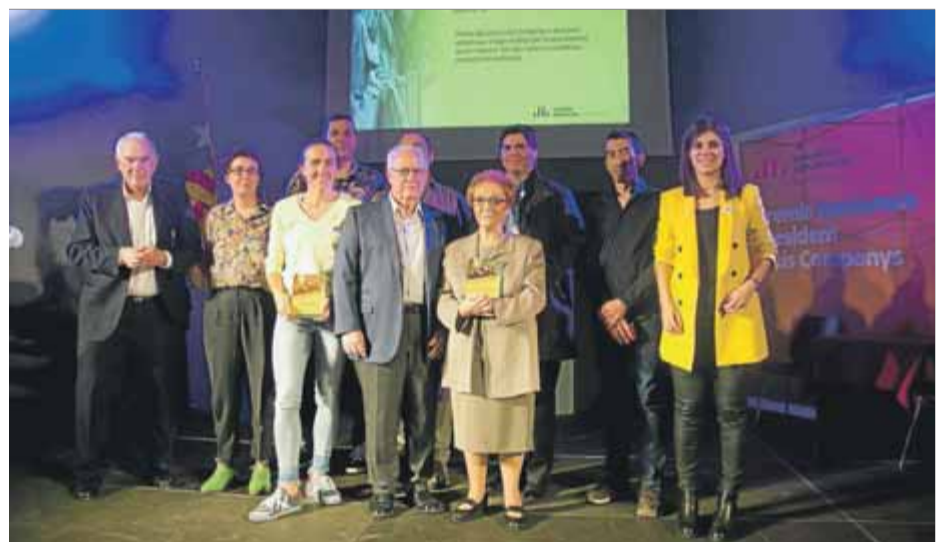
Foto de grup dels premiats en l'acte d'ahir al centre Pepita Casanelles

sones i entitats que s'han distingit per la defensa del país, l'acció cívica i la feina en defensa de les llibertats. “Actes com aquest són útils en moments en què ens necessitem units, donant-nos la mà i demostrant com la força que tenim és la col·lectiva”, destacava en la cloenda la portaveu, Marta Vilalta. ■