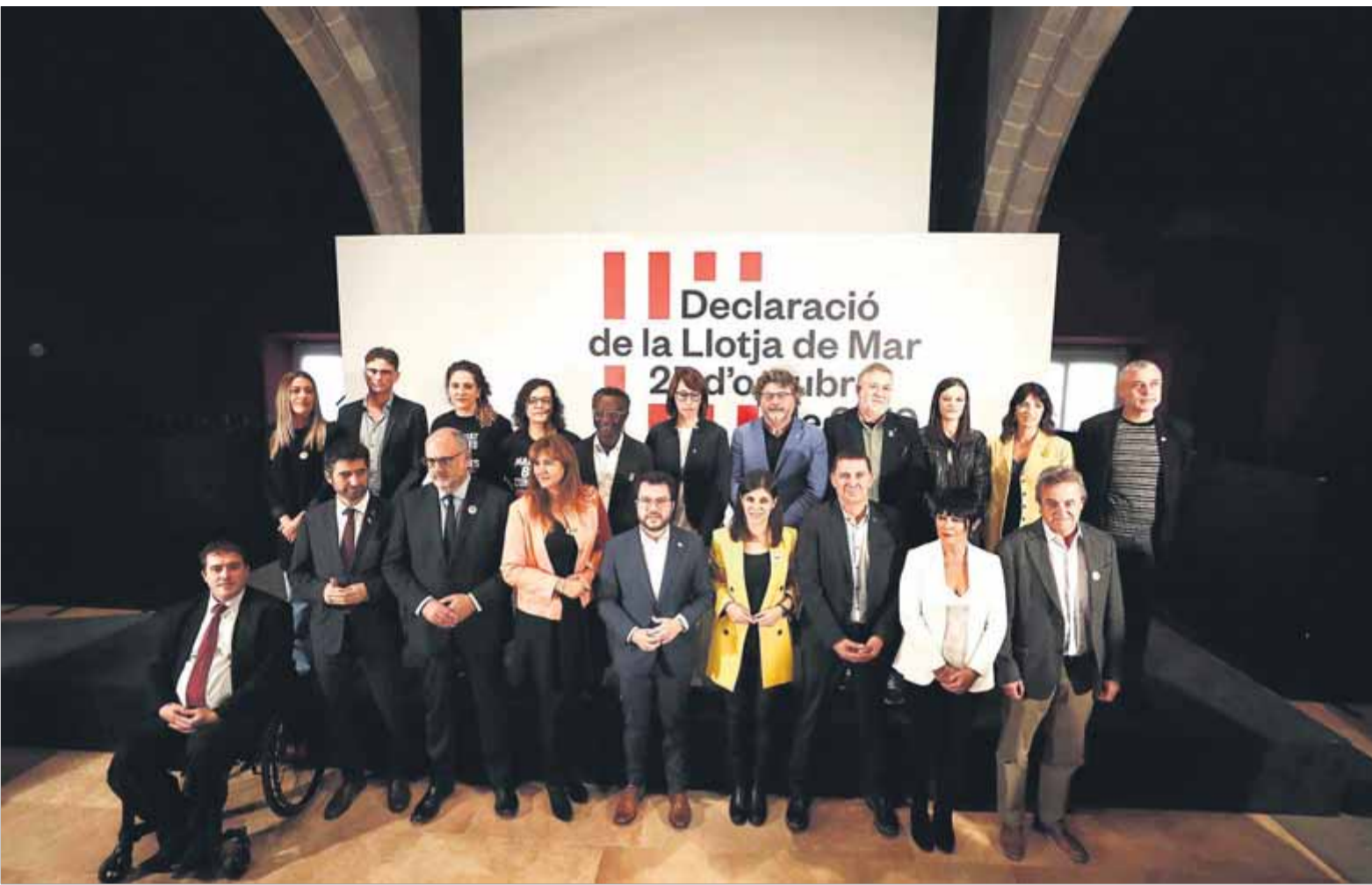
Els representants de les formacions que van firmar ahir al matí la Declaració de la Llotja de Mar