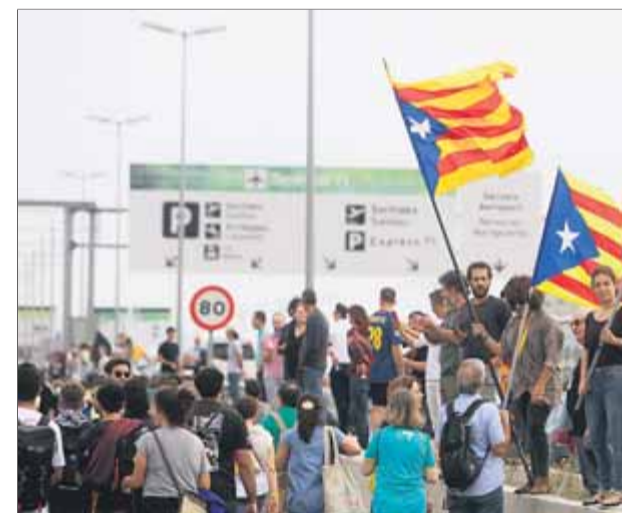
Milers de ciutadans mobilitzats per Tsunami Democràtic ja van bloquejar l'aeroport del Prat el dia de la sentència

ció", i mostra el "rebuig absolut" a les "agressions policials i a la repressió" contra manifestants i periodistes de la setmana passada. Així, diu que "és el seu problema" si l'Estat qualifica d'accions terroristes protestes com ara les que promou, emparades en la no-violència. A més, denuncia la falta de compromís amb la llibertat d'expressió de les operadores de telecomunicacions, que han permès el bloqueig dels seus webs, i es pregunta si la UE "pot acceptar" que aquest dret quedi "trepitjat" dia sí dia també a Catalunya. ■