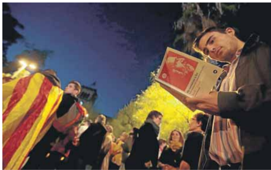
L'ambient als carrers del centre de Barcelona, ahir al vespre i a la nit