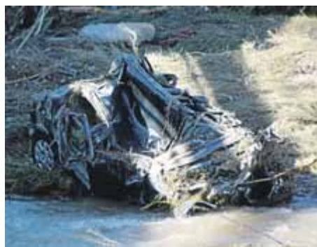
Un cotxe destrossat al riu Francolí

Continua la recerca dels quatre desapareguts en l'aiguat i les tasques per refer els serveis