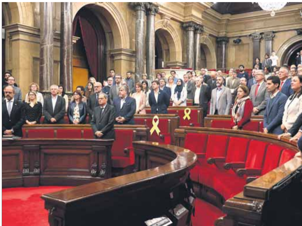
Els diputats en el ple de dimecres passat, durant el minut de silenci pels afectats pels aiguats

Les lleis que han estat modificades són les del Consell de l'Audiovisual de Catalunya, el CAC, l'òrgan que gestiona la regulació dels mitjans i vetlla pels continguts, i la de la Corporació Catalana de Mitjans Audiovisuals, que s'encarrega dels productes estel·lars, la televisió i la ràdio. Les modificacions afecten el procés d'elecció dels membres de govern de tots dos ens, ja que a partir d'ara, per resultar aprovats en el ple del Parlament, caldrà una majoria de dos terços, tant en primera com en segona volta, contràriament a la majoria absoluta que requeria la llei en l'últim tram. El nombre de representants també ha