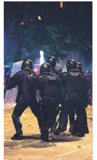
Policies Nacionals, en els enfrontaments ■ M.L.