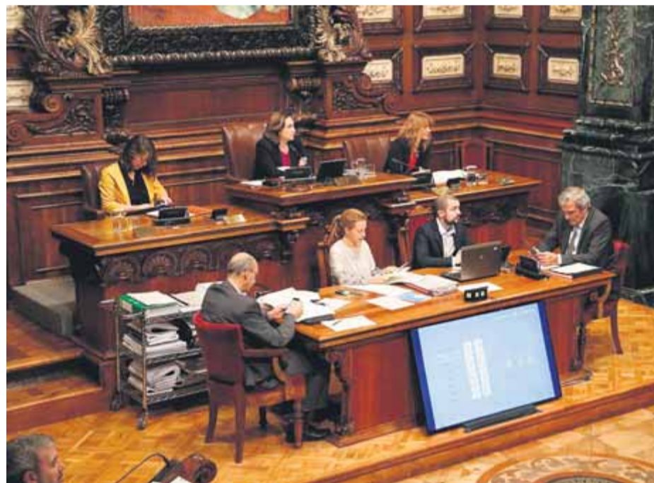
Ple de l'Ajuntament de Barcelona, ahir al matí, presidit per l'alcalde Colau

El vot favorable de Barcelona en Comú, amb l'alcalde Colau al capdavant, mostra la discrepància en aquestes qüestions amb el seu soci de govern, el PSC. El regidor dels comuns, l'exsocialista Jordi Martí, va defensar com a "indispensable" que el ple municipal rebutgés la sentència del Suprem per "injusta", però també perquè suposa la judicialització d'un conflicte "que era polític". La proposició que ERC i JxCat van transaccionar amb Barcelona en Comú compromet l'Ajuntament a treballar amb la resta d'institucions i la societat civil per "trobar solucions" que permetin la llibertat dels presos i defensa que la