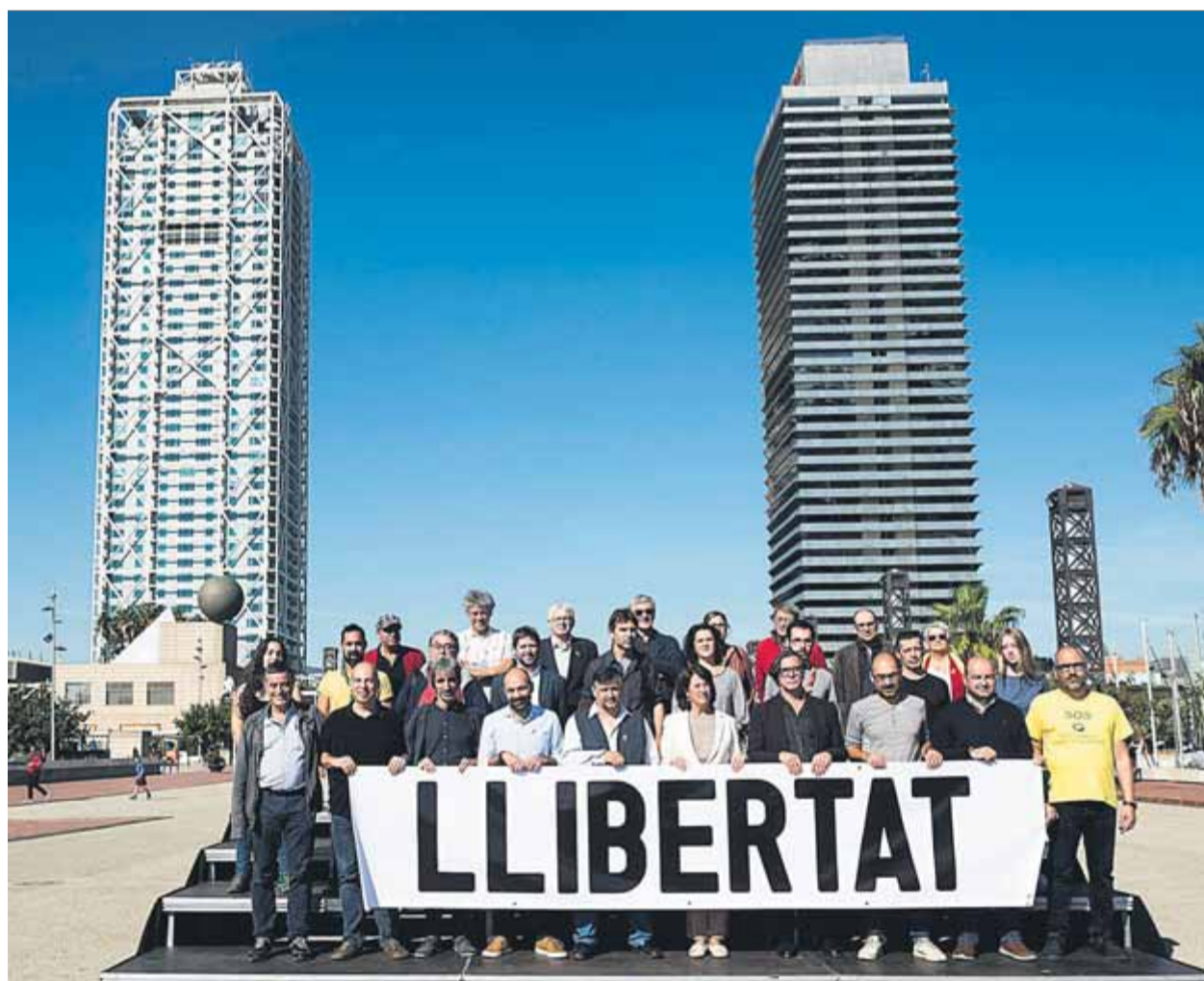
Representants d'entitats adherides a la manifestació mostren la pancarta amb el lema que la presideix

CAPITAL • Barcelona exigeix, per una gran majoria del ple, l'alliberament dels presos polítics i la sortida dialogada al conflicte