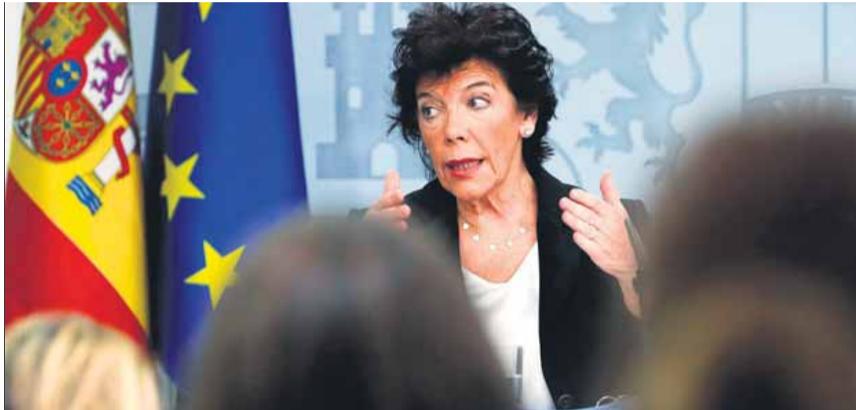
La portaveu del govern espanyol, Isabel Celaá, ahir, després del consell de ministres

Celaá va prometre que l'Estat continuarà perseguint i detenint els autors d'“agressions i pillatge” i d'“actes vandàlics” a Catalunya. Segons les seves dades, hi ha més de 200 ar-