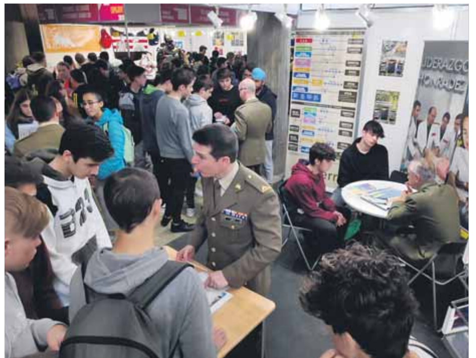
Militars amb l'uniforme durant l'Expojove d'aquest any

Però tot no va acabar aquí, ja que la Fundació Fira de Girona va presentar un recurs d'apel·lació contra la sentència que permetia a l'exèrcit espanyol assistir a l'Expojove i que hi pogués exhibir elements bèl·lics i soldats uniformats. Ara l'Audiència ha resolt aquest recurs d'a-