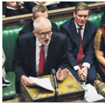
El laborista Jeremy Corbin

Els laboristes consideren que el 'Brexit' sense acord s'allunya i avalen els comicis, tot i beneficiar Johnson