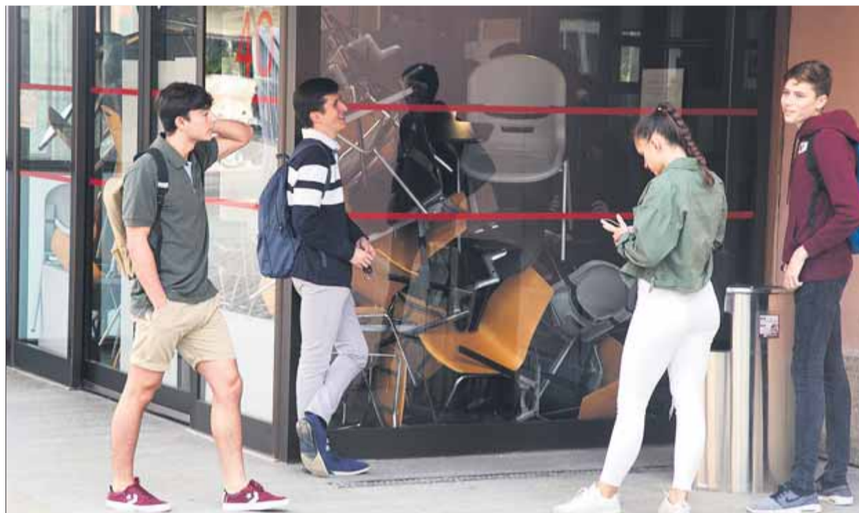
Un dels accessos a un edifici del campus Ciutadella de la UPF, bloquejat ahir amb mobiliari

La UPF es caracteritza per aplicar un model docent que insisteix en les classes presencials i l'avaluació continuada, difícilment compatible amb el seguiment intensiu de les mobilitzacions en contra de la sentència del Suprem i la repressió policial. En el manifest de crida a la vaga indefinida, el SEPC recorda que els universita-