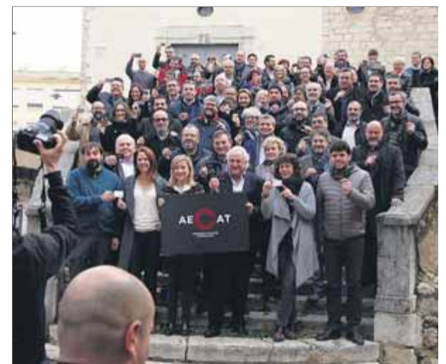
Fa tres anys ja es va fer un intent d'organitzar una assemblea d'electes, però no va reeixir. La d'ara no hi té res a veure ■ J.S.

hora, però diverses fonts consultades han indicat que la intenció seria que en sortís alguna declaració, i potser l'anunci d'accions concretes. En tot cas, avui l'espai estarà preparat per si s'han de dur a terme votacions dels assistents. La intenció és que l'òrgan, convocat com a resposta a la sentència del Suprem, funcioni de manera autònoma, a través d'un grup impulsor ja format per alcaldes i líders locals, ja que té voluntat de continuïtat i s'anirà reunint en funció dels esdeveniments polítics. ■