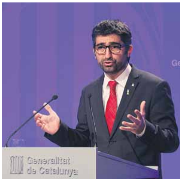
El conseller Jordi Puigneró explicant ahir els acords presos en la reunió del Consell Executiu del govern

L'Agència de Ciberseguretat s'estructurarà a partir de l'absorció dels actius del Centre de Seguretat de la Informació de Catalunya (Cесicat) i els seus 29 treballadors, però té la previsió clara de continuar creixent en mitjans i funcions. Mentre que el pressupost actual del Cесicat és de 7,5 milions d'euros,