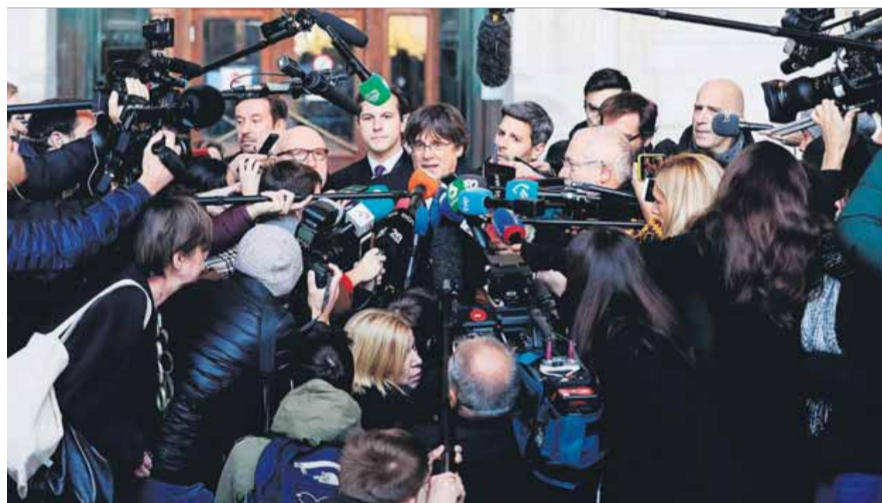
Expectació mediàtica per la vista que s'havia de celebrar a Brussel·les. Al mig, Puigdemont

SUPORT • Budó defensa que Torra confia plenament en Buch, mentre que la CUP torna a demanar que se'l destitueixi