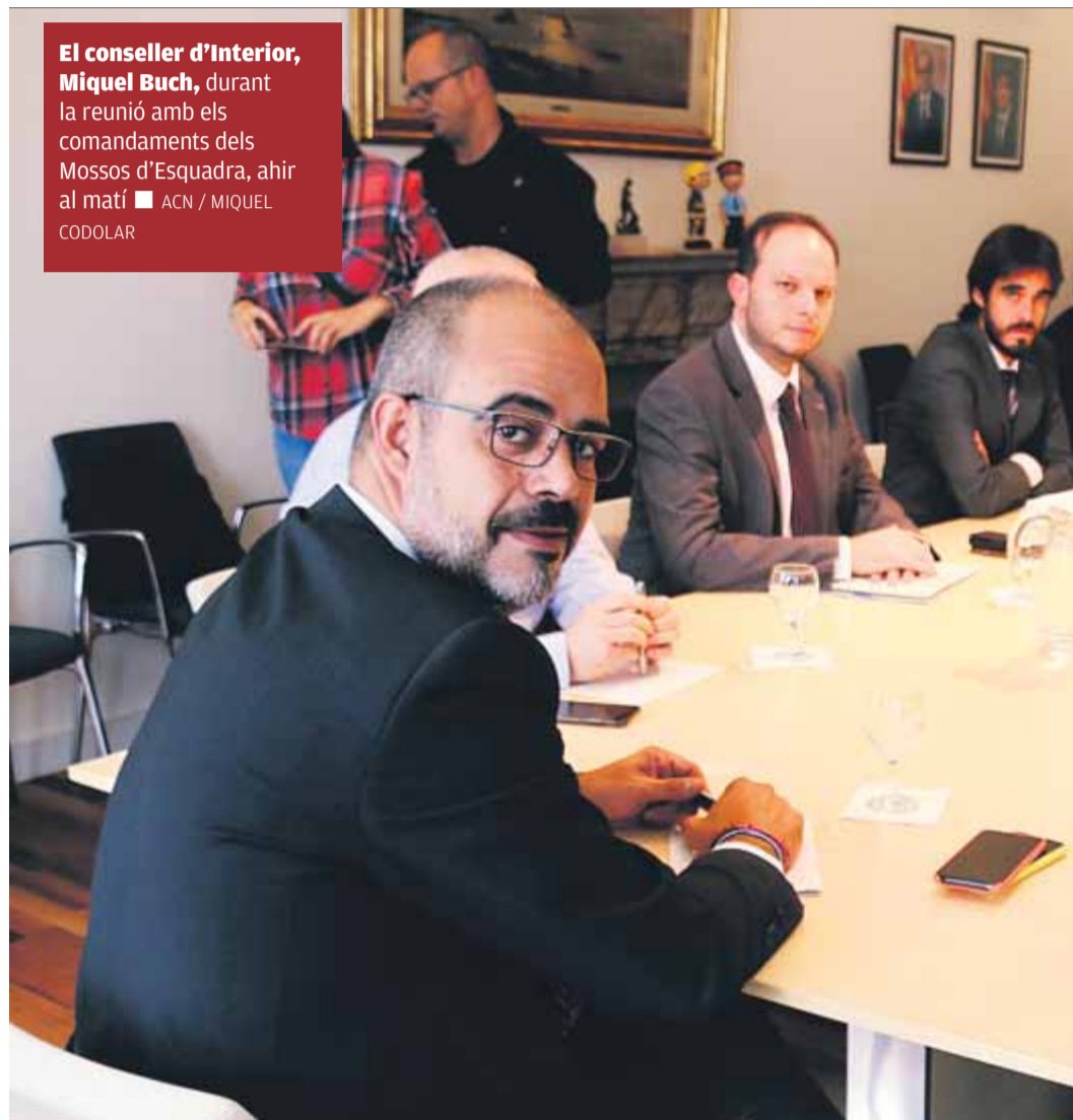
El conseller d'Interior, Miquel Buch, durant la reunió amb els comandaments dels Mossos d'Esquadra, ahir al matí

Quan li van preguntar si el govern estava satisfet de la coordinació entre els cossos de seguretat, la por-