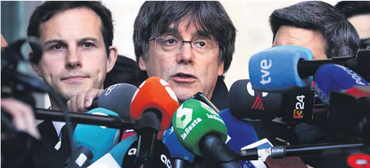
El president a l'exili, Carles Puigdemont, atenent ahir els mitjans de comunicació després de comparèixer davant la justícia belga ■ NAZARET ROMERO / ACN

■ El tribunal de primera instància concedeix un mes i mig per presentar-hi al·legacions ■ S'espera una decisió sobre l'extradició poc després de Nadal ■ La fiscalia belga dona suport al procediment