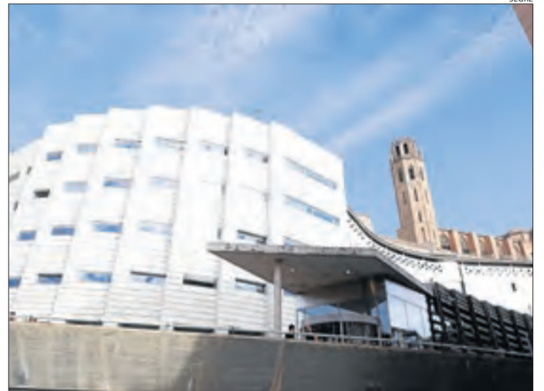
Vista de la seu dels jutjats de Lleida al Canyeret.

LLEIDA | L'activitat dels jutjats lleidatans al tancament del segon trimestre d'aquest any va registrar un augment respecte al mateix període del 2018, amb un 10 per cent més de causes judicials ingressades, sobretot per qüestions de família i mercantil, en l'àmbit civil, i de delictes de menors o per violència contra la dona, a la secció penal. Segons les dades publicades ahir pel Consell General del Poder Judicial, els tribunals de la província de Lleida van ingressar un total de 12.729 assumptes nous entre els mesos d'abril i juny d'aquest any, la qual cosa implica un augment del 9,9% respecte als mateixos mesos de l'exercici anterior. Aquest augment es deu, en més proporció, al creixement de l'activitat als jutjats mercantils, que resolen, entre altres qüestions, les demandes presentades per productes financers abusius com les clàusules sòl o les preferents. Segons el Poder Judicial, aquests jutjats han ingressat un 330 per cent més d'assumpes a les comarques de Ponent en el segon trimestre de l'any. Els segueixen els casos ingressats a la secció civil de l'Audiència Provincial de Lleida, que també resol sobre les demandes contra la banca, amb un increment del 51,5%, i els assumptes de família, amb un augment del 33,4%.