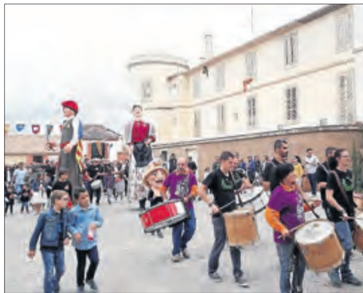
Imatge d'arxiu de la festa anual de l'any passat.