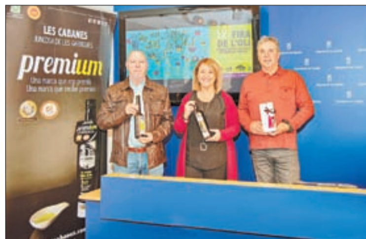
La nova edició de la fira es va presentar ahir

Pel que fa a les obres executades durant l'any 2019 destaca la inversió global en manteniment de la línia, que ascendeix als 6 milions d'euros. Aquest any s'han realitzat obres en el manteniment de talussos, en la col·locació de baranes en els ponts i viaductes, la millora de cobertes dels edificis de les estacions a Tremp, Cellers-Llimiana, Sant Llorenç de Montgai i Balaguer, obres als túnels, millores a les superestructures, drenatges, millora de la senyalització, els canvis d'agulles a les estacions i el reforç de la videovigilància als passos a nivell.