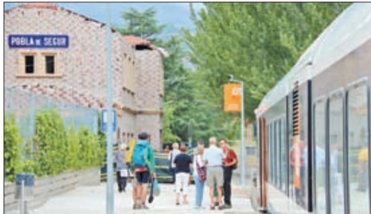
Viatgers esperant el tren a la Pobla de Segur

La línia del tren de Lleida-La Pobla de Segur confia superar els 250.000 viatgers aquest 2019. Aquesta xifra no es registrava des del 2008. La Comissió de Seguiment del Servei Lleida – la Pobla de Segur–Esterrí d'Àneu, celebrada ahir a la Pobla de Segur, va valorar positivament aquesta xifra, ja que durant el període 2012-2015 els viatgers anuals es van situar per sota dels 100.000. Respecte al 2015 es constata un augment del 40%. Pel que fa a l'Índex de Satisfacció del Client de l'any 2018 es destaca que la línia Lleida–la Pobla de Segur assoleix el rècord de satisfacció dels usuaris d'entre totes les línies que gestiona Ferrocarrils de la Generalitat de Catalunya (FGC). Els usuaris