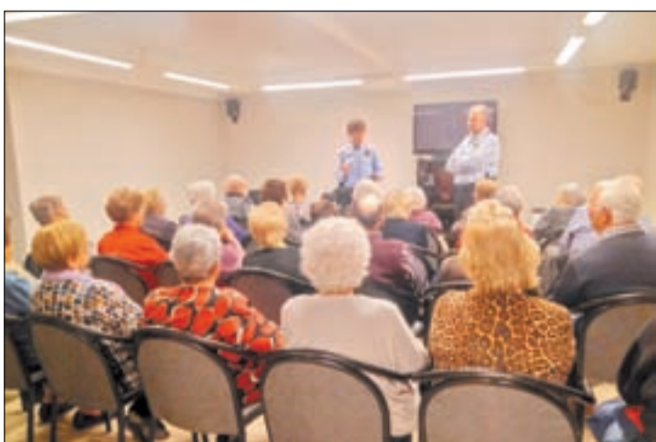
Els Mossos van impartir la xerrada

Agroseguro pagarà el 300% del capital assegurat pels danys a les plantacions causats per l'incendi de la Ribera d'Ebre i que va afectar també les comarques del Segrià i les Garrigues. Així ho va anunciar ahir el sindicat agrari JARC, que la setmana passada va efectuar una reclamació davant la companyia perquè rectificqués després d'abonar inicialment només el 100% del valor als afectats. L'organització agrària va revisar totes les actes i va constatar que només s'havia fet efectiu un terç del 300% del valor que preveu la normativa. Ara, Agroseguro els ha donat la raó i ha respost que seran ells qui revisaran totes les actes.