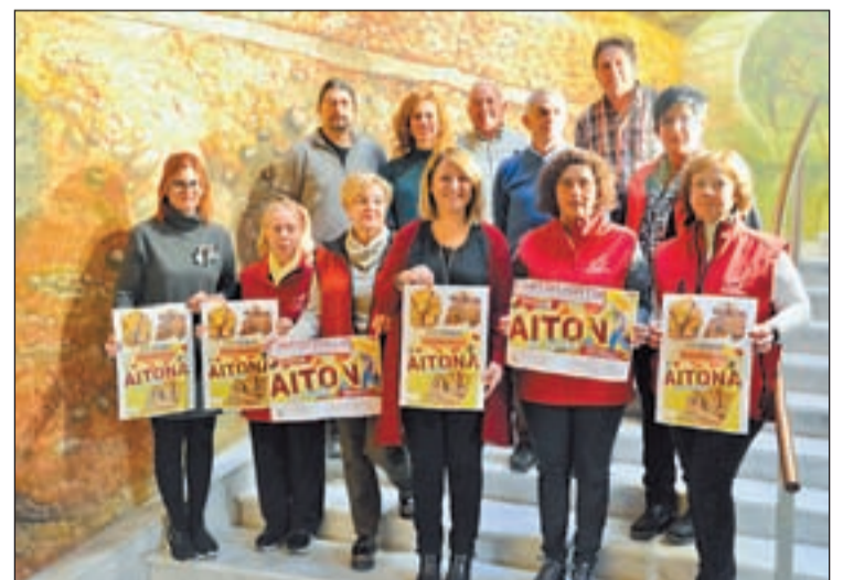
La jornada es va presentar ahir a la Diputació