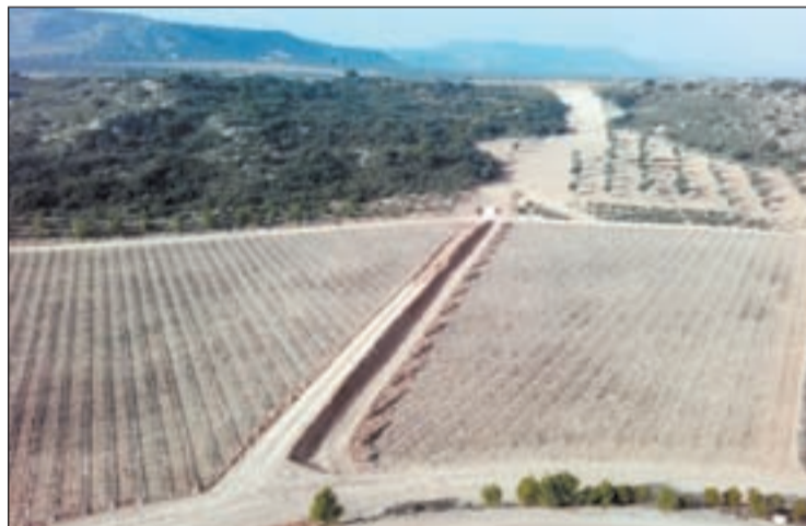
Vista aèria de la concentració parcel·lària a Castellldans

Aquest fet representa que un gran nombre de propietaris ha vist reduït el nombre de finques de conreu a 1 o 2, obtenint-se així, un important estalvi en ga-