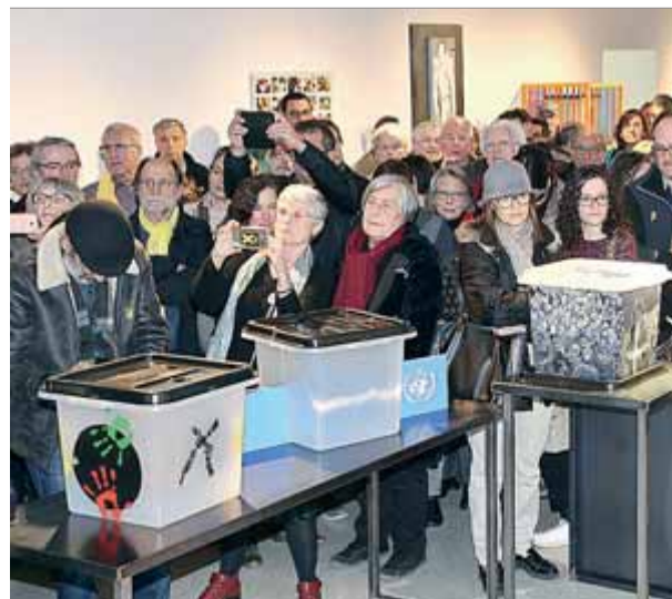
Inauguració de l'exposició a Girona, el gener passat ■ M. LL.

bre la notificació de part dels Mossos d'Esquadra, estudien si presenten recurs o si obeeixen la decisió dins les 48 hores de termini que ha establert l'organisme electoral. L'exhibició està programada fins al 8 de novembre a la sala d'exposicions del Palau Oliver de Boteller de Tortosa.