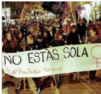
Concentració contra la sentència, ahir al vespre a Manresa

L'Audiència condemna els joves a entre 10 i 12 anys però sosté que no van utilitzar la força perquè la noia estava inconscient