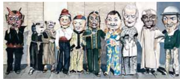
Festa Major — Sant Crist 2019 — 2, 3, 8, 9 i 10 de novembre Balaguer

La victòria a Catalunya, entre ERC, PSC i comuns