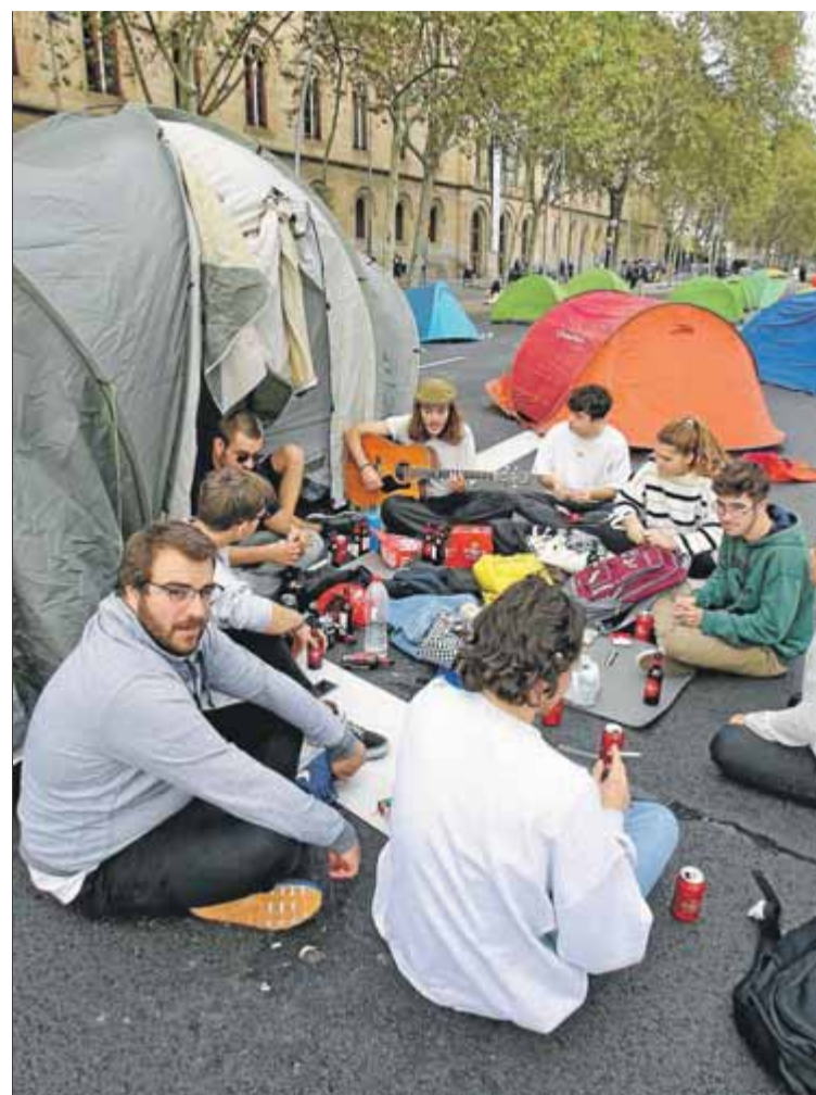
A l'esquerra, la manifestació passant per la plaça Catalunya de Barcelona. A la dreta, un grup de joves acampats a la plaça Universitat