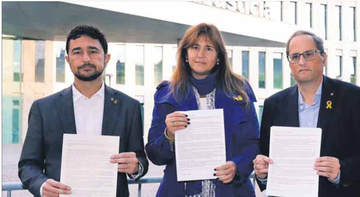
El president Quim Torra, el conseller Calvet i la diputada Borràs, ahir, amb les seves autoinculpacions

"Ni les amenaces ni el menyspreu poden aturar la ciutadania de ser conscients del moment històric que estem vivint i d'exercir els drets negats, com