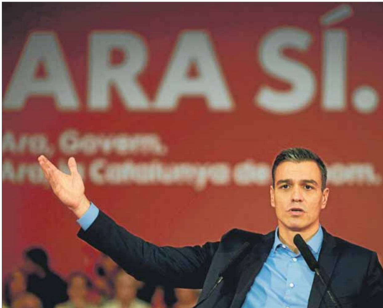
Sánchez intervenia en el seu últim acte preelectoral dimecres a Viladecans

El decret ad hoc contra una república digital entrarà en vigor dimarts amb la publicació al BOE, tot i que haurà de ser aprovat a la Diputació Permanent del Congrés perquè les Corts estan dissoltes, i des d'ara el PSOE ja reclama al PP i Ciutadans el seu vot. Si la vicepresidenta Calvo va presentar el text aprovat d'urgència com un pla de ciberseguretat sota el paraigua de la llei de seguretat estatal i que vol vetllar per la pulcritud de les eleccions del 10 de novembre –“hi ha situacions en l'ordre quotidià de les nostres vides en què s'ha de reaccionar com més aviat millor”, és el més concret que va dir–, Sánchez era més directe a Onda Cero. “El decret tindrà com a conseqüència que les dades no puguin ser utilitzades per part de cap