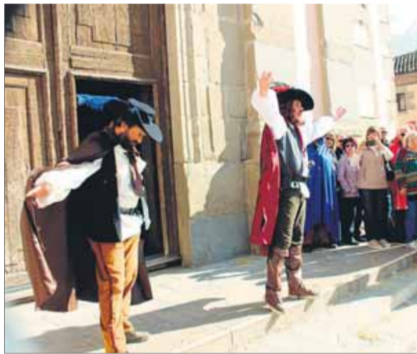
Olost torna diumenge a l'època del bandoler del Lluçanès, Perot Rocaguinarda, amb moltes propostes