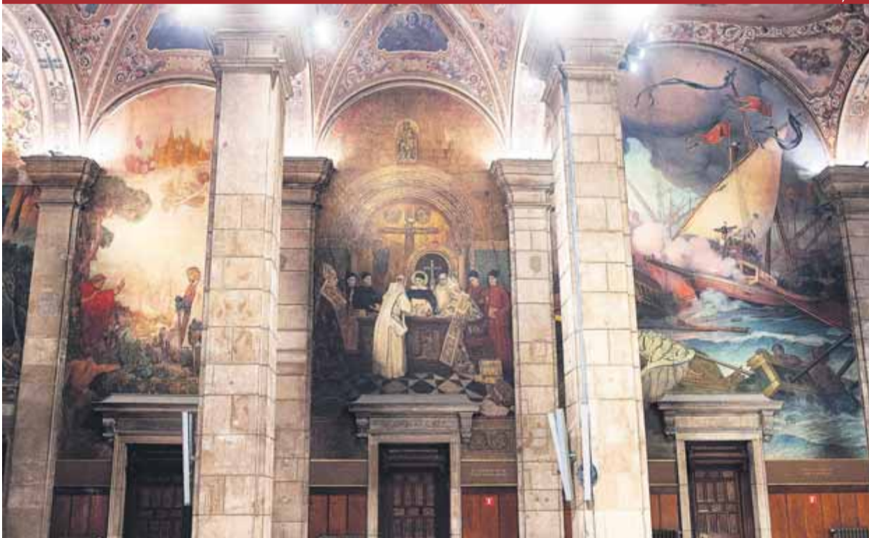
Pintures sobre Jaume I a Mallorca, el Compromís de Casp i la batalla de Lepant, en un dels laterals del saló ■ JOSEP LOSADA