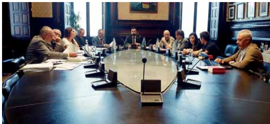
Una imatge d'arxiu dels membres de la mesa del Parlament

El tribunal admet un recurs d'empara del PSC i alerta que la mesa no pot tramitar textos inconstitucionals