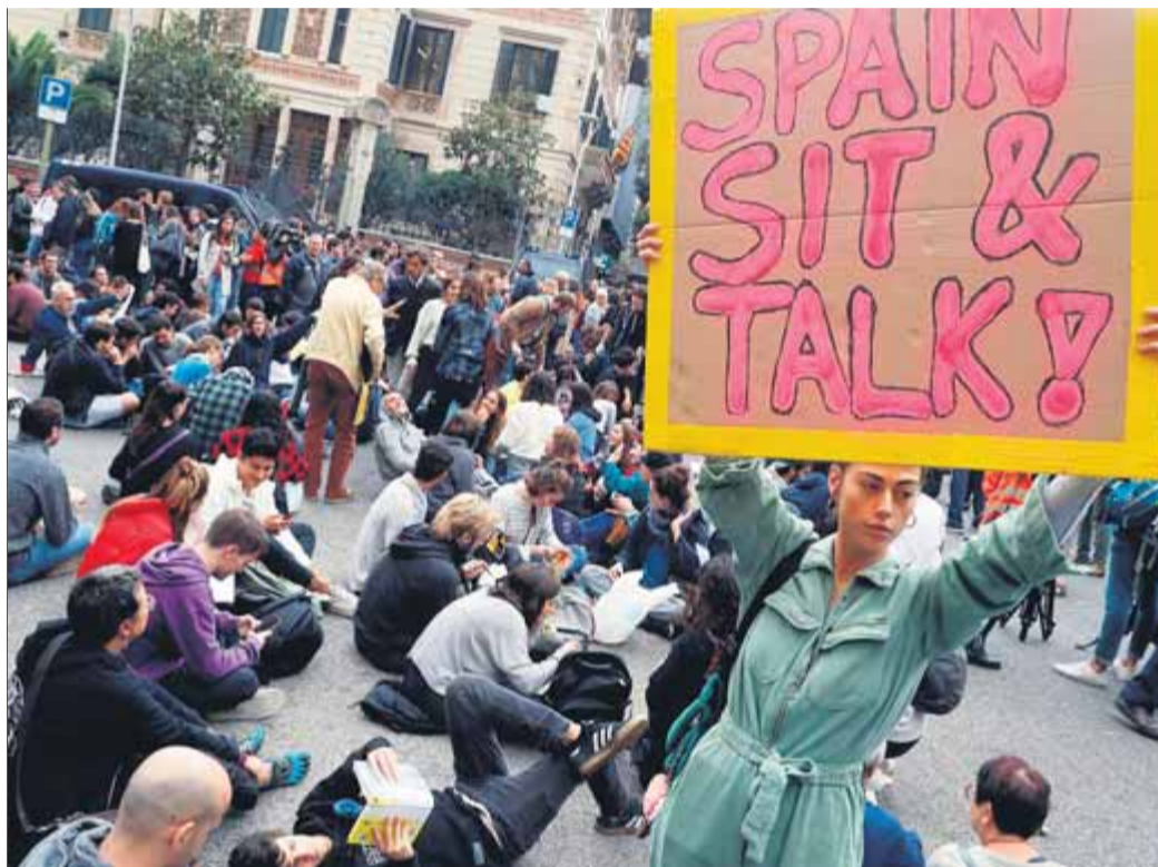
Acció de protesta convocada per Tsunami Democràtic davant de la Delegació del Govern espanyol

Tsunami es proposa que l'acció de protesta del dia de reflexió giri a l'entorn de la condemna a la sentència del Tribunal Suprem, el suport als presos polítics i els exiliats, el rebuig també a la violència policial que s'ha vist aquests dies als carrers, la denúncia a la incapacitat de diàleg de l'Estat espanyol i a l'ús partidista que fan de Catalunya els partits espanyols amb l'únic objectiu de treure vots.