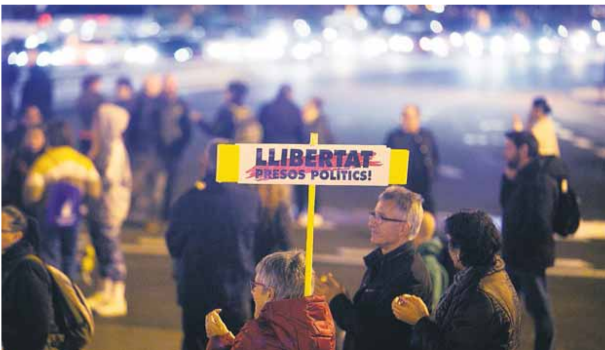
Els veïns persisteixen, cada vespre, en les mobilitzacions per denunciar la sentència dictada pel Suprem ■ ORIOL DURAN