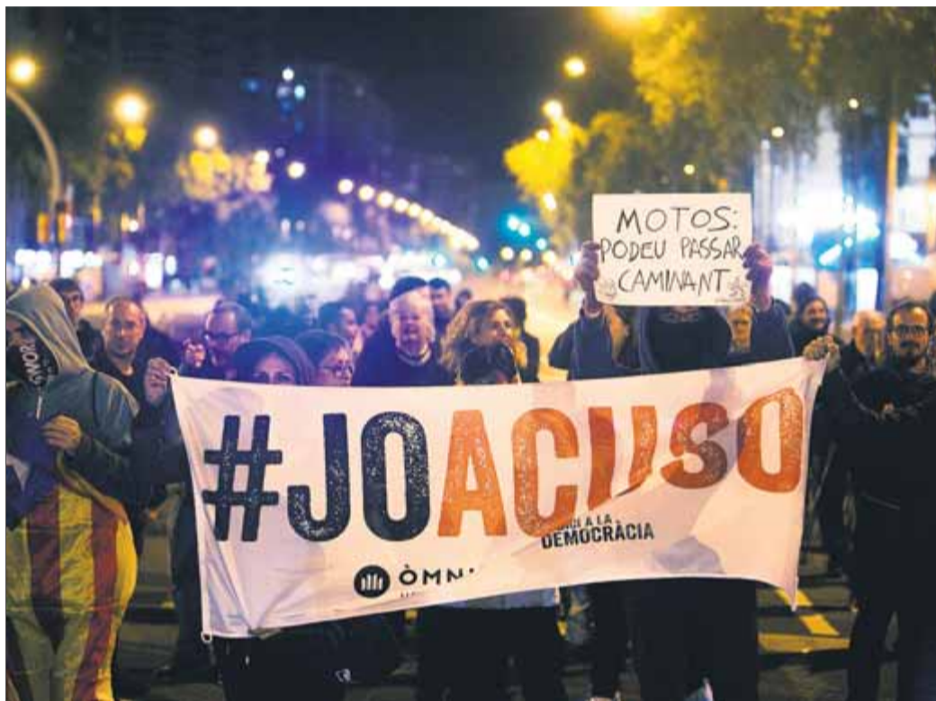
Ciutadans durant el tall de la Meridiana amb Fabra i Puig, ahir a Barcelona

No fan pinta de terroristes. Hi ha joves que seuen en rotllana a terra i juguen a cartes. Algun, fins i tot, aprofita per estudiar a la fresca i subratlla un llibre amb un retolador. Hi ha també homes i dones grans, llaç groc a la solapa i amb moltes hores d'actes de suport als presos polítics a l'esquena. Els més