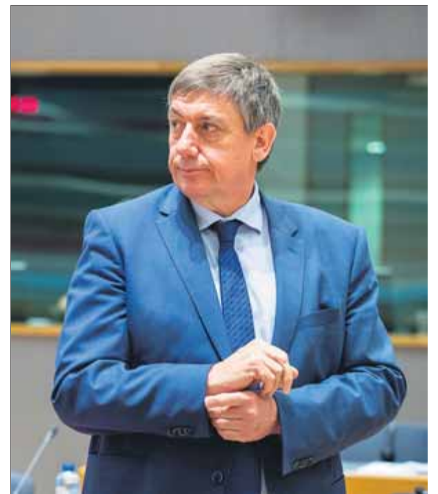
El ministre president de Flandes, Jan Jambon, que ha reclamat de veure's amb l'ambaixadora espanyola.

fián, també van rebre de valent. L'alcaldeessa va celebrar, després de censurar que “els canvis d'ERC” els tenen “desconcertats”, que Rufián ara s'inclinï “cap al diàleg”, mentre que Asens va preguntar-se quin Rufián es trobaran la propera legislatura, si el que vol desbloquejar i dona un xec en blanc i “vota en contra dels presupostos més socials de la història”; el que “empeny Puigdemont al precipici de la DUI” després de titllar-lo de “traïdor”; el que va “amb aires antirepressius” o “el que s'amaga darrere de Buch”. Per això va acusar-lo directament de ser “també el de la Brimo” mentre no demani la dimissió del conseller d'Interior. ■