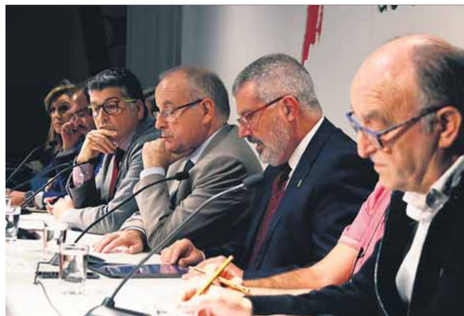
Les entitats de juristes van presentar el manifest al Col·legi de Periodistes