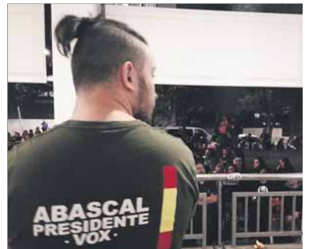
Un membre del servei d'ordre de Vox mira el grup d'antifeixistes concentrat al carrer

De l'acte polític en si no més destacar que quan la sala ja era plena i instants abans que entressin els líders polítics es va sentir l'himne de la legió, El novio de la muerte , que va ser rebut i corejat pels presents. Fora, els concentrats, no paraven de cridar "fora feixistes dels nostres barris". ■