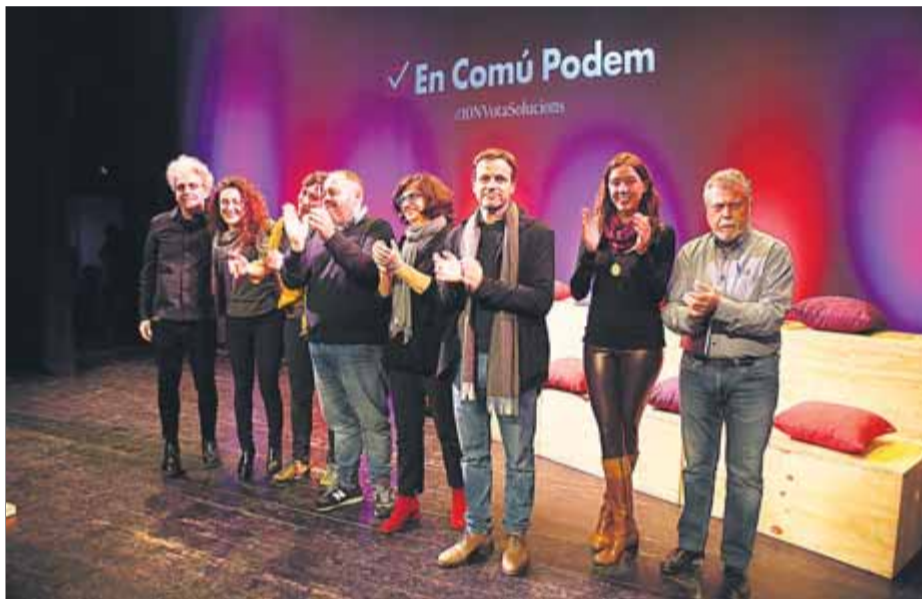
L'acte de cloenda de campanya nacional dels comuns es va fer ahir al vespre al Teatre Municipal de Blanes

Jaume Asens, va reivindicar la feina que es fa a l'Ajuntament de Barcelona "plantant cara als lobbys financers". Asens va reivindicar-se com el vot útil per tenir un govern a Espanya "que no sigui un mur" al diàleg. "Qui no vulgui un govern de Casado i Sánchez, qui vulgui un