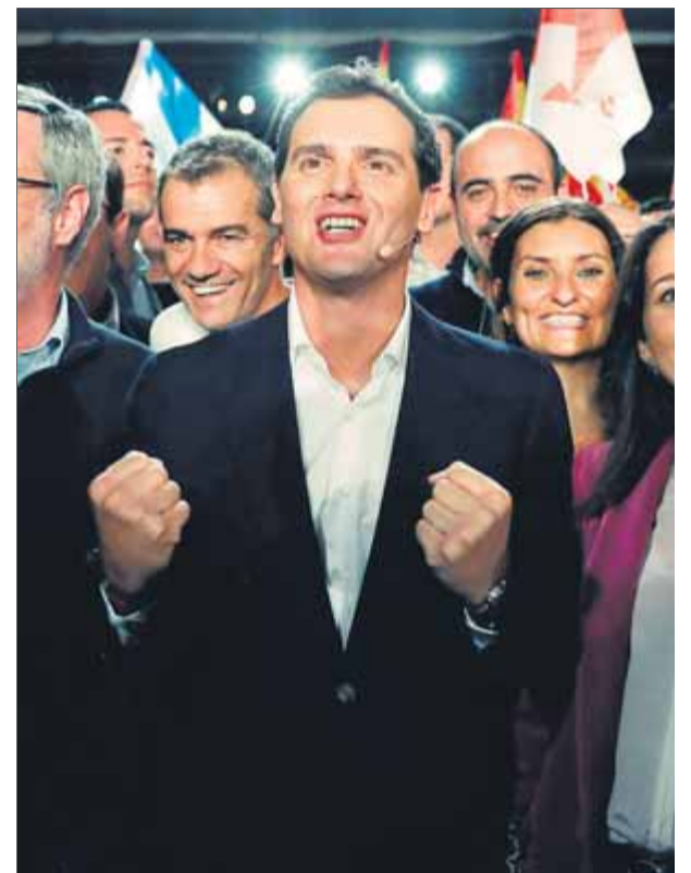
Albert Rivera manifestant eufòria en el tancament de campanya de Ciutadans a Barcelona