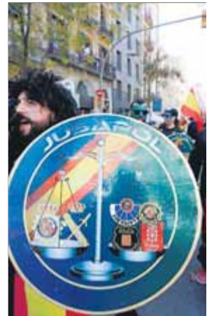
Affiliats a Jusapol es manifesten

Els agents antidisturbis desplaçats excepcionalment a Catalunya per vetllar per la seguretat de la votació es van trobar que l'ordre de trasllat arribava quan havia expirat ja el termini del vot per correu, així que el desplegament als carrers catalans els robava el dret a vot. Vox, que té en les forces de l'ordre i en sindicats com ara Jusapol un calador de simpaties, ha batallat pel seu dret a vot i el seu recurs ha forçat el Tribunal Suprem a exigir a la JEC que vetlli perquè votin el 10-N tot i el