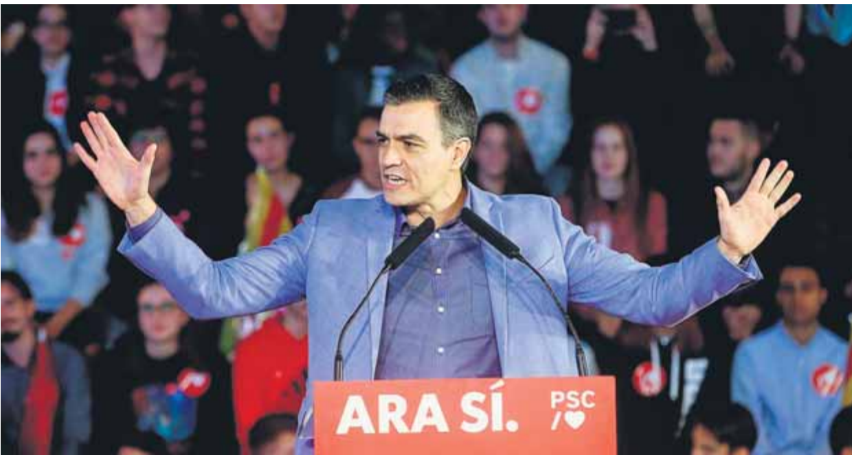
Pedro Sánchez, ahir, en el tancament de campanya espanyola a la Fira de Montjuïc de Barcelona