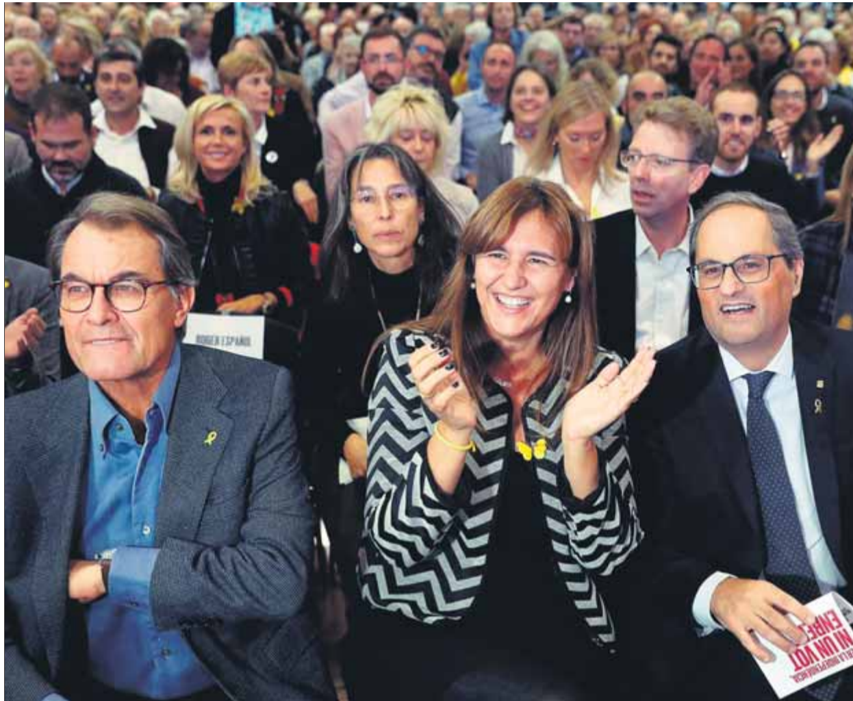
La candidata de JxCat, Laura Borràs, flanquejada ahir pel president Quim Torra i l'expresident Artur Mas

Davant d'unes 1.200 persones que omplien de gom a gom les Cotxeres de Sants de Barcelona, i que van llançar crits constants de “Llibertat!” i “Independència!”, JxCat va posar tota la carn a la graella amb la intervenció també dels presidents Quim Torra i Artur Mas, així com de la majoria dels principals candidats per les quatre demarcacions tant al Congrés com al Senat, amb dos missatges que van ser transversals a tots els discursos: les crítiques a les formes cada cop més autoritàries del govern espanyol i la necessària unitat de l'independentisme per fer-hi front, que JxCat vol seguir reclamant i abande-