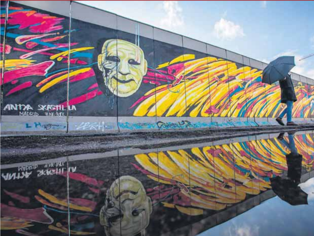
Un tram del mur de Berlín que ha estat reconvertit en galeria d'art