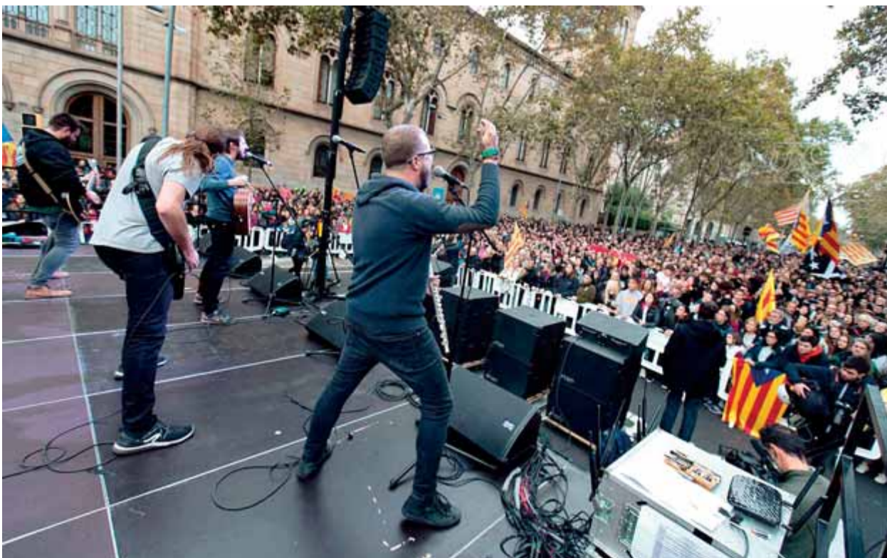
Un dels grups que ahir van actuar a l'escenari de Tsunami Democràtic davant la Universitat de Barcelona

VOTACIÓ • Més de 5,6 milions de catalans, convocats a votar avui en les eleccions espanyoles