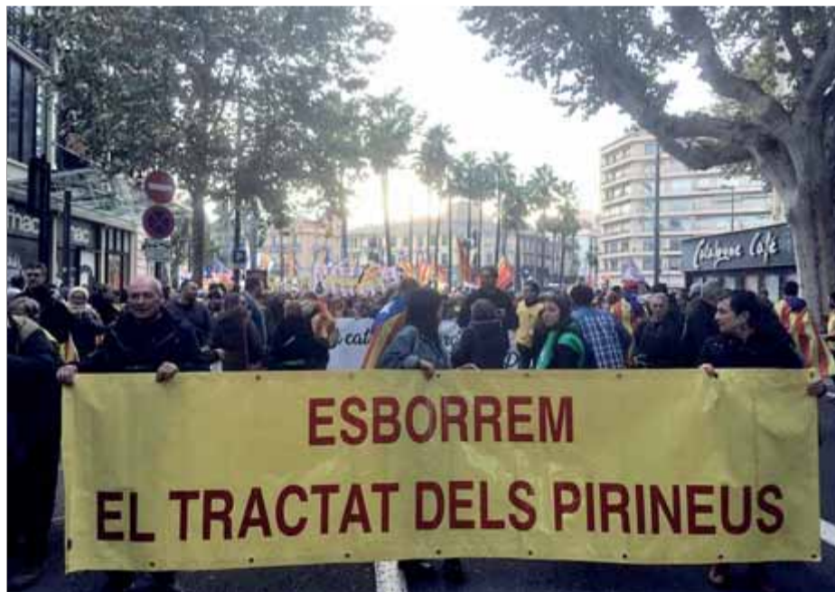
Més de 3.000 persones van assistir a la Diada de la Catalunya Nord