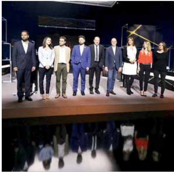
Foto dels candidats al Congrés, sense la presència de Meritxell Batet, del debat a TV3

La seva companya de partit i candidata al Congrés, Meritxell Batet, va continuar descansant, tot i que ja està recuperada de la baixa per vertigen, que li permetrà votar avui a Vallcarca. El repòs també va ser la recepta escollida per Laura Borràs (JxCat) per recuperar-se de la febre i del refredat. La candidata de la CUP, Mireia Vehí, també va aprofitar el matí per descansar i a la tarda volia sumar-se als actes convocats pel Tsunami