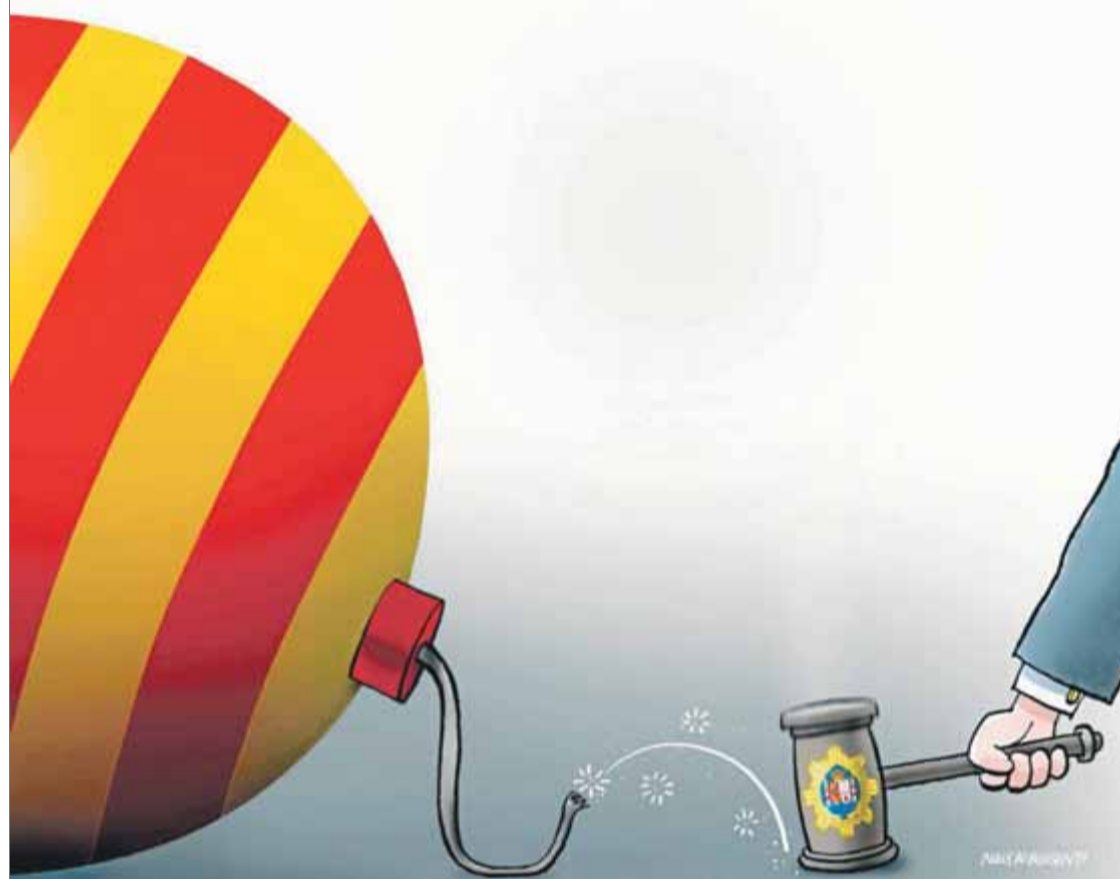
Il·lustració de Niels Bo Bojesen per al diari danès 'Jyllands-Posten' ■ NIELS BO BOJESEN

El que molta gent sembla que oblidava és que la crisi catalana va néixer a Madrid. No estem davant d'un problema català. El que demanen els catalans no és diferent del que exigia Escòcia fa uns anys i, en el seu cas, el Regne Unit va acceptar celebrar un referèndum. Per tant,