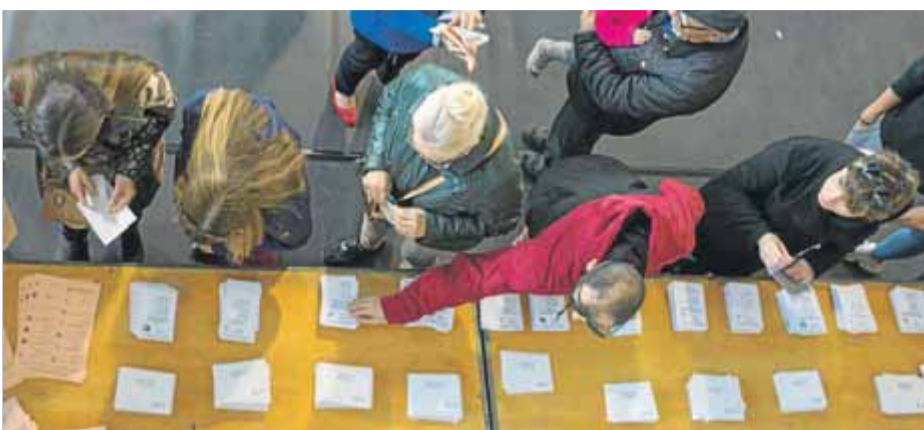
Gent agafant les paperetes de les candidatures per votar a l'abril a Girona