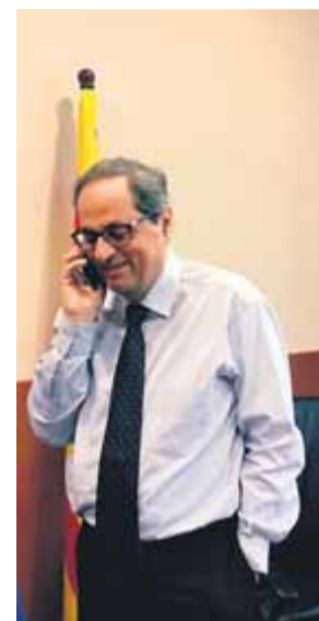
Torra parlant per telèfon, en una imatge d'arxiu

La Generalitat vol poder parlar de tot amb Sánchez, sense restriccions de cap tipus, inclòs de l'e-