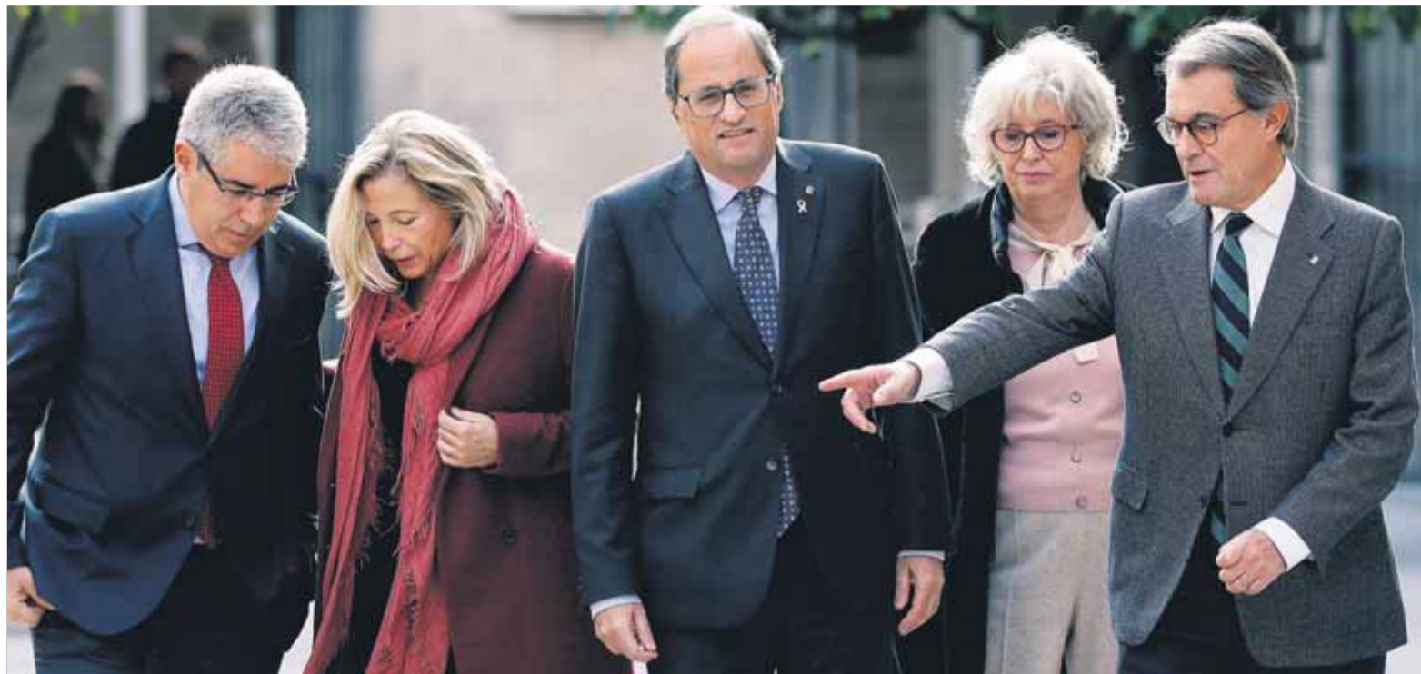
Homs, Ortega, Torra, Rigau i Mas, durant l'acte que es va fer ahir al Palau de la Generalitat per recordar els cinc anys de la consulta del 9-N

■ Els dos presidents aprofiten una commemoració del 9-N per reivindicar la fortalesa electoral de l'independentisme ■ L'acte esdevé un gest de desgreu cap als condemnats per la consulta del 2014