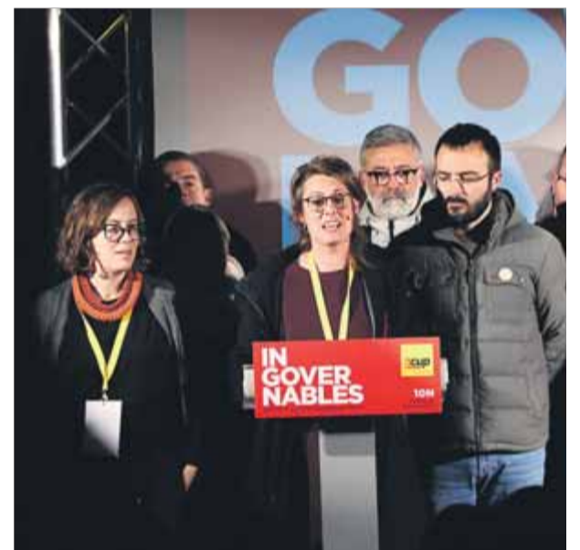
Vehí acompanyada de Reguant i Botran durant la nit electoral a la seu de la CUP

■ Veu “un recorregut mínim” a l'independentisme pels resultats ■ Apunta que no es reuniran amb el rei