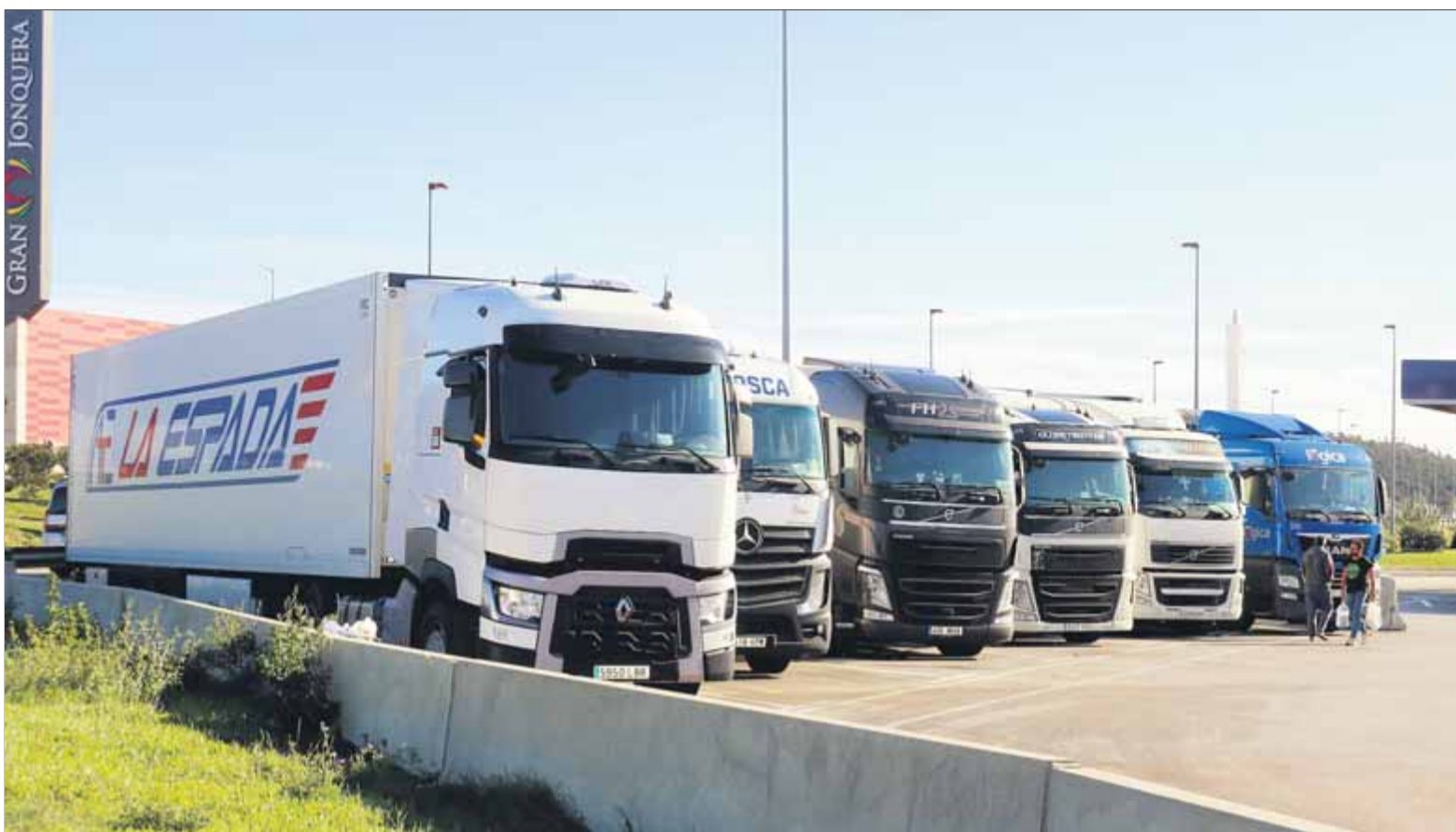
Camions estacionats en un aparcament a prop de la carretera tallada ahir pel Tsunami Democràtic ■ ACN