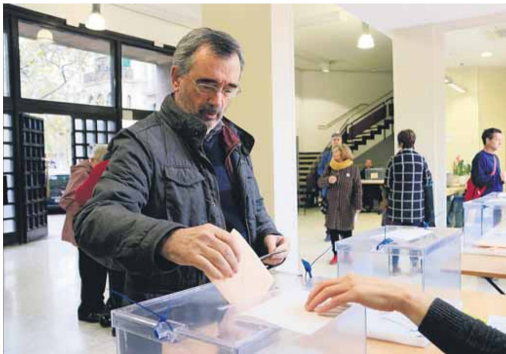
El president del Senat en funcions, Manuel Cruz, votant diumenge a Barcelona

L'escenari sorgit de les urnes del 10 de novembre és una anomalia a la cambra de la plaça de la Marina espanyola: el partit que guanya les eleccions estatals al Congrés acos-