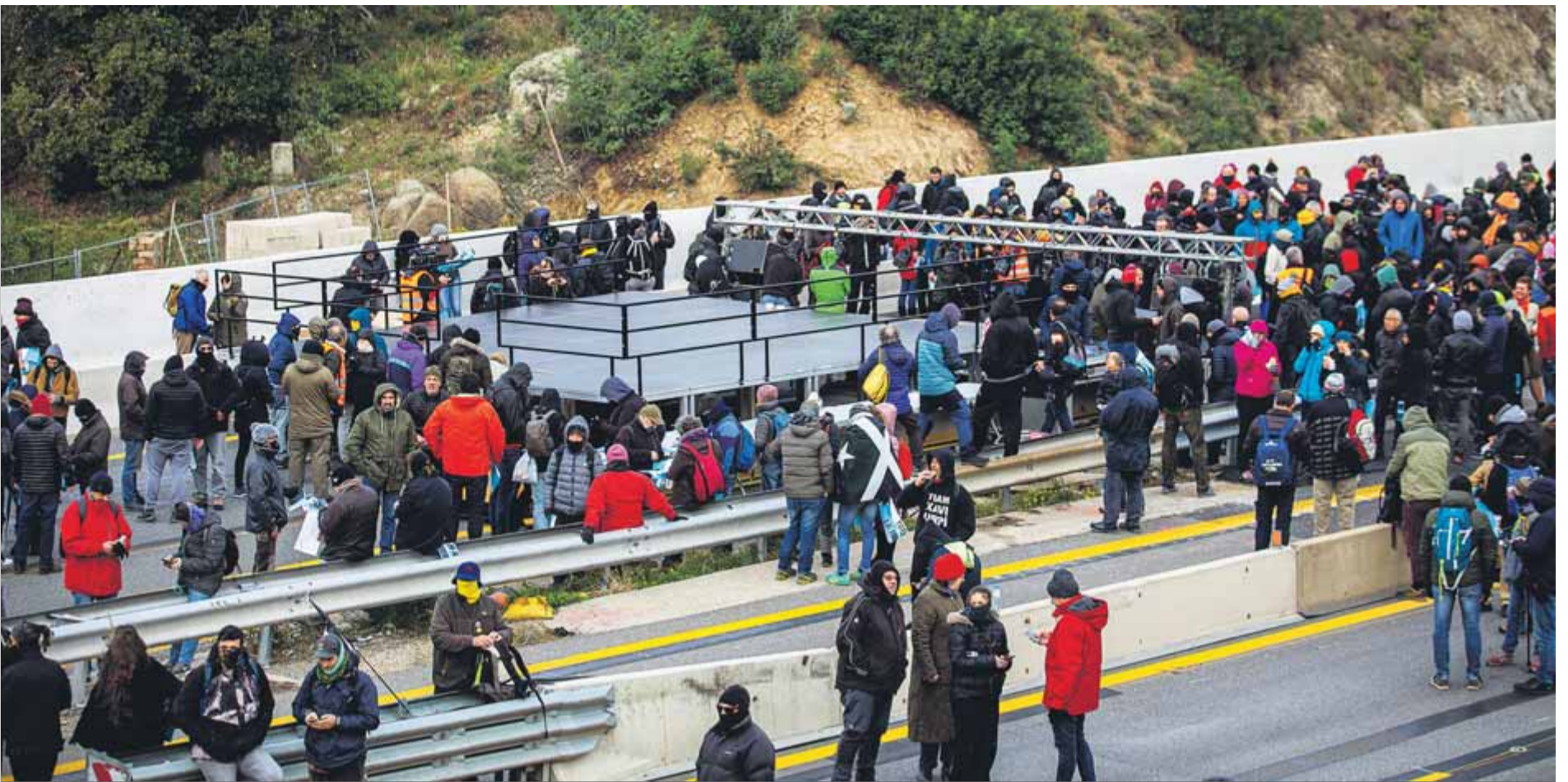
La instal·lació de l'escenari al mig de l'autopista, on es preveu fer els concerts durant els tres dies de bloqueig