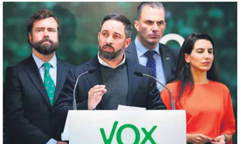
Santiago Abascal amb la plana major de Vox, ahir a Madrid

alguns minuts de silenci oficials amb motiu de crims masclistes davant l'ajuntament de Madrid, Vox ha vingut a la política a desafiar els consensos més elementals i per això fins i tot carrega part de la culpa a la dona parlant d'"ideologia de gènere". El que Abascal somnia ara és que el seu enfocament franquista de la unitat d'Espanya i dels drets socials es pugui traslladar a l'agenda del dia a dia del TC i que s'hagi de pronunciar sobre punts abans no abordats.