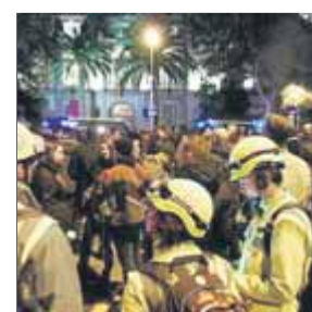
La manifestació d'ahir a la tarda a Barcelona

tració va fer-se davant de la Delegació del Govern espanyol, on van cridar les habituals consignes contra "les forces d'ocupació". Aquest cop també es van sentir cànctics dedicats a Albert Rivera.