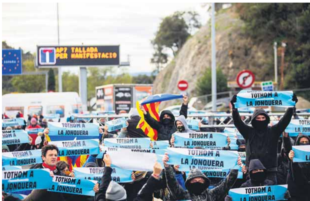
Els primers activistes que van tallar ahir al matí l'autopista ja en territori nord-català, a l'Estat francès ■ QUIM PUIG

TSUNAMI • Centenars d'activistes ocupen l'autopista internacional i aturen el trànsit amb gran afectació al transport