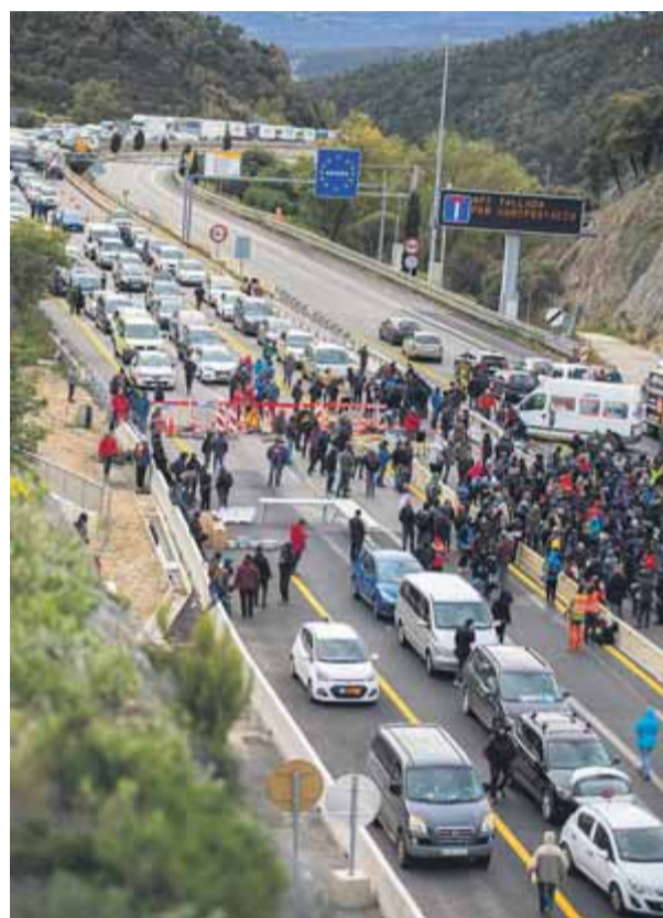
Els moments inicials del tall al Pertús dilluns al matí, que va donar pas a 30 hores d'aturades

País Basc, dimarts, i els que van participar en actes de rèplica ahir, dimecres, mateix. La protesta del Tsunami es va donar per acabada a primera hora del matí a Salt, abans de les càrregues dels Mossos d'Esquadra, per evitar qualsevol enfrontament. La nota dels organitzadors indicava ja la necessitat d'obrir una via nova d'actuacions amb "fronts d'acció comuns i combinats que caldrà explorar en els pròxims mesos", amb referència al col·lapse assolit a l'autopista de Bilbao a Behobia que conec-