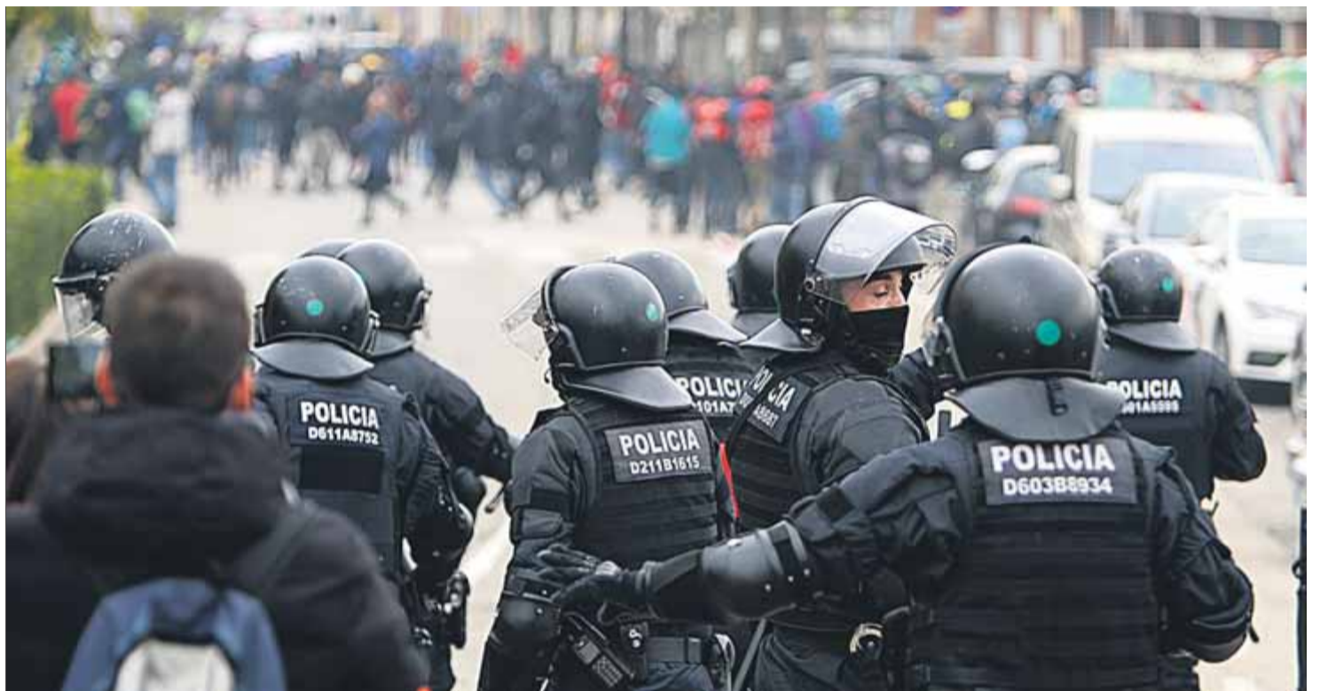
Efectius policials van perseguir ahir pels carrers de Salt els manifestants, fins que els van dispersar ■ MANEL LLADÓ

A peu d'asfalt, la gent es va col·locar llavors en rotllana per fer una assemblea, en la qual es van plantejar diverses opcions, com ara abandonar l'AP-7 i anar a tallar l'N-II, a Riudellots de la Selva. La proposta més votada a mà alçada va ser per-