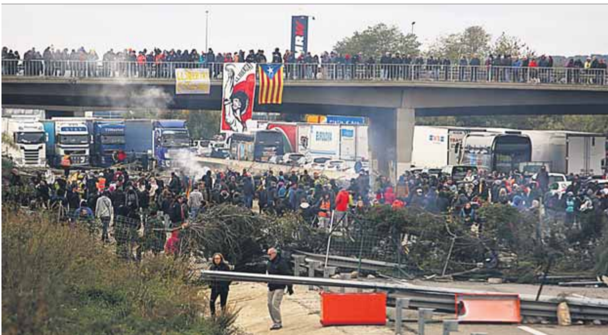
Els manifestants, ahir al tall de l'autopista AP-7 a l'altura de Salt