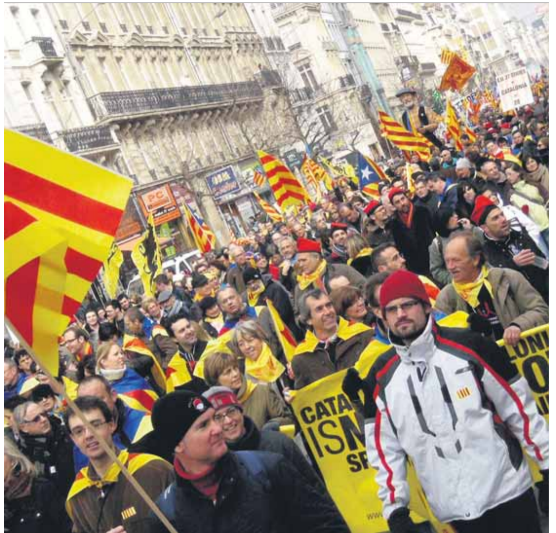
Participants en la manifestació que es va fer a Brussel·les per reivindicar l'estat català, ja feu deu anys

Que ningú s'enganyi, l'ascens de Vox a nivell espanyol té un responsable destacat: el president del govern espanyol. A Catalunya, l'extrema dreta va obtenir un 4% dels escons en joc, mentre que a l'Estat espanyol aquesta xifra s'enfila fins al 16%. Hi ha algú, per tant, que no ha fet la feina a l'hora de combatre aquelles formacions que basen el seu discurs en la negació de drets.