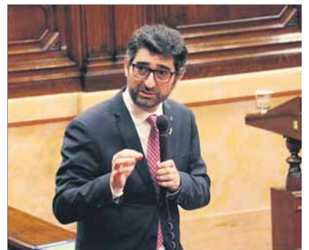
El conseller de Polítiques Digitals, Jordi Puigneró, durant la intervenció que va fer ahir al Parlament

matiu permetrà a l'Estat intervenir el conjunt de la xarxa d'internet de manera transitòria, en cas de desordres públics, i limita l'ús de noves tecnologies, com ara la blockchain . En una altra interpel·lació, en aquest cas del grup de Ciutadans, Puigneró va qualificar de notícia falsa la suposada implicació del Centre de Seguretat de la Informació de Catalunya (Cesicat) de la Generalitat i els plans dels membres dels CDR detinguts el 23 de setembre per assaltar, suposadament, el Parla-