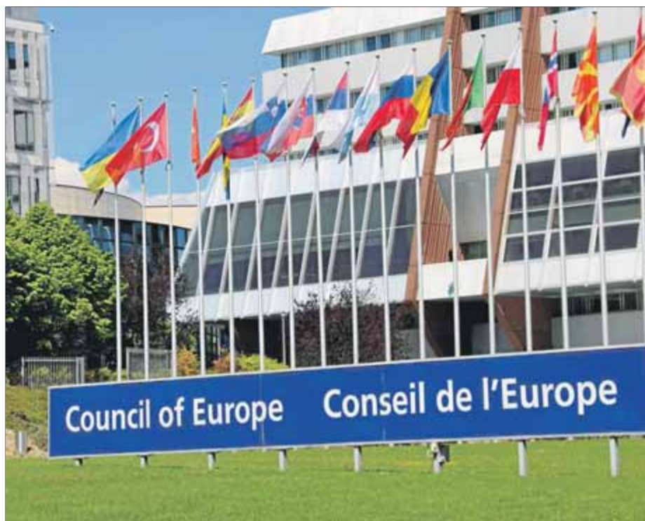
La seu del Consell d'Europa a Estrasburg, amb les banderes dels estats membres

Si bé celebra que el govern de Pedro Sánchez hagi fet accessibles els seus contactes amb el ministeri fiscal a internet, el Greco li va reclamar ahir que formalitzi aquest pas per millorar la transparència en les comunicacions. D'altra banda, també vol que el ministeri fiscal actuï “de manera decisiva” per avançar en la seva “autonomia, integritat i la rendició de comptes”. Així, critica que el Ministeri de Justícia decideixi sobre l'assignació de personal de les diferents fiscalies i no creu que s'hagi avançat per proporcionar “més autonomia” en la gestió dels recursos del ministeri fiscal. Pel que respecta a la