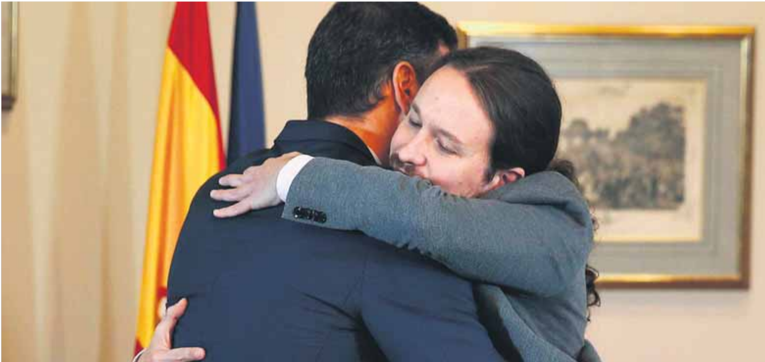
Sánchez i Iglesias rubricant amb una abraçada el seu preacord de govern de coalició, firmat dilluns al Congrés

■ La socialista Lastra cita Rufián avui per accelerar el desglaç ■ El president en funcions necessita el sí republicà si vol ser elegit a la primera o l'abstenció conjunta amb EH Bildu en segona votació