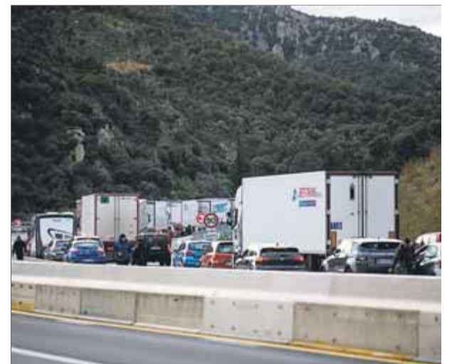
Retenció de trànsit, aquest dilluns al Pertús, arran de la protesta del Tsunami Democràtic

vehicles de gran tonatge des de l'any 2013 (va ser una reivindicació històrica aconseguida pel poble de Bàscara amb l'objectiu que s'hi reduís la sinistralitat viària). A banda, les carreteres que han resultat més congestionades aquests dies a la demarcació de Girona han estat l'AP-7, l'A-2, l'N-II i la C-66. ■