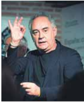
Ferran Adrià

Ferran Adrià avança que l'obertura serà de portes endins