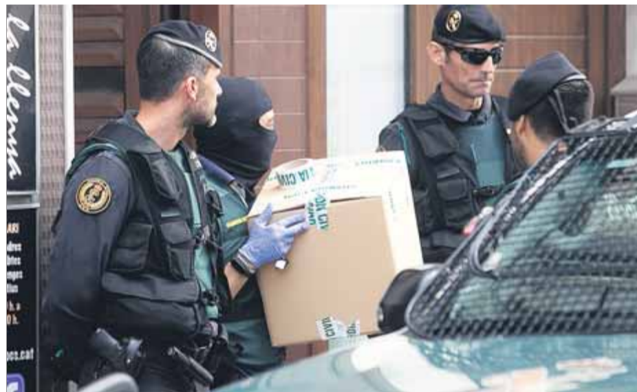
Agents de la Guàrdia Civil, en els escorcolls en un dels pisos de Sabadell