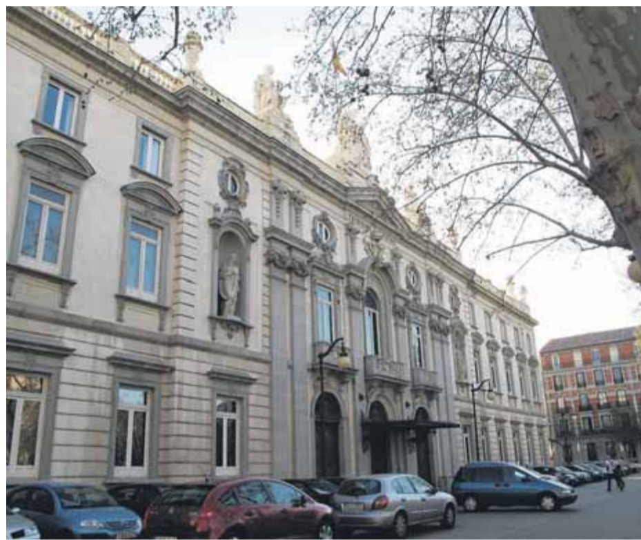
Exterior de l'edifici del Suprem a la plaça Villa de París de Madrid