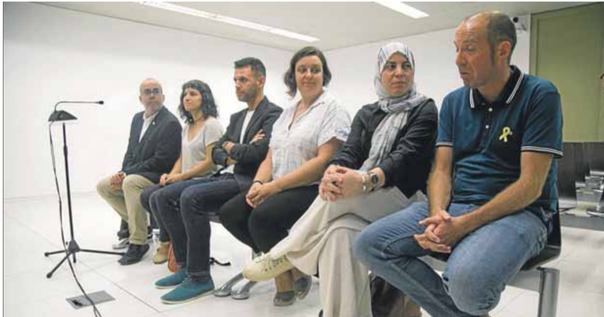
Els sis regidors en el govern badaloní el 2016, durant el judici celebrat al setembre ■ ORIOL DURAN

Segons el magistrat José Manuel del Amo, ponent del tribunal, cap d'ells va desobeir la resolu-