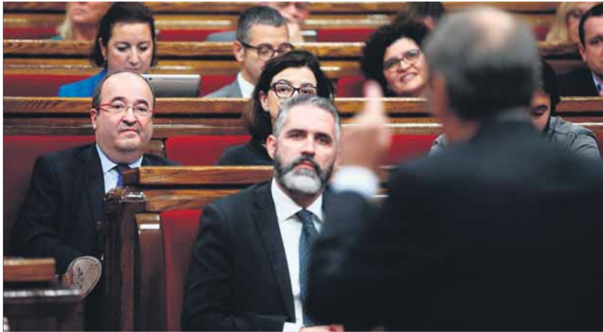
Quim Torra, d'esquena, durant l'estira-i-arrotonsa que va tenir ahir amb Miquel Iceta al voltant dels actes del Tsunami