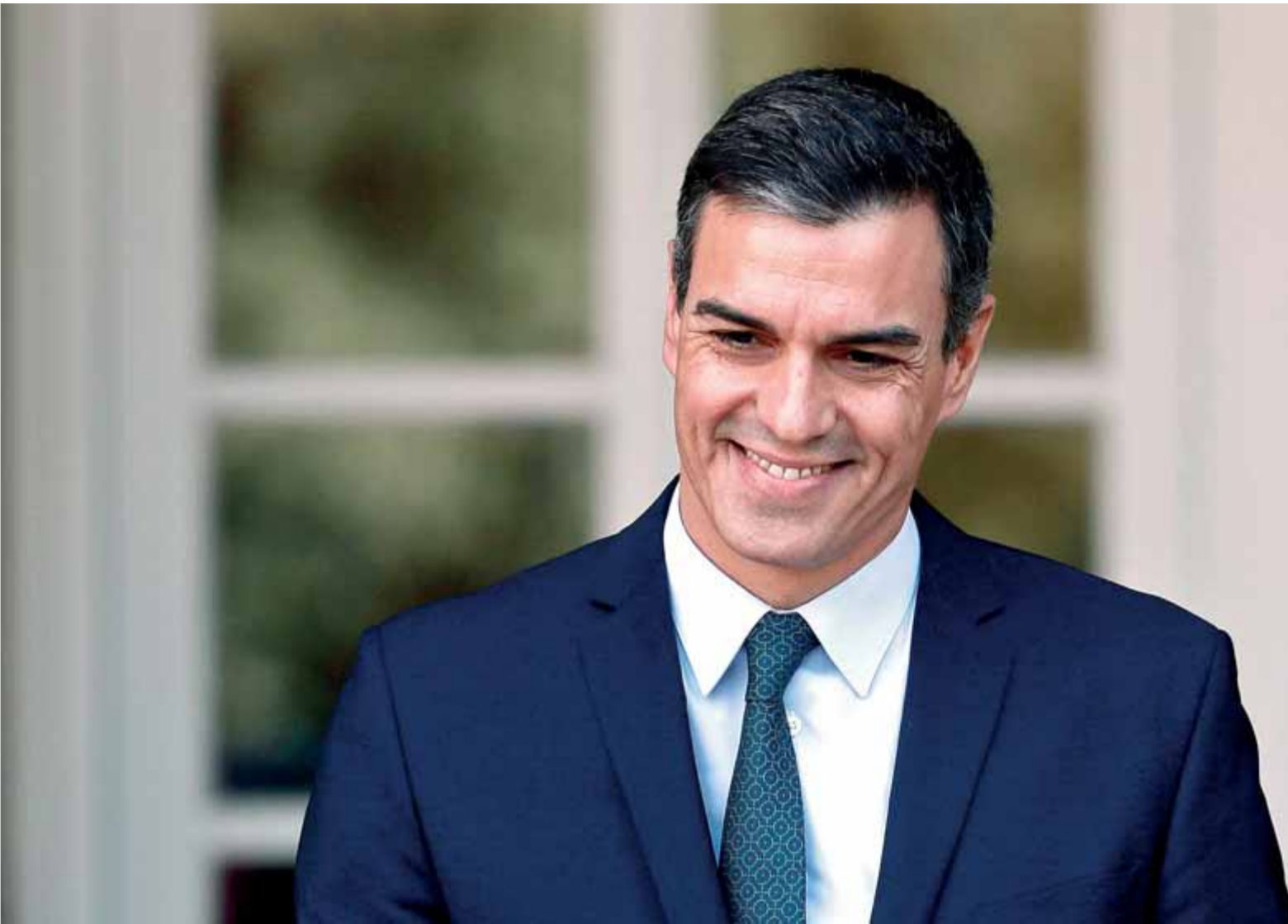
El president del govern espanyol en funcions, Pedro Sánchez, a La Moncloa, dijous passat