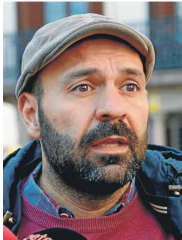
Mauri, vicepresident d'Òmnium, ahir, a la plaça Orfila de Sant Andreu, durant la campanya d'autoinculpacions

todeterminació. L'Estat, va dir, ha d'entendre el “gran consens” que hi ha entre la societat civil i els intel·lectuals en aquest sentit. Per tot plegat, va