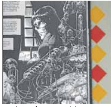
Frankenstein segons Wrightson

Les pors de sempre continuen produint imatges a través del còmic i el llibre il·lustrat, perpetuant els clàssics de Poe, Lovecraft o Shelley