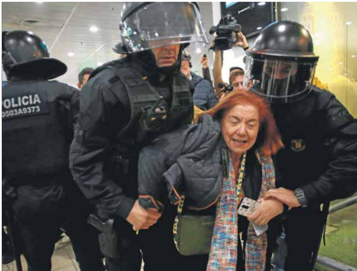
Mossos desallotjant el vestíbul de l'estació de Sants durant la concentració convocada pels CDR ahir

A fora, un cordó dels Mossos barrava l'entrada