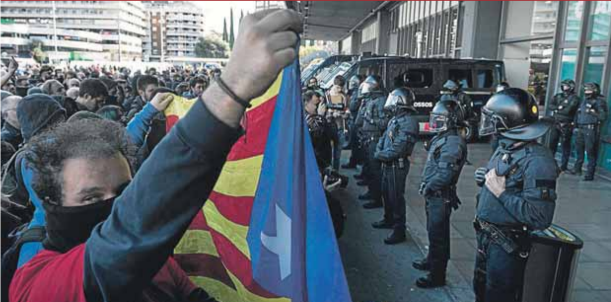
Manifestants convocats pels CDR, davant d'un cordó policial, ahir, a l'entrada de l'estació de Sants