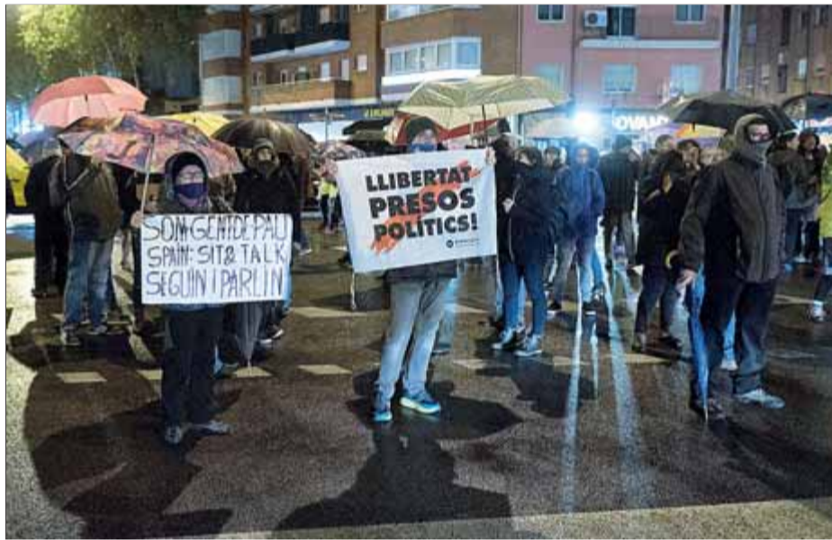
Els manifestants, tallant ahir al vespre per uns minuts la Meridiana