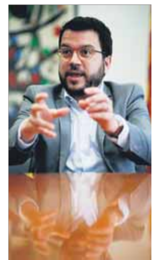
Aragonès, vicepresident del govern

un text que va rebre el suport de JxCat i ERC. La resolució també instava el govern a "posar en marxa la fiscalitat verda per lluitar contra el canvi climàtic, amb l'impost sobre vehicles contaminants, a les activitats econòmiques que generen més gasos d'efecte hivernacle, i sobre les emissions portuàries de grans vaixells i creuers". Tot i que les posicions es van acostant, el calendari es manté, i les eleccions han fet ajornar una possible aprovació dels comptes fins al gener de l'any vinent. ■