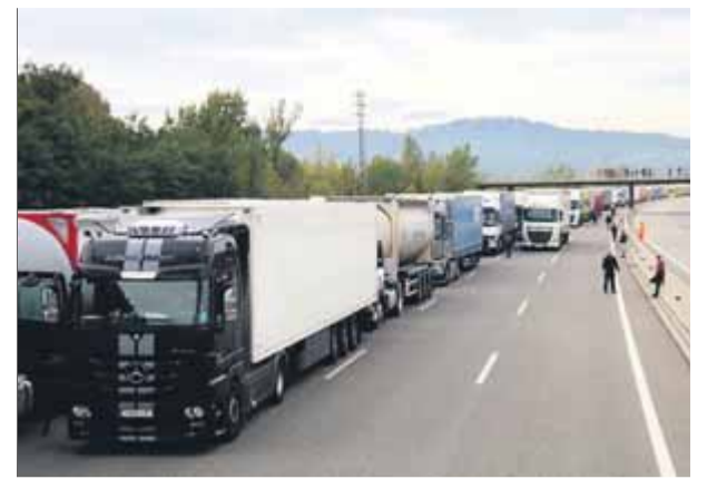
Cues de camions a l'AP-7 a Medinyà arran del tall de la vaga general del 18 d'octubre

pedir per primera vegada que el tall a la Meridiana durés el temps previst pels organitzadors. La Brimo va actuar amb la col·laboració de la Guàrdia Urbana i l'avinguda va estar bloquejada pels manifestants només un quart d'hora. Posteriorment, cap a les deu de la nit, es va produir un altre intent fallit de tall a Fabra i Puig. Es va viure algun moment de tensió i els Mossos van fer un parell d'identificacions. ■ REDACCIÓ