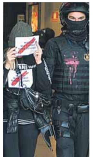
Blocatge a Sants convocat pels CDR ■ J. L.

Encara que ho haguessin acceptat, s'hauria d'haver fet el debat i caldria després una majoria favorable a demanar la inclusió dels CDR a la llista de terroristes. Tota una sèrie d'hipòtesis poc probables que acabarien xocant amb el fet que només els estats membre de la UE són competents per proposar canvis en aquest llistat. Molt soroll per no res. ■