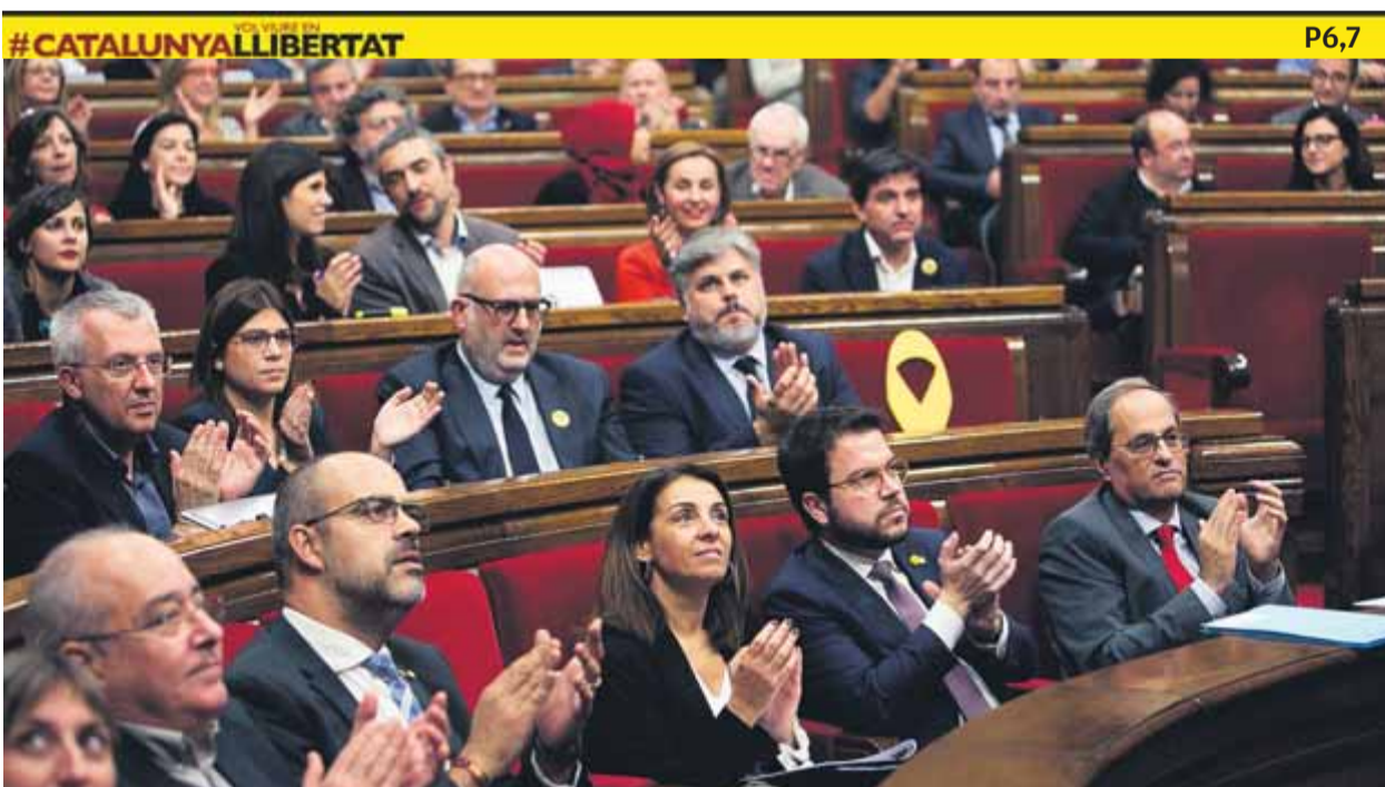
Part del govern i diputats de JxCat i d'ERC aplaudeixen en un moment del ple d'ahir

CANVI • Deroga el decret que limitava la implantació d'aquestes instal·lacions a Catalunya