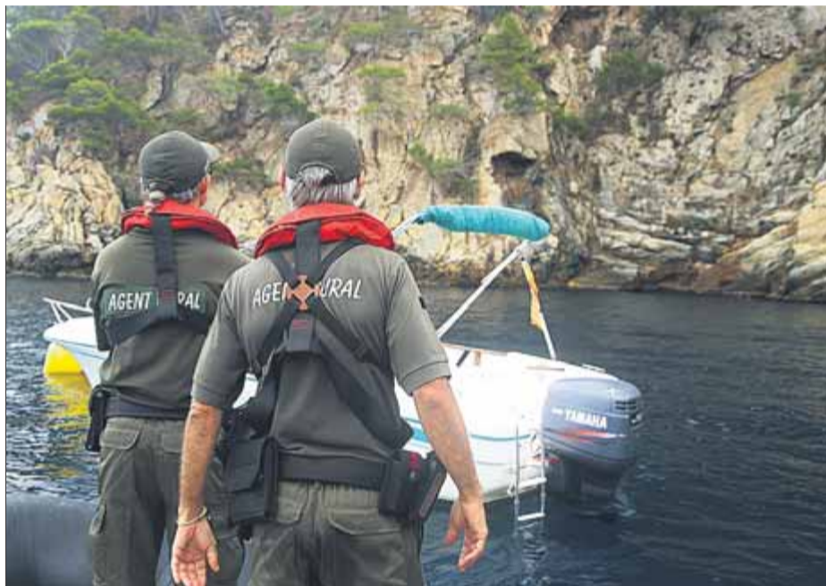
Dos agents rurals, l'últim estiu en una actuació a Roses

La nova normativa, que s'estructura en cinc capítols, regula la titularitat,