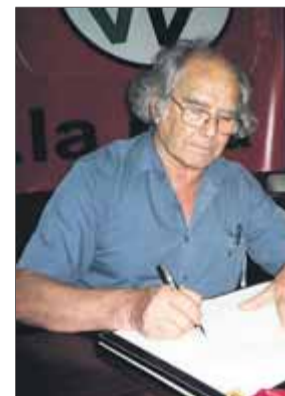
Adolfo Pérez Esquivel , premi Nobel de la pau, és un dels signants ■

amb Catalunya. Pel respecte als drets i llibertats , el manifest, impulsat pel Comitè Argentí de Solidaritat amb el Poble Cata-