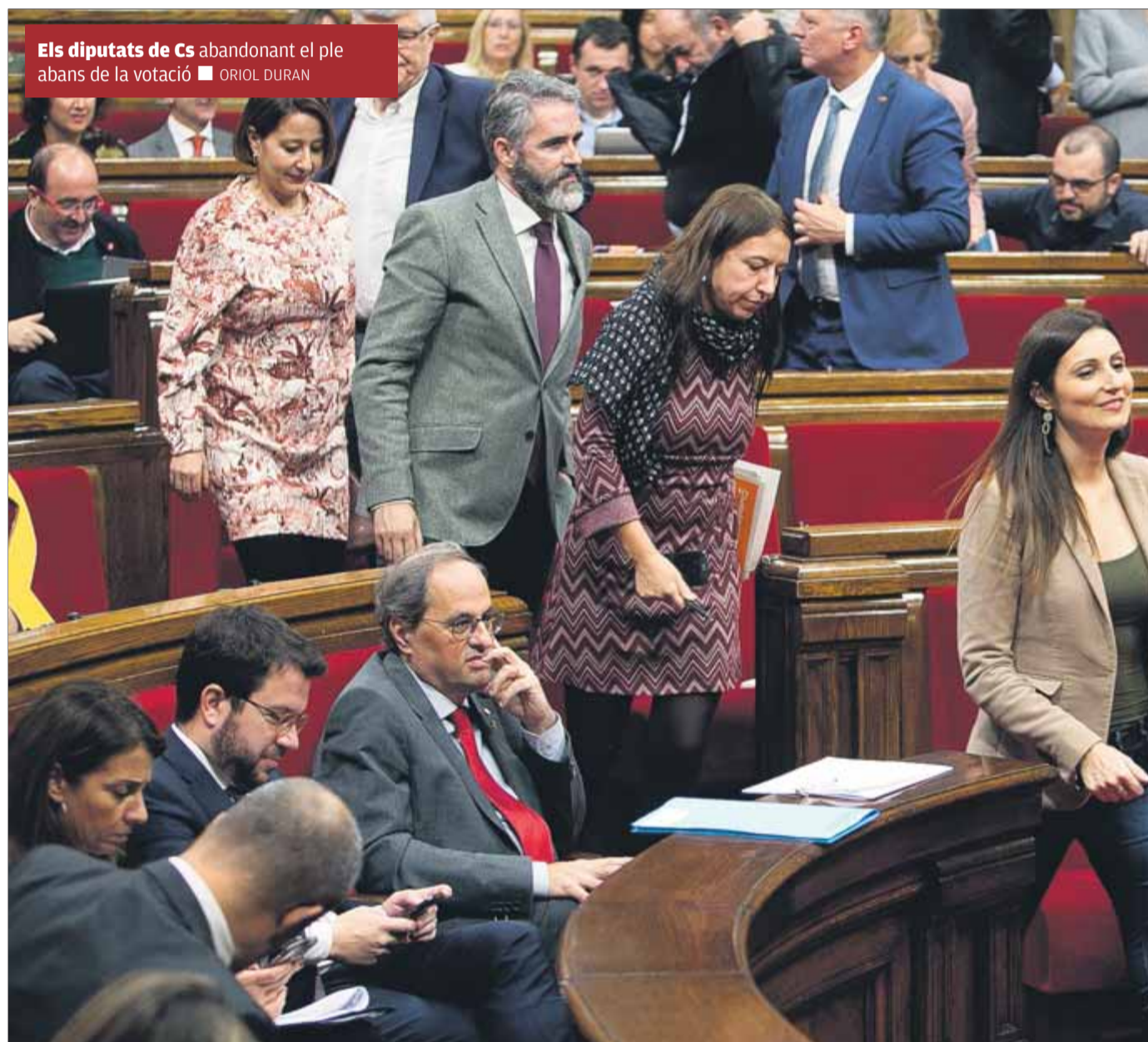
Els diputats de Cs abandonant el ple abans de la votació ■ ORIOL DURAN

I amb el focus de l'oposició, el TC i la fiscalia, els grups independentistes, amb l'abstenció dels comuns, van tirar endavant un text que va defensar en primer lloc el diputat de la CUP Vidal Aragonès. “L'independentisme va intentar solucionar el con-