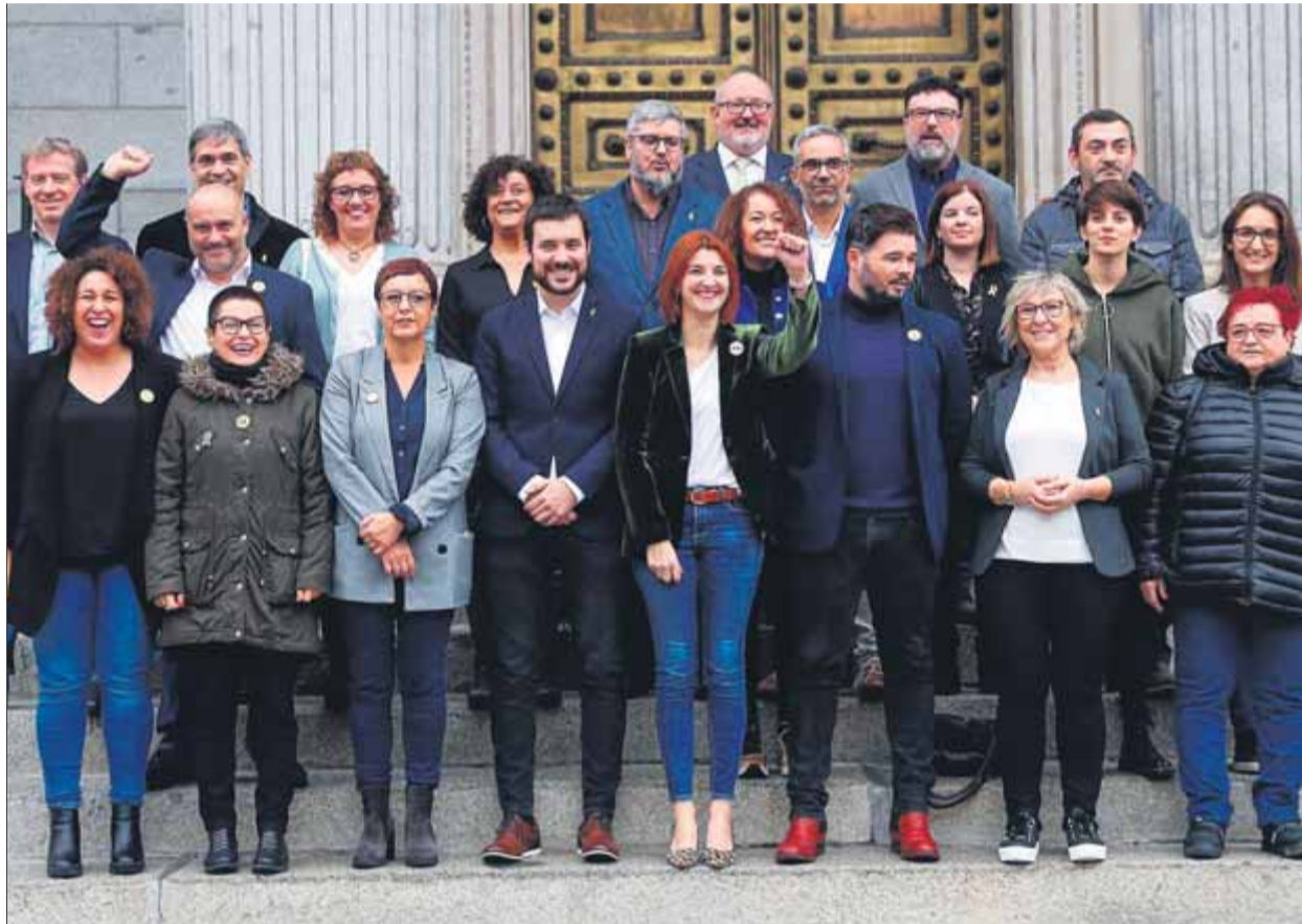
El grup de diputats al Congrés i senadors d'ERC es van fotografiar ahir junts a les escales del Congrés

Des de Londres, on assistia a un fòrum d'infraestructures entre Espanya i el Regne Unit, Ábalos avançava que l'objectiu no és el suport d'ERC a la investidura ni al govern, sinó demanar-li que "permeti desbloquejar" la governabilitat, segons informava Efe, en referència implícita a l'abstenció necessària dels republicans. Ábalos, que conduiria la negociació amb Lastra però també amb el secretari d'organització del PSC,