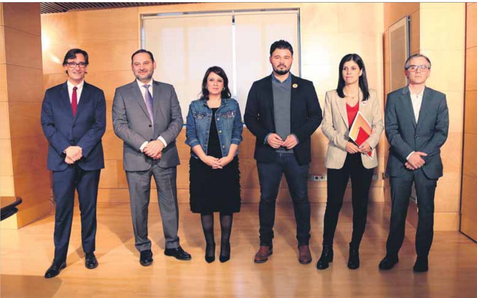
Els sis negociadors al Congrés: d'esquerra a dreta, Salvador Illa, José Luis Ábalos, Adriana Lastra, Gabriel Rufián, Marta Vilalta i Josep Maria Jové