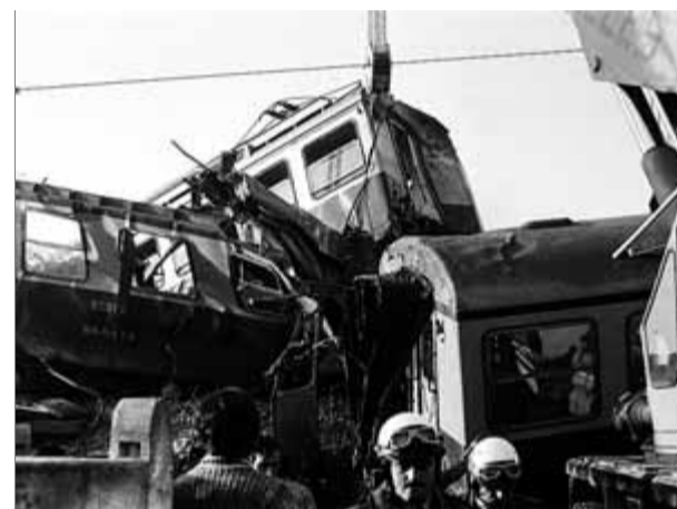
Una imatge de l'accident

Una tragèdia que La República, el setmanari que els lectors d'El Punt Avui troben cada diumenge amb el diari i que ja demà