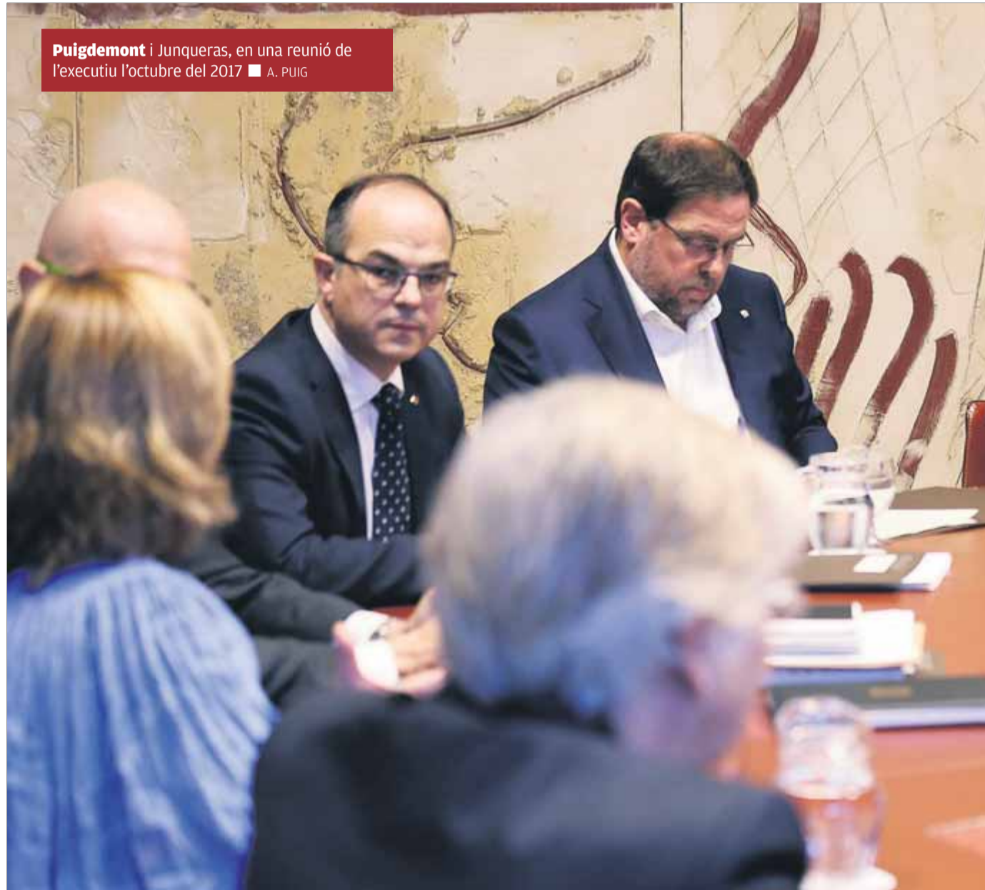
Puigdemont i Junqueras, en una reunió de l'executiu l'octubre del 2017