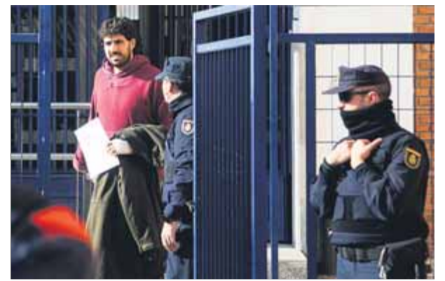
L'alcalde de Verges, el 16 de gener, surt de la comissaria de Girona després d'haver declarat pel tall al TAV de l'1-0 ■ Q.P.

“repressió” del moviment independentista i fer unes peticions de pena amb motivacions “polítiques”. El 27 de setembre es van tornar a concentrar desenes de persones en suport als primers encausats, deu d'elles van ser multades amb 600 euros. Ahir, en acabar una roda de premsa davant del TSJC, uns agents dels Mossos van voler identificar l'advocat i els activistes per no haver comunicat l'acte, segons informava l'ACN.