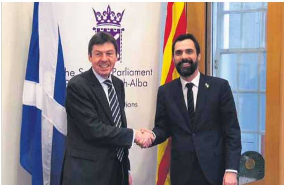
El president del Parlament escocès, Ken Macintosh, va rebre ahir el president Torrent al despatx presidencial de Queensberry House

En declaracions posteriors a la visita oficial al despatx presidencial de Queensberry House, Torrent va demanar a Sánchez "menys decrets digi-