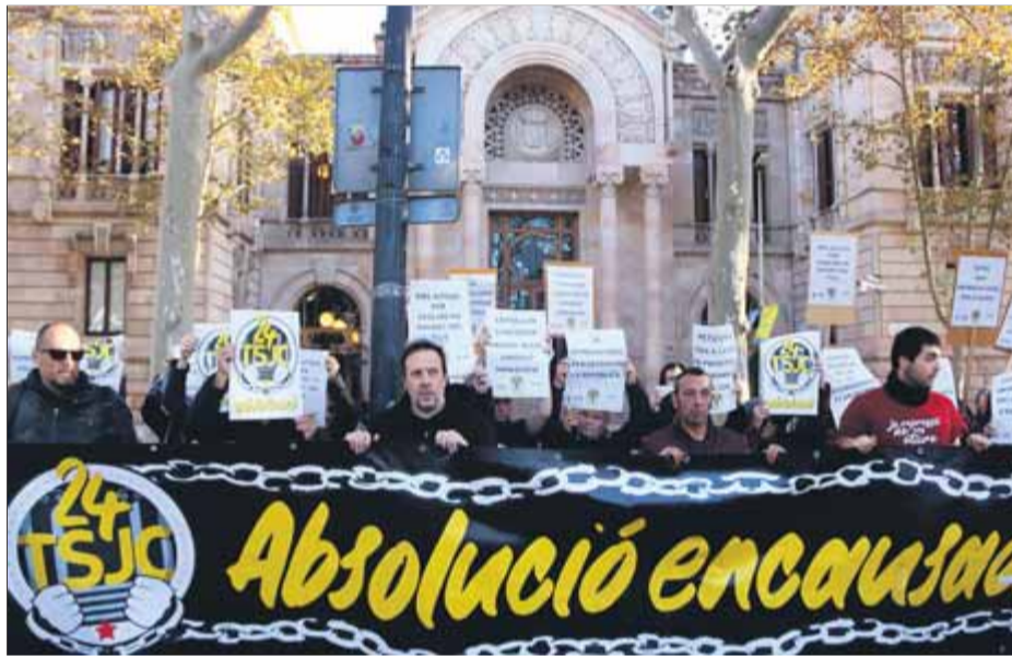
Grup de suport als encausats per haver-se encadenat al TSJC, ahir al matí

La líder dels comuns al Parlament, Jéssica Albiach, va replicar al president que “la gent vol diàleg