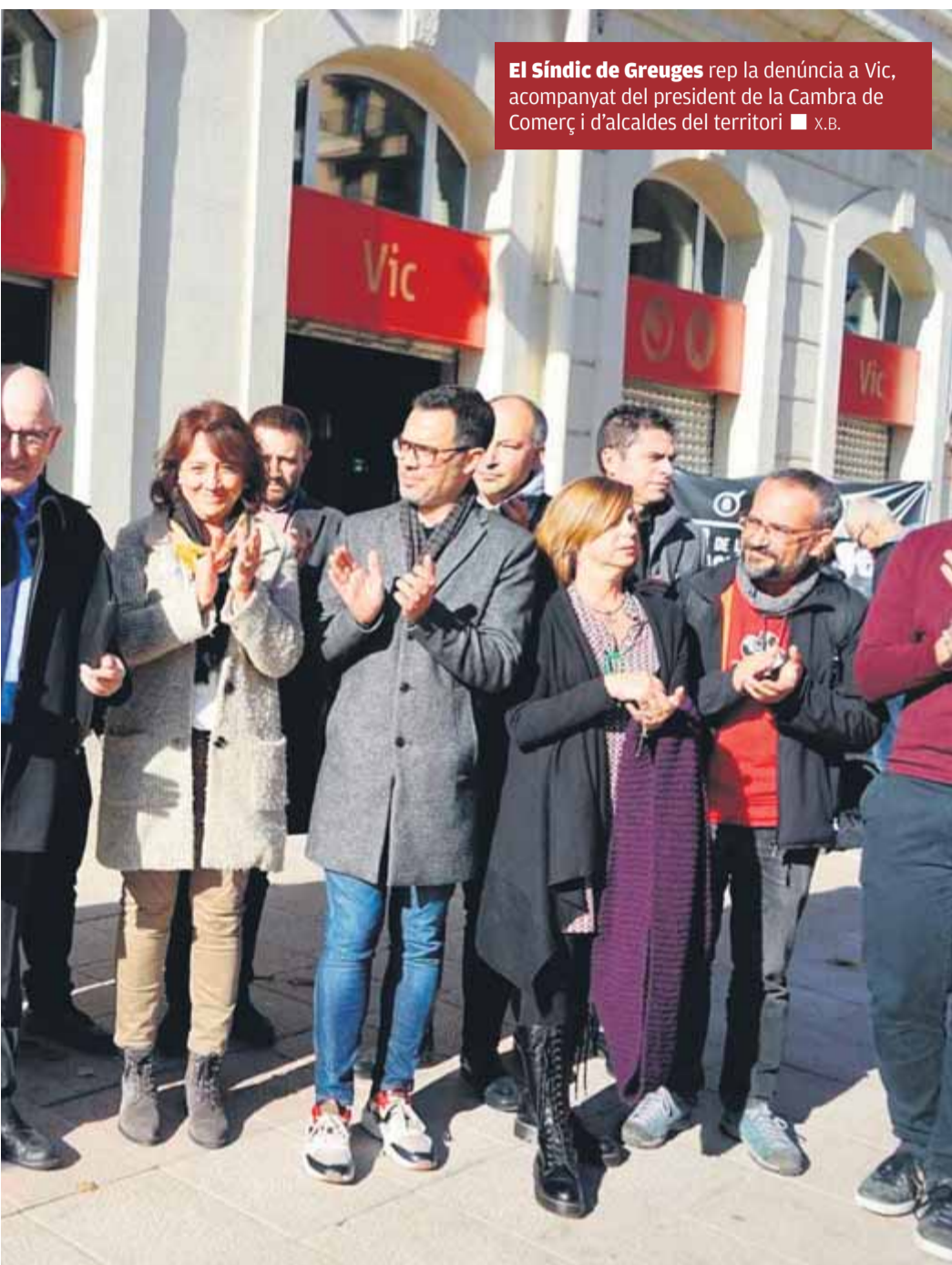
El Síndic de Greuges rep la denúncia a Vic, acompanyat del president de la Cambra de Comerç i d'alcaldes del territori ■ X.B.