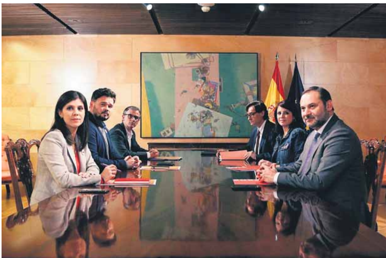
Els dos equips negociadors moments abans de començar la reunió, en una foto cedida pel PSOE ■

CITA • Puigdemont, Junqueras, els exconsellers i els vint càrrecs, citats a declarar el 28 de gener, "per liquidar la despesa de l'1-0"