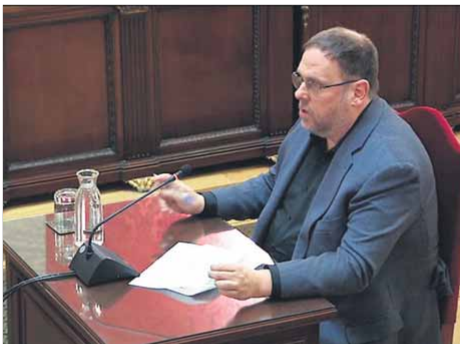
Oriol Junqueras el dia de la seva declaració davant del Tribunal Suprem