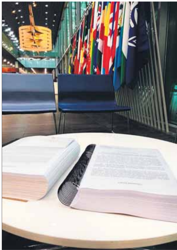
La denúncia va ser interposada dimecres ■ QUERELLANTS

La denúncia, en concret, està interposada contra una trentena d'alts càrrecs del govern i la magistratura espanyola, encap-