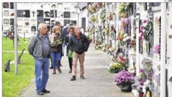
El cementiri de la capital de l'Alt Urgell el dia de Tots Sants.

bles municipals al cap de dos dies de penjar la llista i després de la indignació d'un grup de ciutadans a través de les xarxes socials. Compromís va considerar la mesura recaptatòria com a "irrespectuosa, insolidària i il·legal", tenint en compte la vigent Llei de Protecció de Dades, que impedeix que es facin públiques dades d'aquest tipus. Els socialistes van advertir que, en cas que algun afectat hagués denunciat els fets, podria haver comportat multes de fins a 300.000 euros.