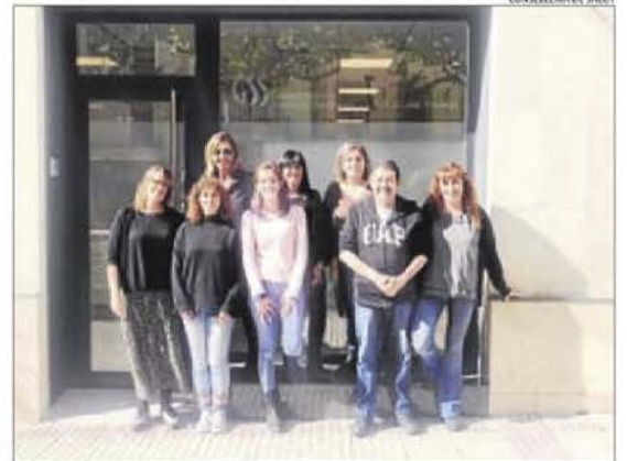
Imatge de l'equip d'atenció multidisciplinària.

L'hospital de dia té capacitat per a quatre persones i un servei de rehabilitació comunitària per a 10 usuaris. Així, compta amb dos despatxos de treball individuals, un altre per a l'atenció a les famílies, dos sales multidisciplinàries, dos més de teràpia polivalentes, una sala d'estar i una cuina-menjador. L'equip d'atenció és multidisciplinari i està format per dos psiquiatres, dos psicòlegs clínics, dos infermeres de salut mental, dos terapeutes ocupacionals, una educadora social i una treballadora social. A més, treballen de forma integrada i articulada amb la resta de professionals dels serveis de salut i socials, d'acord amb el projecte terapèutic del paci-