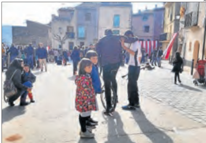
Un dels tallers per aprendre a muntar en monocicle.