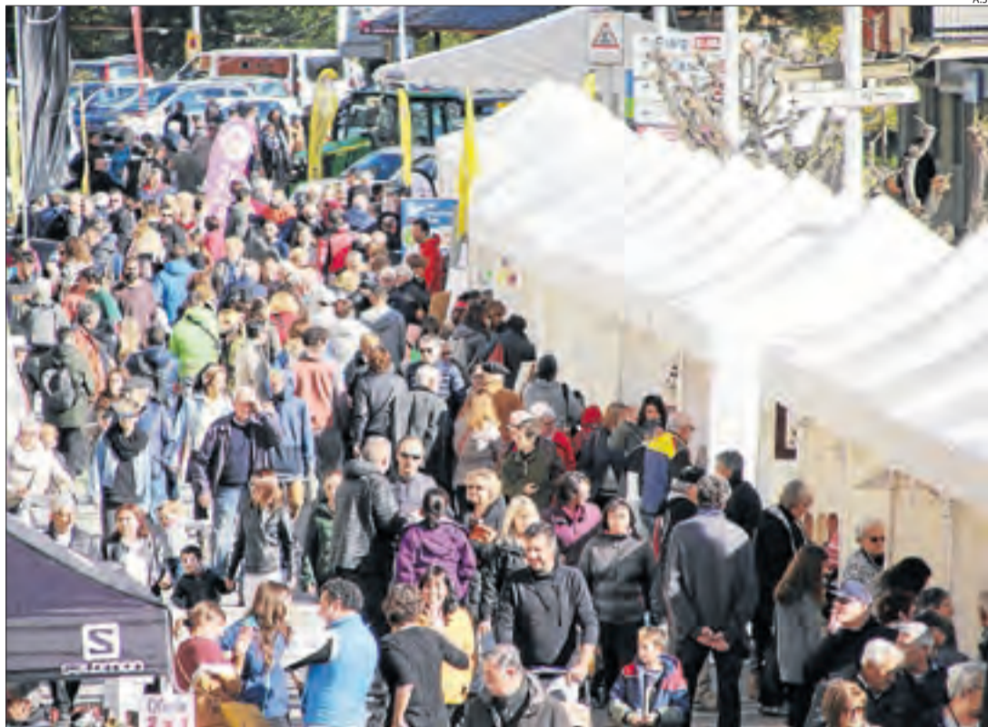
El bon temps va omplir de públic el recinte habilitat per celebrar la Fira de Tardor de Sort.