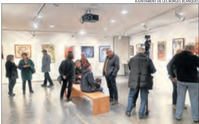
AJUNTAMENT DE LES BORGES BLANQUES

El Museu de la Noguera recorda Pàmies ■ El Museu de la Noguera de Balaguer ret homenatge a Teresa Pàmies amb una exposició que mostra com eren realment els paisatges de la ciutat descrits a l'obra de l'escriptora.