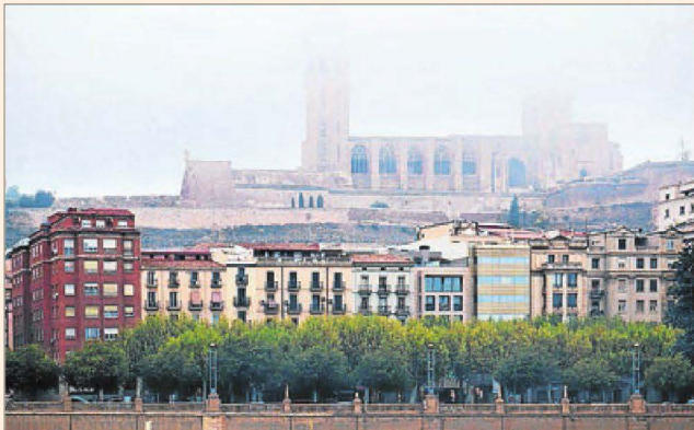
La Seu Vella entre la boira. "Un paisatge habitual a Lleida, en el qual el seu monument més emblemàtic desapareix entre la boira." Temps de tardor , del Francisco Acosta.