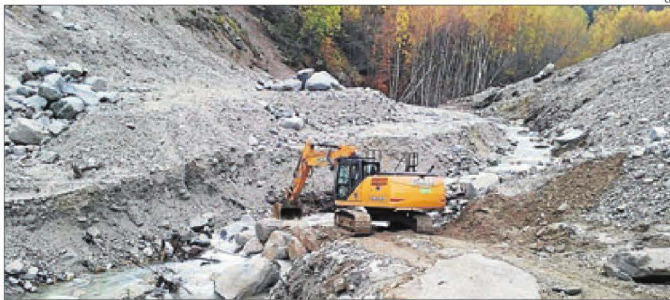
Els treballs se centren ara en la construcció d'una escullera al marge dret del Valarties.

Actualment el curs del riu Valarties no presenta ja cap mena d'obstrucció al pas de les aigües. El pendent en el qual es va produir el lliscament està desproveït de la seua cobertura vegetal i deixa a la vista dos brolladors.