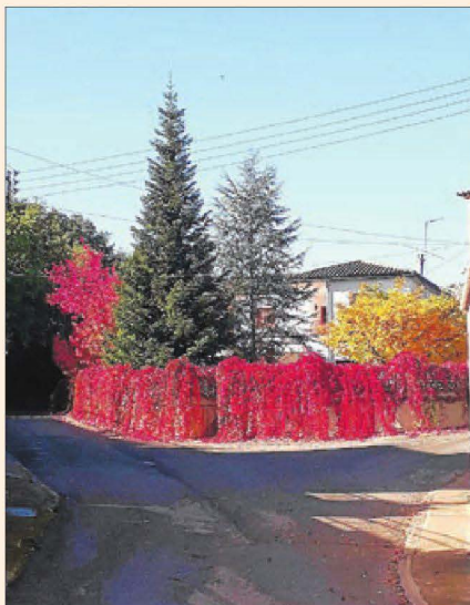
Cromatisme tardoral. L'explosió de colors d'aquesta estació és una de les seues característiques més espectaculars.