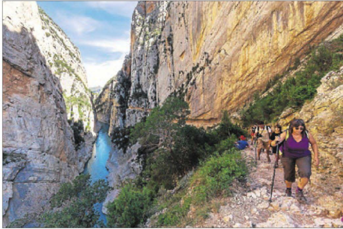
Imatge d'arxiu de turistes al congost de Mont-rebei.

Durant els mesos de juny, juliol i agost van visitar aquest espai natural un total de 22.793 persones i l'estiu del 2017 van ser 25.314. Aquesta disminució de visitants es deu principalment als talls a l'accés al congost com a conseqüència de les allaus de pedres i roques durant els mesos de juliol i agost que van mantenir la carretera tancada durant més de dos mesos. No obstant, els turistes van poder accedir al pàrquing de Sant Esteve de la Sarga per un camí alternatiu. L'any 2018 també es va registrar un despenjament que va tallar l'entrada al congost durant vuit dies. Segons les dades de la fundació tant l'any 2018 com el 2019 es van registrar allaus de roques en el mateix període que van provocar anul·lacions de reserves al pàrquing de Sant Esteve de la Sarga. Aquestes dades cor-