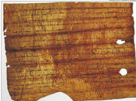
Un pergami de 815 de l'Arxiu de la Seu d'Urgell, el més antic.

El primer conté l'estudi de 49 pergamins conservats a la