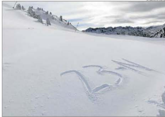
Les pistes de Baqueira amb la data d'obertura dibuixada a la neu.

Les nevades de les últimes setmanes han deixat gruixos que oscil·len entre els 90 centímetres a la cota 2.500 i els 60 centímetres a 1.800 metres d'altitud. El fred intens, amb temperatures de fins a 8 graus sota zero, ha permès una intensa producció de neu artificial. En aquest sentit, els responsables de l'estació treballen per poder obrir més pistes a finals d'aquest mes.