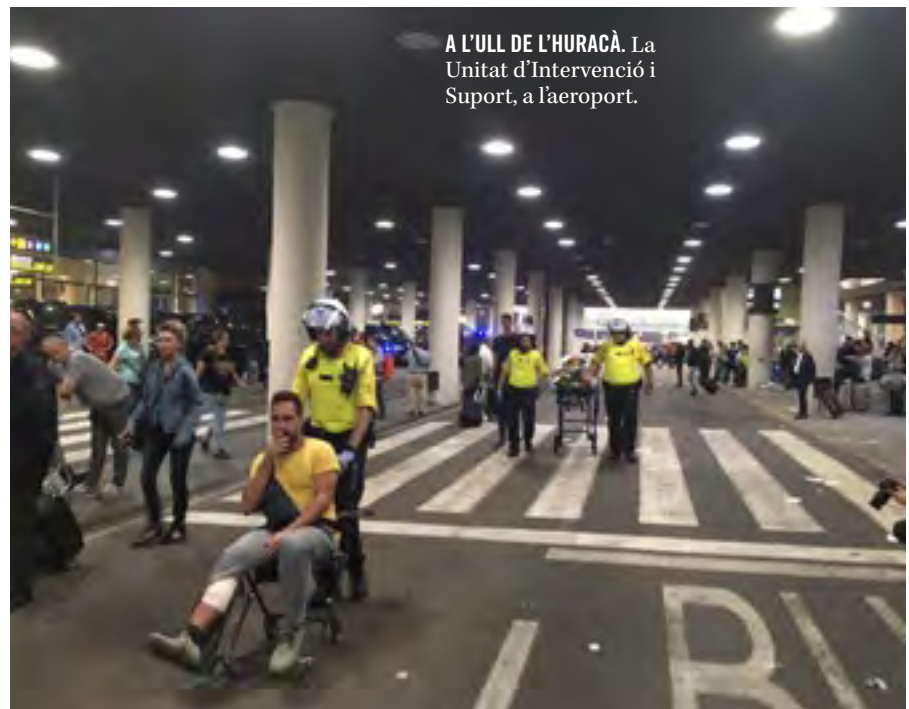
A L'ULL DE L'HURACÀ. La Unitat d'Intervenció i Suport, a l'aeroport.