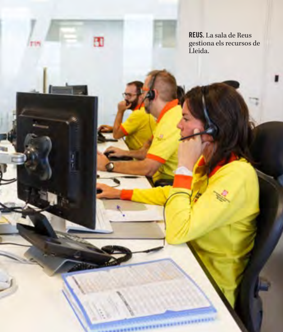
REUS. La sala de Reus gestiona els recursos de Lleida.