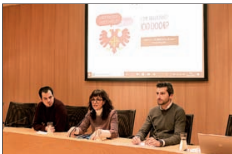
L'alcaldessa, a la sessió informativa dels comptes

D'aquesta manera, la capital de l'Urgell reprèn el procés de pressupostos participatius després de diversos parèntesis electorals. Totes les aportacions van ser recollides en el tram final de l'anterior mandat mitjançant via telemàtica i bústies físiques. Posteriorment, es van agrupar les propostes similars o repetides i se'n van des-