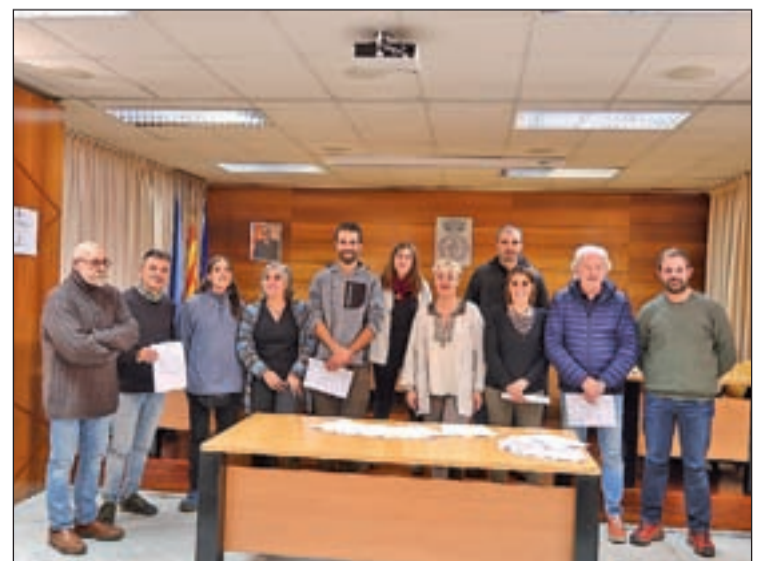
Pla general dels representats de les entitats que han signat

De la mateixa manera, es fomentarà una promoció creuada entre l'entitat i el Geoparc. Aquests convenis tenen una validesa de dos anys prorrogable i seran revisats anualment.