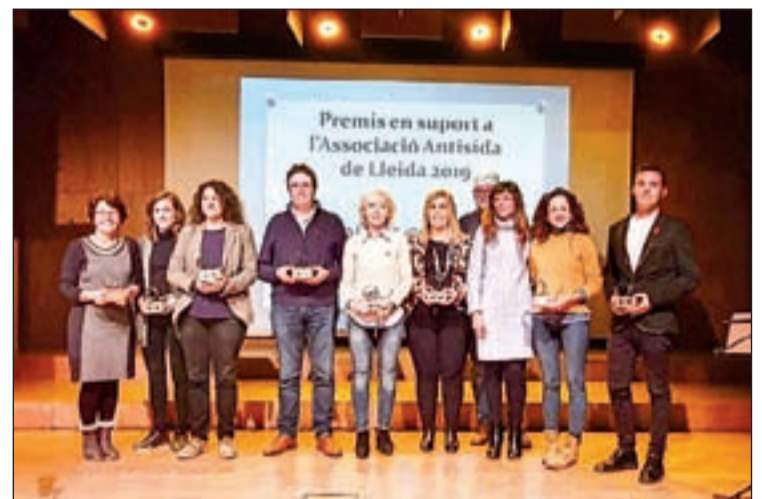
FOTO: / Moment en que van recollir el premi de l'Associació Antisida

En l'acte d'entrega de premis de l'Associació Antisida de Lleida celebrat fa uns dies a la capital del Segrià l'oficina Jove del Consell Alta Ribagorça va rebre un guardó per la seva col·laboració. Aquest premi s'atorga a les tècniques de Joventut per la seva tasca en la lluita contra la sida entre els col·lectius joves.