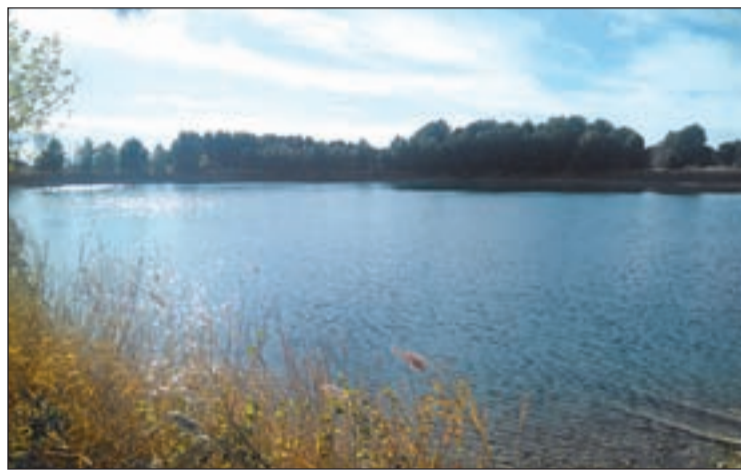
Un 'bypass' garanteix el subministre al municipi

Tot i que aquesta microalga no és tòxica, produeix un gust "desagradable" a l'aigua que la fa del "tot inapropiada per a l'ús de boca". El consistori diu que ha aparegut arran de la crisi climàtica, després de la gran sequera patida durant aquest estiu, que va comportar un canvi en l'origen del subministrament de l'aigua que transcorre pel Canal d'Aragó i Catalunya. Amb aquest canvi, de l'embassament de Joaquín Costa al de Santa Anna, i les altes temperatures registrades ha aparegut aquesta