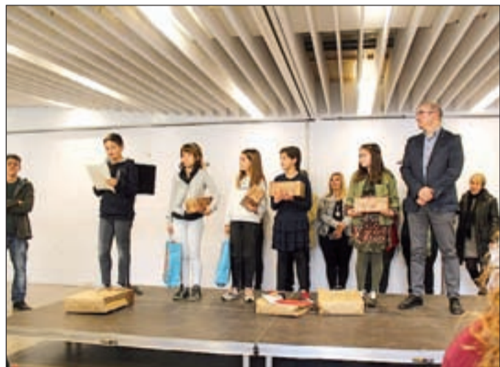
La celebració del premi es va fer el passat diumenge

En l'actualitat només poden aterrar vols diürns i ho fan en diversos espais com el camp de futbol municipal, però fins ara els vols nocturns no estan autoritzats, els d'emergències mèdiques tampoc. Aquest és un servei que s'està implantant en diferents punts de Catalunya.