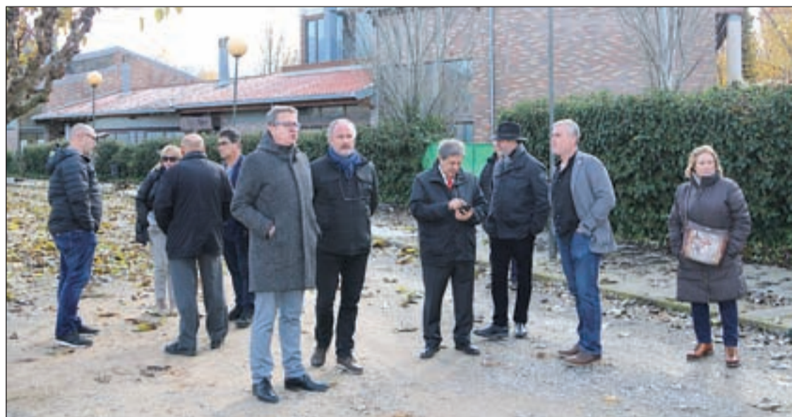
Las autoridades visitaron el edificio en el que se ubicará el centro

Corroborada la solvencia del centro en la formación de estas disciplinas, Generalitat, Diputació de Lleida y los ayuntamientos de la Pobla de Segur y la Torre de Capdella han firmado un protocolo de intenciones para promover las enseñanzas profesionales de deportes de montaña. Este centro