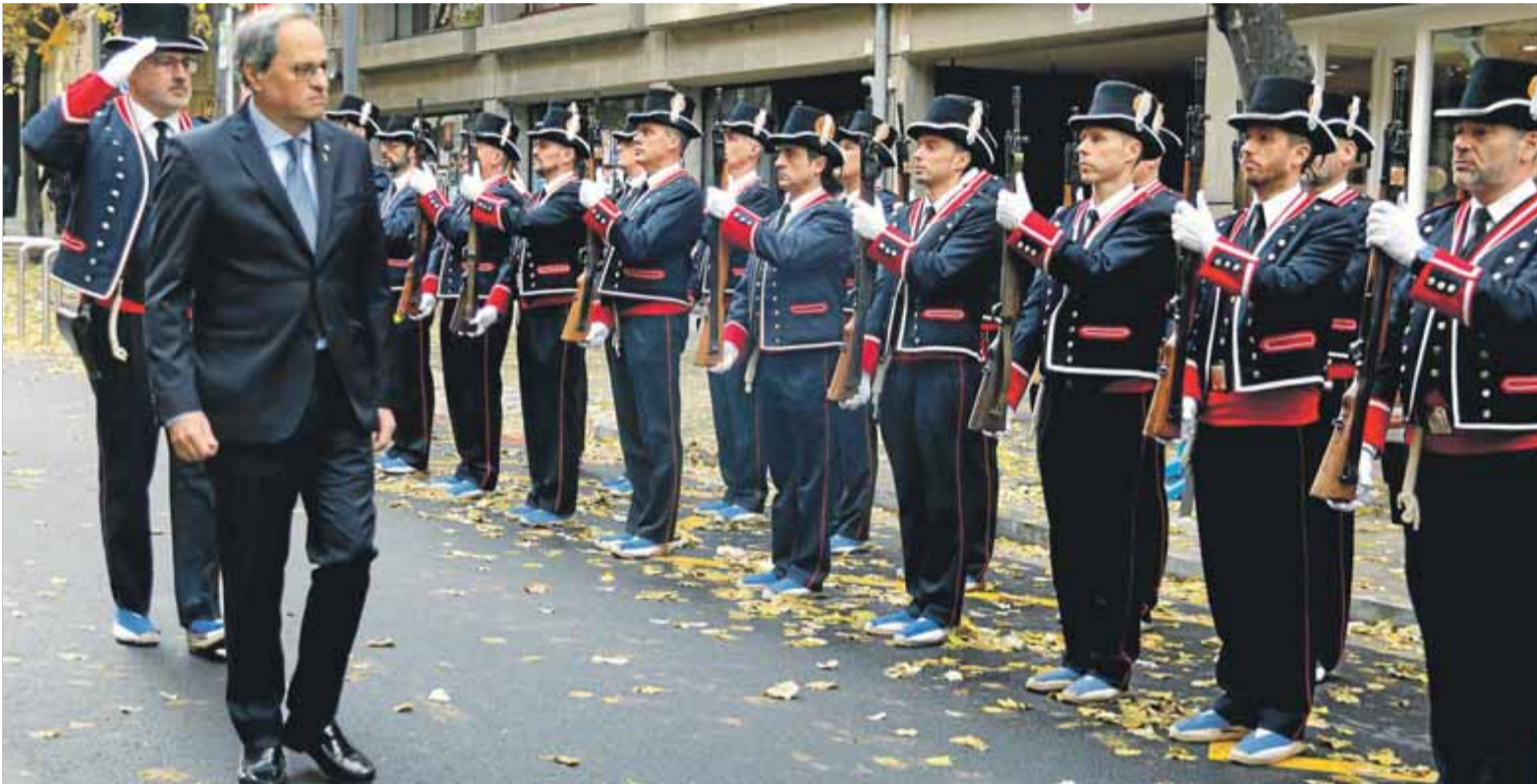
El president, Quim Torra, passant revista a la formació de gala dels Mossos d'Esquadra, ahir a Vic

El president demana al cos que sigui punta de llança per “deixar enrere comportaments dels segles XIX i XX” ■ Celebra els 25 anys de l’inici d’un desplegament que va substituir “una presència imposada”