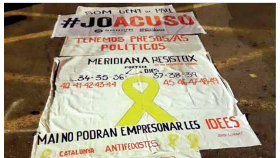
Una de les pancartes al terra de l'avinguda Meridiana ■ #MERIDIANARESISTEIX AL TELEGRAM

Ahir, els veïns van tallar puntualment la via, a les vuit, per iniciar tot seguit una assemblea per debatre les accions futures. Els Mossos d'Esquadra van fer acte de presència com cada nit i van pressionar perquè el tall s'acabés puntualment a les 10. ■