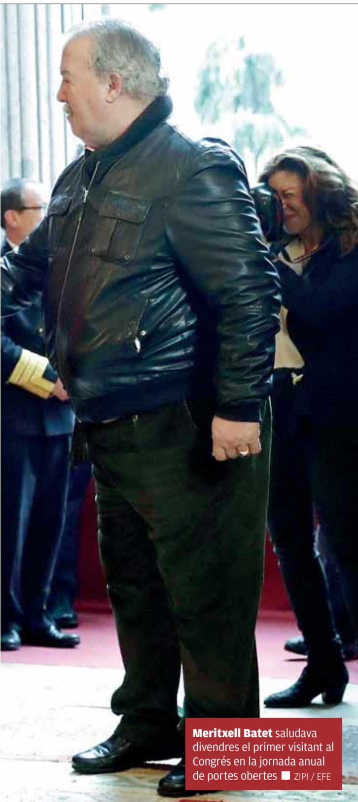
Meritxell Batet saludava divendres el primer visitant al Congrés en la jornada anual de portes obertes

■ L'exconseller Santi Vila sosté que o bé menteix Rajoy o bé els ministres que, abans de la DUI, a ell li asseguraven que no hi hauria 155 si hi havia comicis