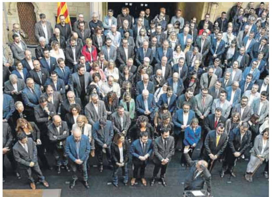
Alguns dels alcaldes reunits al Palau de la Generalitat el 26 d'octubre passat