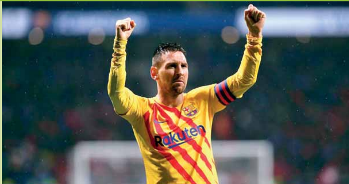
Messi va marcar un gol providencial a les acaballes del partit