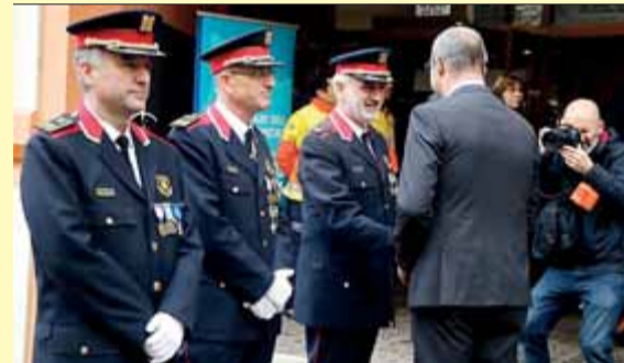
Buch saluda alguns comandaments dels Mossos

NEGATIU • Els mecanismes de contenció de l'augment de la temperatura planetària han fracassat i els efectes ja es noten