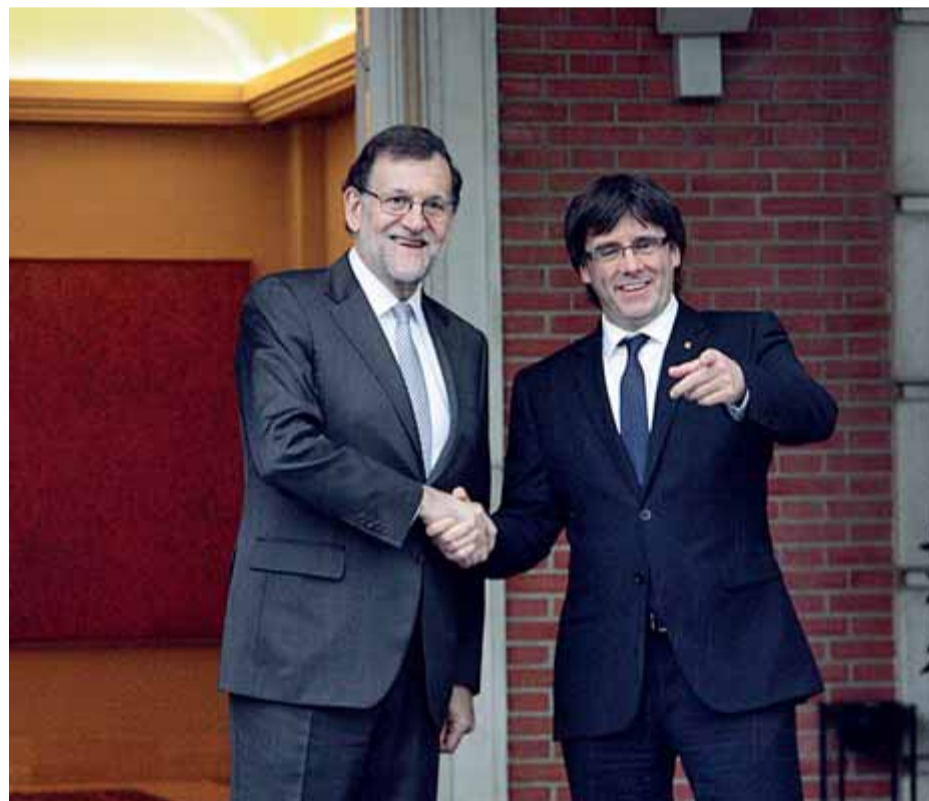
Rajoy i Puigdemont abans de reunir-se a La Moncloa l'abril del 2016

L'exconseller de Cultura del govern de Puigdemont, Santi Vila, protagonista de contactes aquell octubre amb el govern de Rajoy, considera que o bé Rajoy menteix o aleshores van mentir-li altres membres del govern del PP: "Si això que comenta Rajoy és així, es confirma que el president Puigdemont deia la veritat i que a mi m'enganyaven". De fet, Vila defensava dissabte a la nit al programa FAQs de TV3 que ministres amb els quals ell