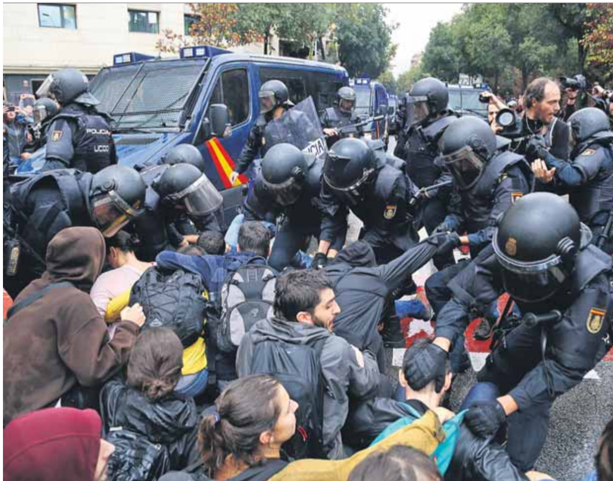
Antiavalots de la policia espanyola contra manifestants davant l'escola Ramon Llull de Barcelona, l'1-O