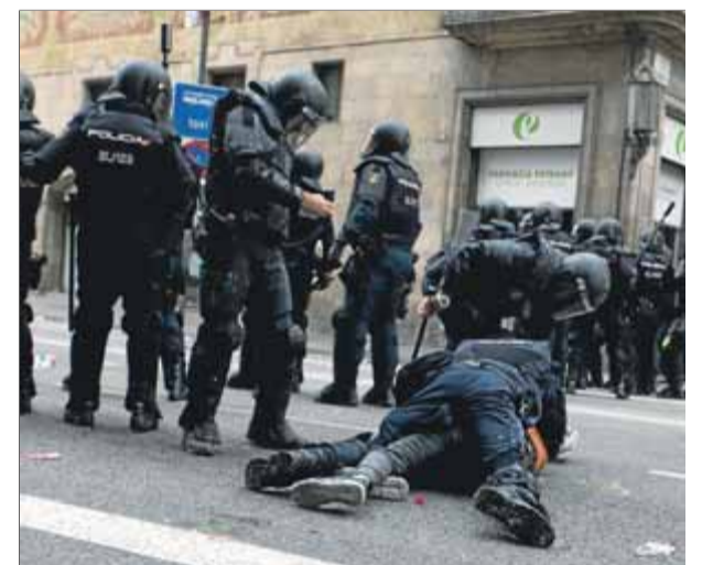
Un agent de la Policia Nacional fent una detenció a Barcelona el 18 d'octubre passat a Via Laietana

ces amb cúter, hores sense menjar ni beure, agressions sense motiu i, fins i tot, un intent de suïcidi. L'objectiu és presentar l'informe "davant autoritats i organitzacions socials, nacionals i internacionals del Consell d'Europa i de les Nacions Unides". El treball alerta d'un entorn de violència institucional. ■