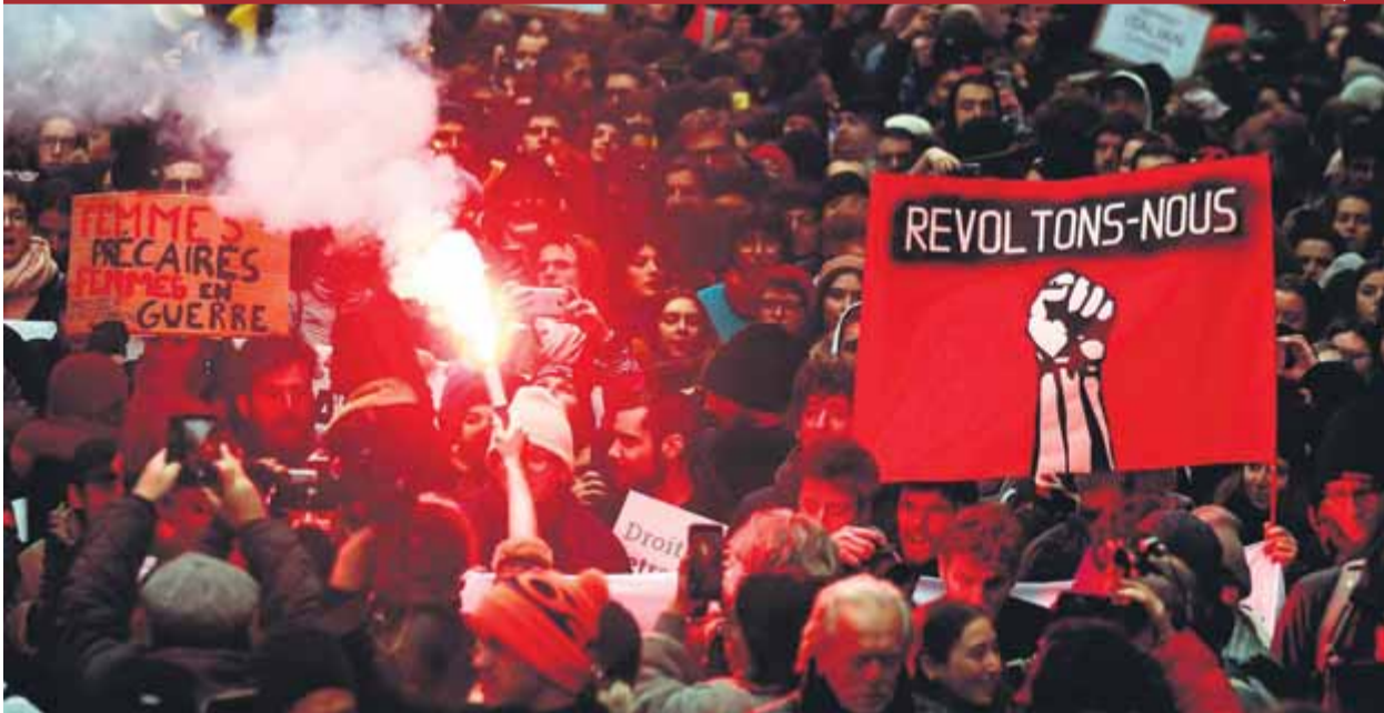
Una gentada, en la manifestació d'ahir a París contra la reforma de les pensions ■