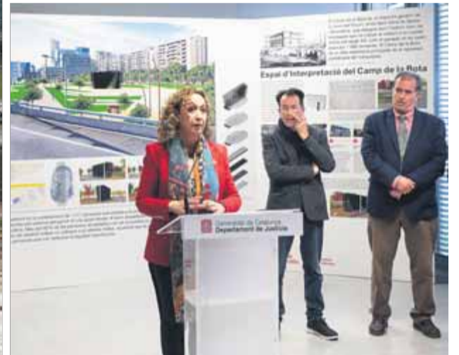
Futur parc del campus Diagonal-Besòs, on s'aixecarà el monument als afusellats -imatge virtual superior- i acte de presentació del memorial del Camp de la Bota, ahir al campus