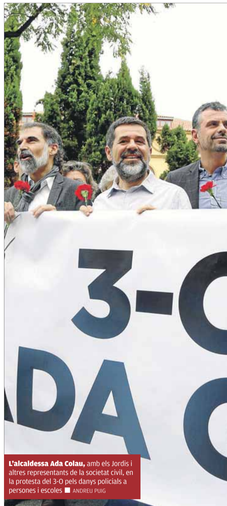
L'alcaldessa Ada Colau, amb els Jordis i altres representants de la societat civil, en la protesta del 3-0 pels danys policials a persones i escoles

Les seccions de l'Audiència de Barcelona fan habitualment plens no jurisdiccional per evitar resolucions contradictòries entre si sobre interpretació de la norma penal, i en el cas de l'acusació popular fan seus els fonaments ju-