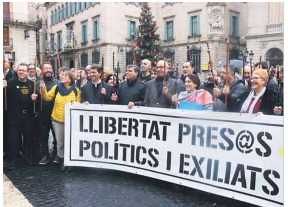
Els alcaldes concentrats ahir a la plaça de Sant Jaume per demanar la llibertat dels presos i exiliats abans de marxar en manifestació cap a la Delegació del Govern espanyol ■ ACN

Els alcaldes i regidors, autoorganitzats en una plataforma del món local -sense nom-, van protestar davant les "injustícies" de l'Estat i van demanar la llibertat dels "presos polítics i exiliats". Ni l'ACEC ni l'Associació de Municipis