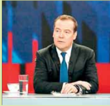
Medvédev se sent perseguit

Quatre anys d'exclusió en els Jocs Olímpics i en campionats mundials