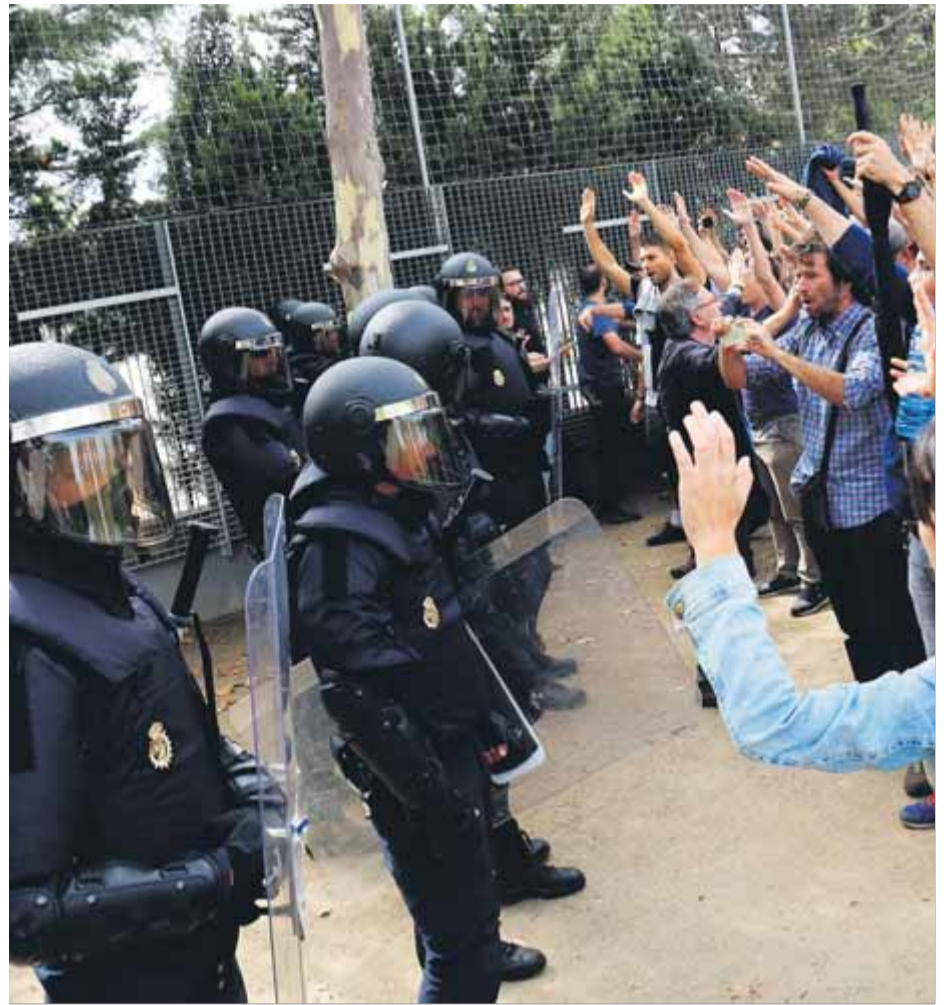
Efectius de la Policia Nacional a l'IES Ronda de Lleida l'1-0 ■ ACN

El jutge ha demanat més d'una vegada totes les imatges disponibles a la policia, però el cos només ha enviat alguns vídeos curts de les actuacions, no pas les actuacions senceres. La d'ahir va ser la primera sessió en què l'Ajuntament de Barcelona no ha pogut comparèixer com a acusació popular. ■