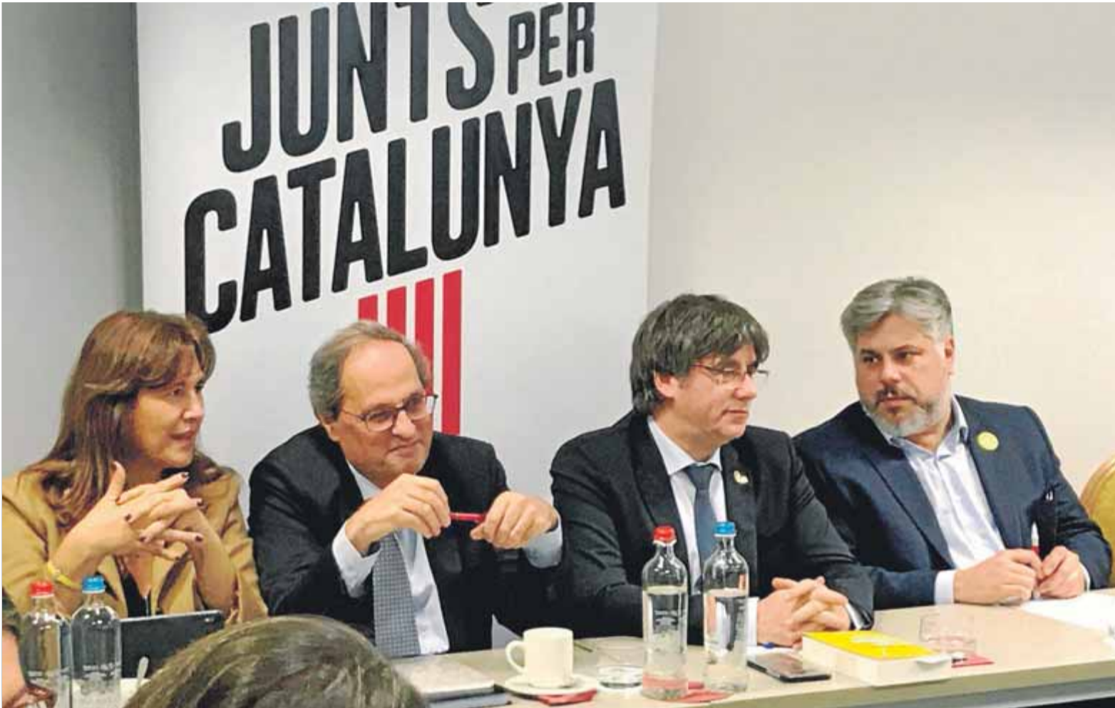
Un moment de la reunió de JxCat ahir a Brussel·les. D'esquerra a dreta, Laura Borràs, el president Torra, Carles Puigdemont i Albert Batet