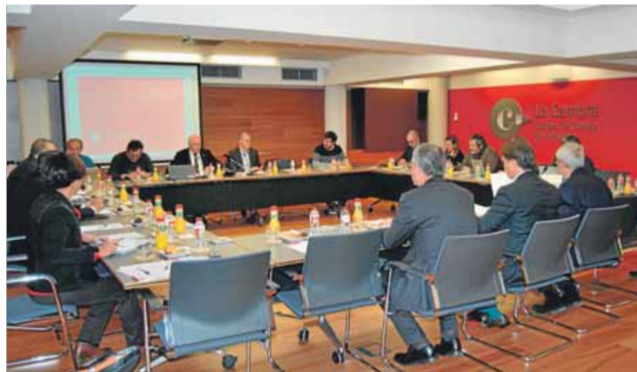
Presentació del pressupost i pla de treball per al 2020 de la Cambra de Terrassa