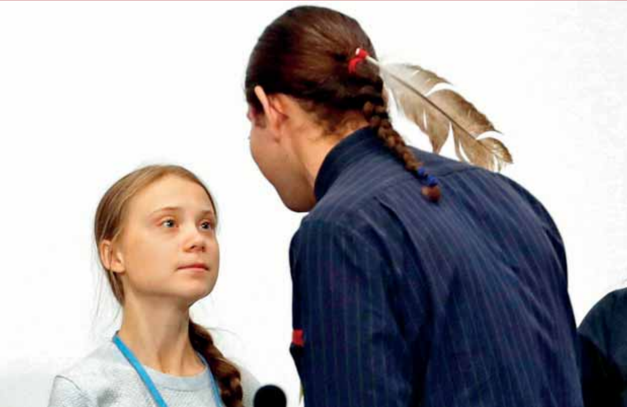
Greta Thunberg, ahir a la tarda saludant un activista poc abans de la seva roda de premsa en la cimera COP25