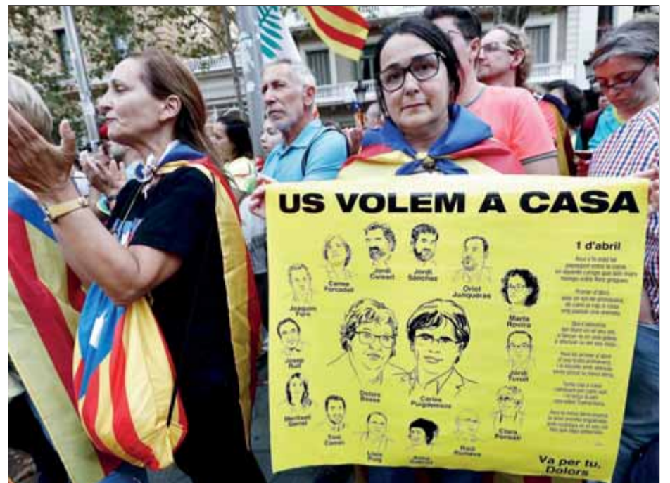
Una manifestant, amb la imatge dels presos polítics i exiliats en la protesta del 18-O