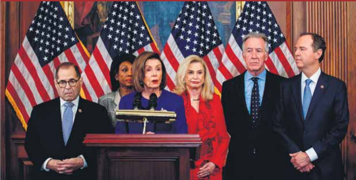
La presidenta de la Cambra de Representants, Nancy Pelosi, anuncia els càrrecs contra Trump per l'afar d'Ucraina ■ EFE