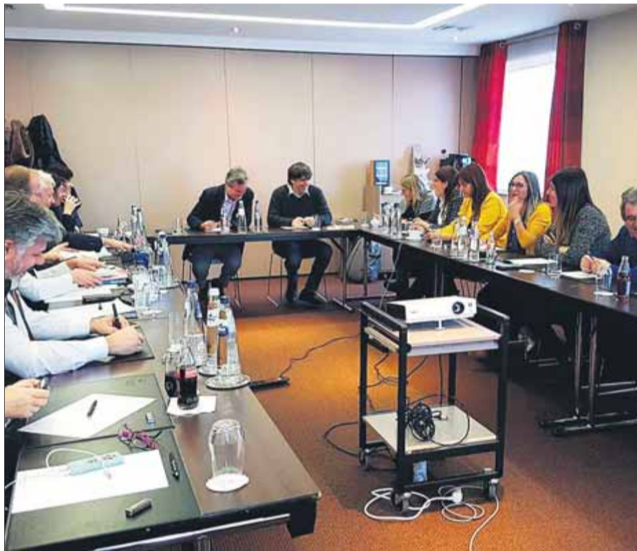
Un moment de la reunió de la Crida amb Carles Puigdemont a Waterloo ■ LA CRIDA

Segons la solució que s'acabi escollint final-