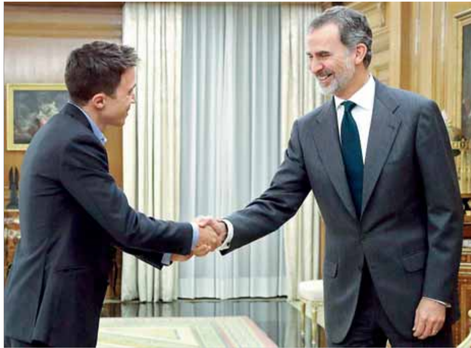
Felip VI rebia ahir a La Zarzuela per primer cop Íñigo Errejón (Més País)

La via del PSOE de sumar a Podem el vot a favor