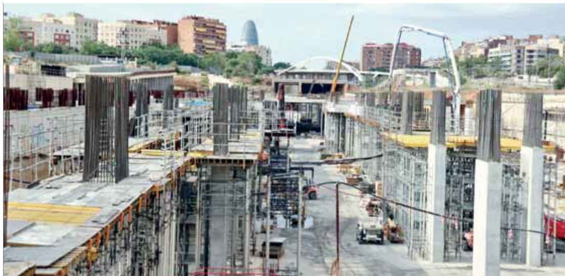
Vista de les obres de la futura estació ferroviària a la Sagrera

El nou govern que ha de sortir, si és que surt, de les negociacions amb ERC té un horitzó ple de núvols i tempestes, i molt probablement algunes podrien esdevenir potents borrasques. El canvi climàtic ja ens ha ensenyat el poder destructiu d'aquests fenòmens meteorològics i les dificultats que hom té per mitigar-ne les destrosses una vegada la fúria ja s'ha desfermat. Tot i que estem en plena conferència sobre el canvi climàtic organitzada per l'ONU a Madrid, i ens han dit que estem en "emergència climàtica", avui em refereixo al tifó polític que clarament s'apropa. De fet, el que ens passarà és el que passa a tothom quan té un problema i no l'afronta al seu moment: que el temps el complica molt més i en genera d'altres d'associats. Aquesta Constitució que el dia 6 alguns celebraven amb gran pompa i eufòria ha facilitat el que avui queda molt clar: Madrid ha jugat contra Catalunya i també contra Espanya. El problema és que el gran poder mediàtic és a Madrid, que té una visió centralitzada i centralitzadora i que fa anys que els intoxiquen amb campanyes contra Catalunya i els catalans, i no s'han adonat que amb aquest discurs tapaven comportaments i polítiques recentralitzadores, i avui Madrid és el