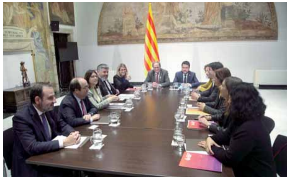
La reunió de la taula de diàleg polític que es va fer al febrer a la Generalitat

la reunió de l'executiu català, en què va afirmar que la convocatòria encara no estava feta perquè eren dies complicats. "Està apunt d'anunciar-se perquè estem treballant per consensuar un calendari", va dir. De fet, la consellera ja va donar una resposta similar fa una setmana, però va circumscriure la convocatòria a la primera quinzena d'aquest mes després que el president de la Generalitat, Quim Torra, va expressar a la reunió de govern del 19 de novembre la voluntat de recuperar deu mesos després aquesta