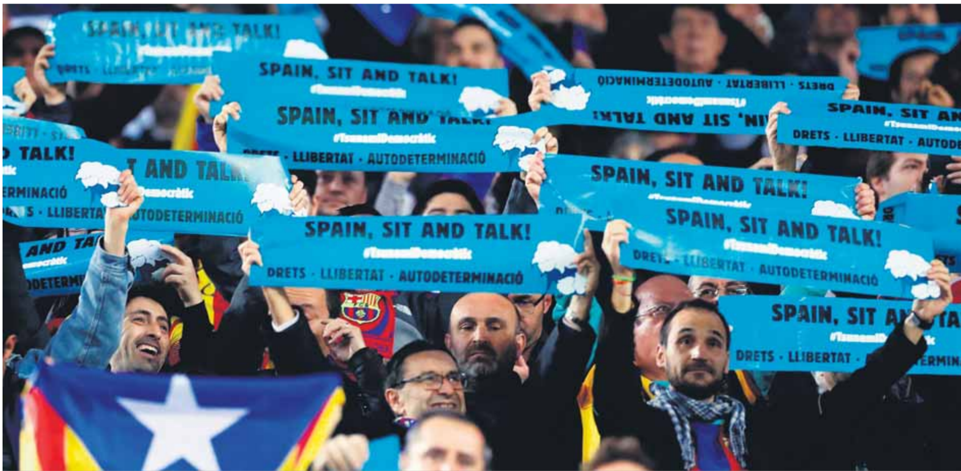
Aficionats mostren les pancartes repartides pel Tsunami Democràtic demanant diàleg a l'Estat a l'inici del partit

ALDARULLS · La jornada acaba amb enfrontaments a l'exterior del Camp Nou