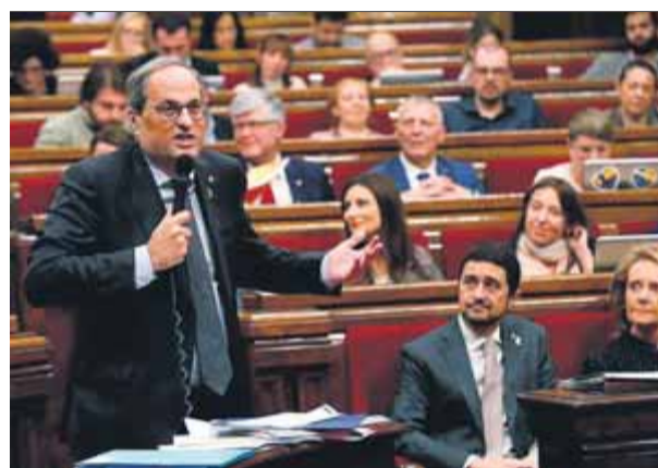
Torra, ahir durant la sessió de control al Parlament ■ T.A. / EFE

■ Anuncia que convocarà els partits després de festes en virtut del seu “acord nacional” ■ ERC veu bé la iniciativa