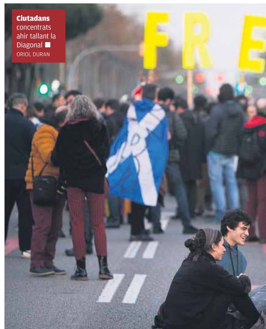
Ciudadans concentrats ahir tallant la Diagonal

Des de fora el perímetre, la gent que hi havia concentrada pel Tsunami, mirant el seu mòbil, esperant una indicació que no arribava per concretar l'acció de protesta que els havia dut fins allí, s'acostaven a la tanca i alguns increpaven els guardes de seguretat. Aquests tenien la missió d'escorcollar un a