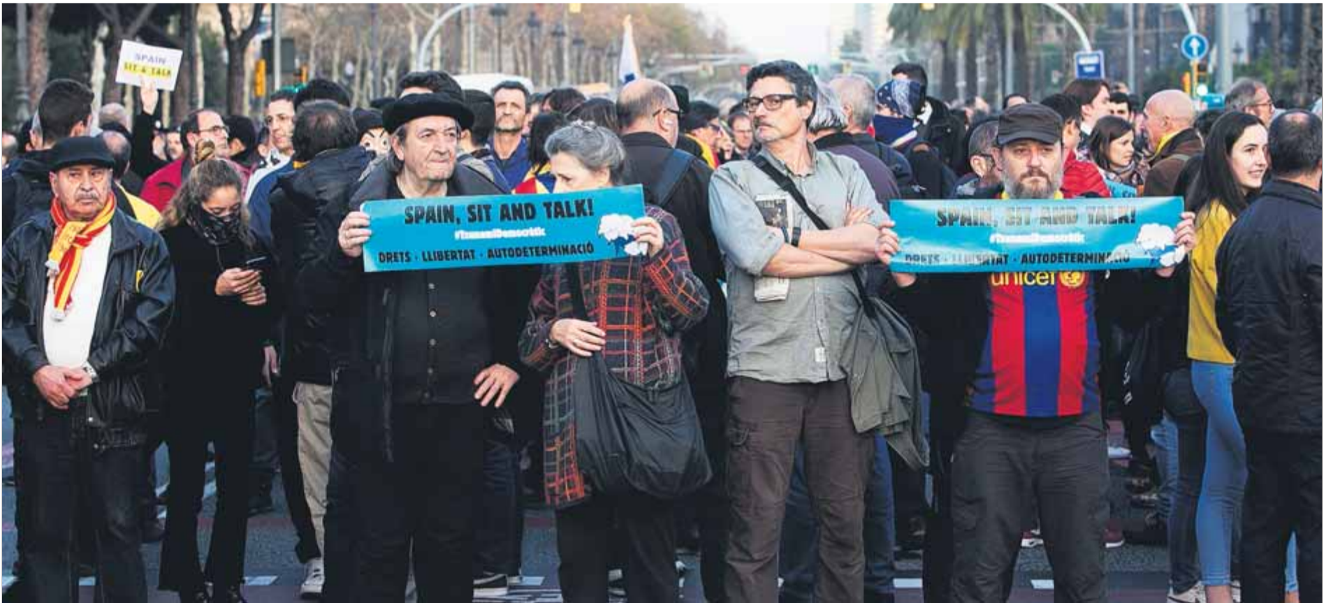
Manifestants protestant al voltant del Camp Nou abans de l’inici del partit reivindicant un diàleg amb el govern espanyol que inclogui l’autodeterminació ■ ORIOL DURAN