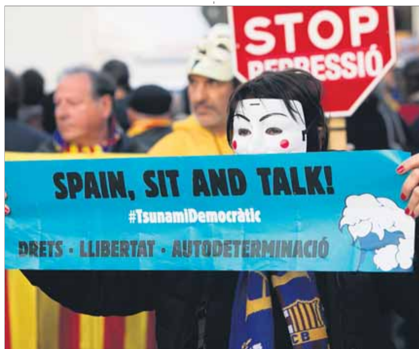
Una manifestant amb el cartell repartit pel Tsunami Democràtic ■ ORIOL DURAN

Quan el Tsunami Democràtic va fer una crida perquè tothom anés a Travessera per veure el partit en una pantalla gegant, la gent es va quedar com a mitges, com si esperessin alguna cosa més. Finalment el projector no funcionava i els aficionats (és a dir, tothom) van haver d'escoltar el partit amb transistors i mòbils. Abans de la mitja part els agents de la policia van començar a carregar. Per sorpresa, com si algú hagués fet alguna cosa, quan ningú havia fet res. Com sempre. ■