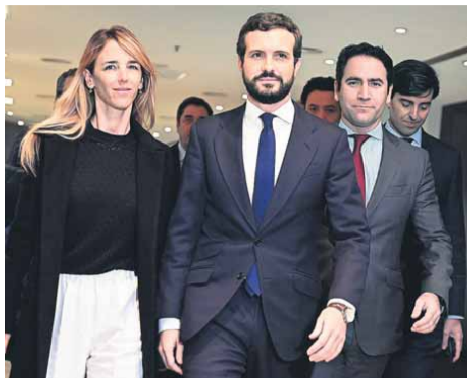
Pablo Casado amb Teodoro García Egea, secretari general del PP, i Cayetana Álvarez de Toledo, portaveu popular al Congrés

A Ciutadans, Inés Arrimadas sosté que el tribunal europeu “ni anul·la ni qüestiona” la sentència de Junqueras i promet treballar a Espanya i a Europa perquè “els pròfugs de la