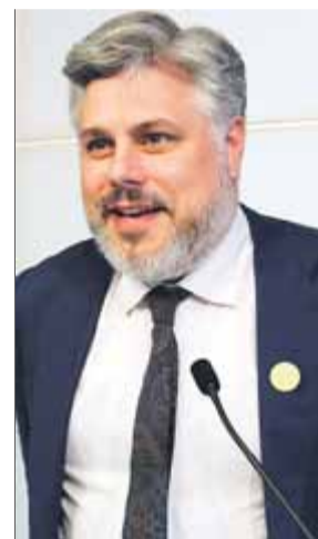
Batet , al Parlament

Junts per Catalunya va exigir "dimissions" a la judicatura espanyola. "Exigim dimissions, les que corresponguin davant les