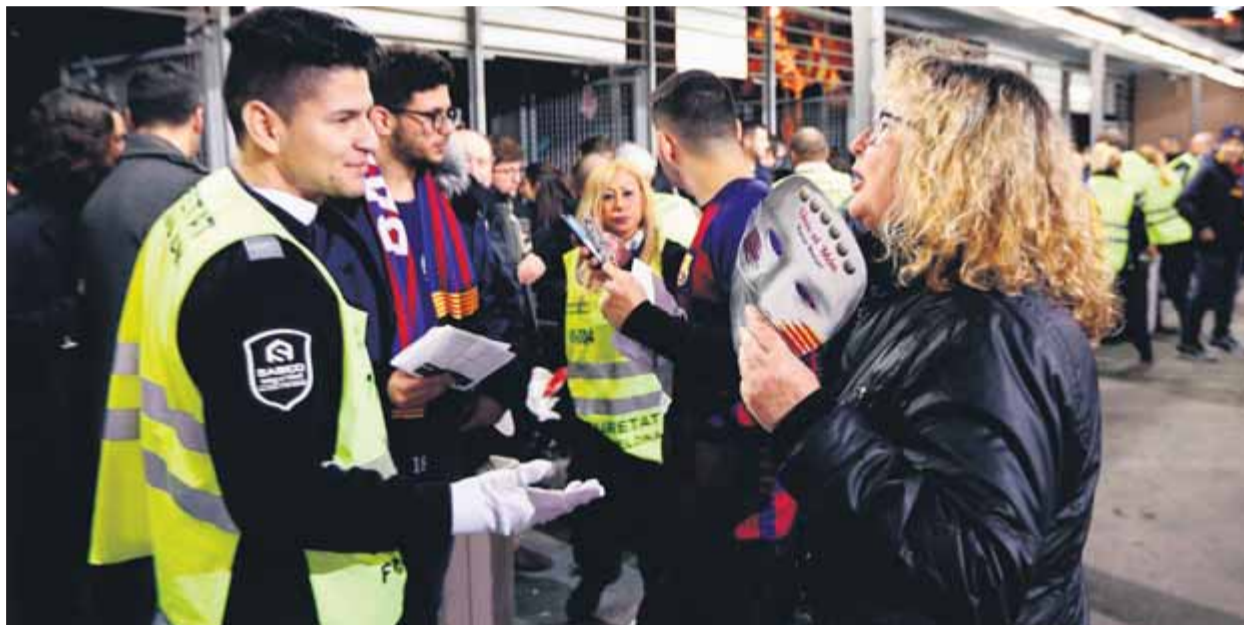
La seguretat del Barça va requisar caretes de Messi i pancartes, i segons Buch, va interceptar els drons

D'altra banda, els detinguts, a qui s'acusa de desordres públics pel llançament d'objectes i d'atemptat contra l'autoritat pública, van començar ahir a