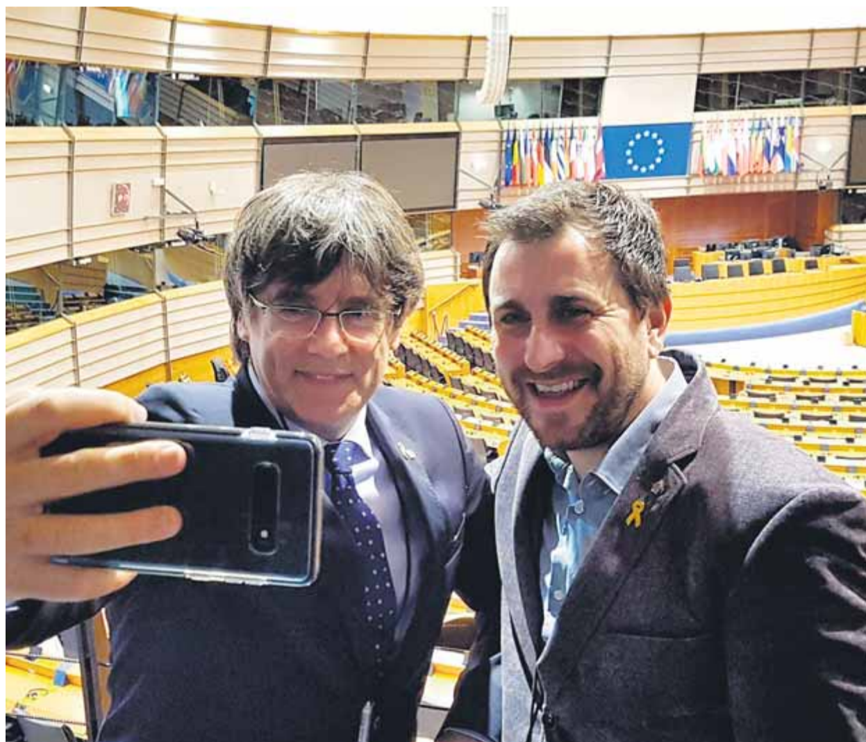
Puigdemont i Comín es fan una 'selfie' a l'hemicicle del Parlament Europeu, ahir al matí a Brussel·les ■ M.S.

PUIGDEMONT · “És una derrota per a alguns, però una gran victòria per a Europa”