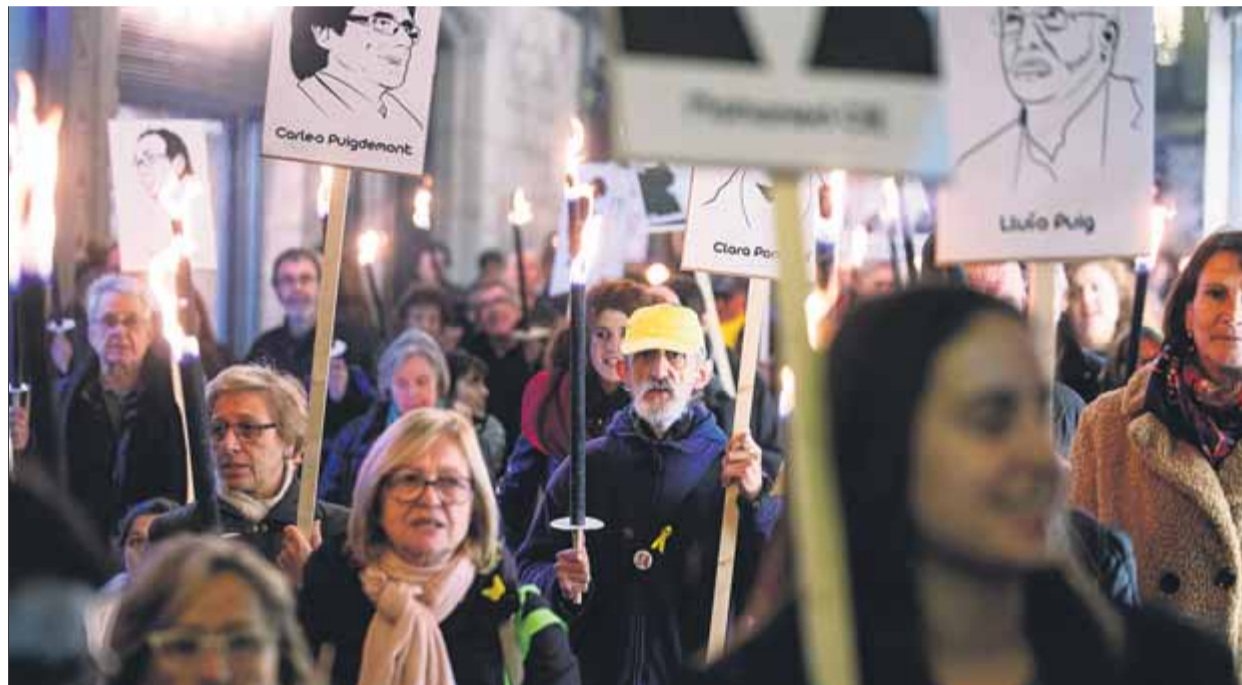
La marxa de torxes de Girona va sortir ahir al vespre des de la plaça del Vi

Sota el lema Per Nadal, els i les volem a casa , la ciutadania va sortir ahir al vespre al carrer en les més d'una trentena de marxes de torxes organitzades per exigir la llibertat dels presos polítics catalans i el lliure retorn dels exiliats. La iniciativa de les marxes de torxes els dies previs al Nadal és una iniciativa que el col·lectiu Rescat va posar en marxa el 2002 en solidaritat amb els presos polítics bascos. En l'edició d'aquest any s'hi han afegit l'ANC, els CDR i Alerta Solidària, entre altres grups de suport als detinguts arran de les manifestacions contra la sentència. Entre ahir i avui se n'han convocat a 35 municipis del país. L'acció també es va realitzar ahir al País Basc, concretament a Vitòria i Bermeo, i dues més a Altsasu i Larraga, a Navarra. Al Principat: a Cadaqués, Ripoll, Sils, Vilanova i la Gel-