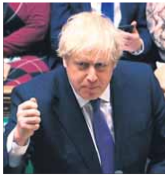
Johnson, al Parlament

La Cambra dels Comuns finalment avala el pla de Boris Johnson per a la sortida de la Gran Bretanya de la UE