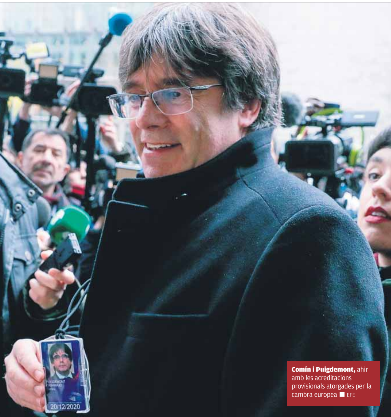
Comín i Puigdemont, ahir amb les acreditacions provisionals atorgades per la cambra europea