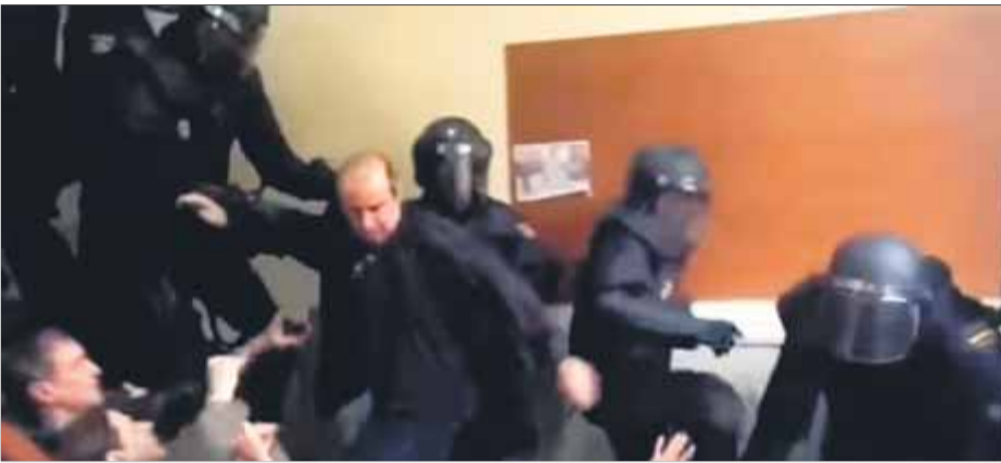
Antidisturbis de la policia empenyen votants de l'1-O a l'institut Pau Claris de Barcelona