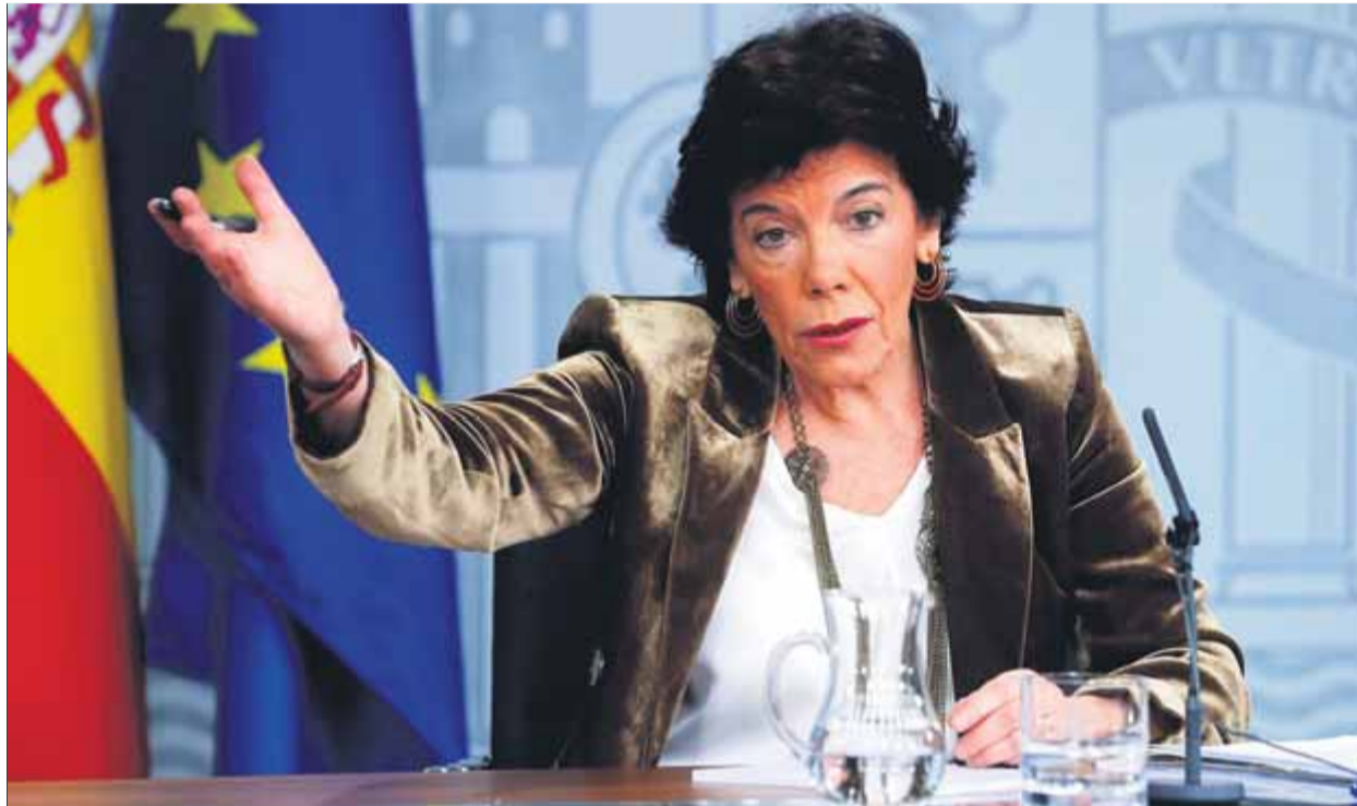
Celaá instava ahir els republicans a escoltar la veu del líder des de Lledoners per no aturar la negociació

Tot i haver pronunciat en la campanya del 10-N el