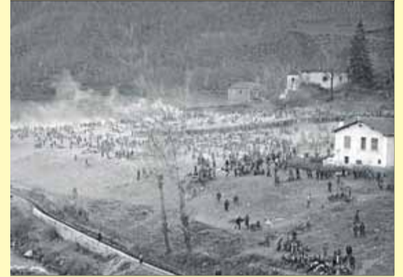
Republicans refugiats a Prats de Molló ■ PHILIPPE GAUSSOT