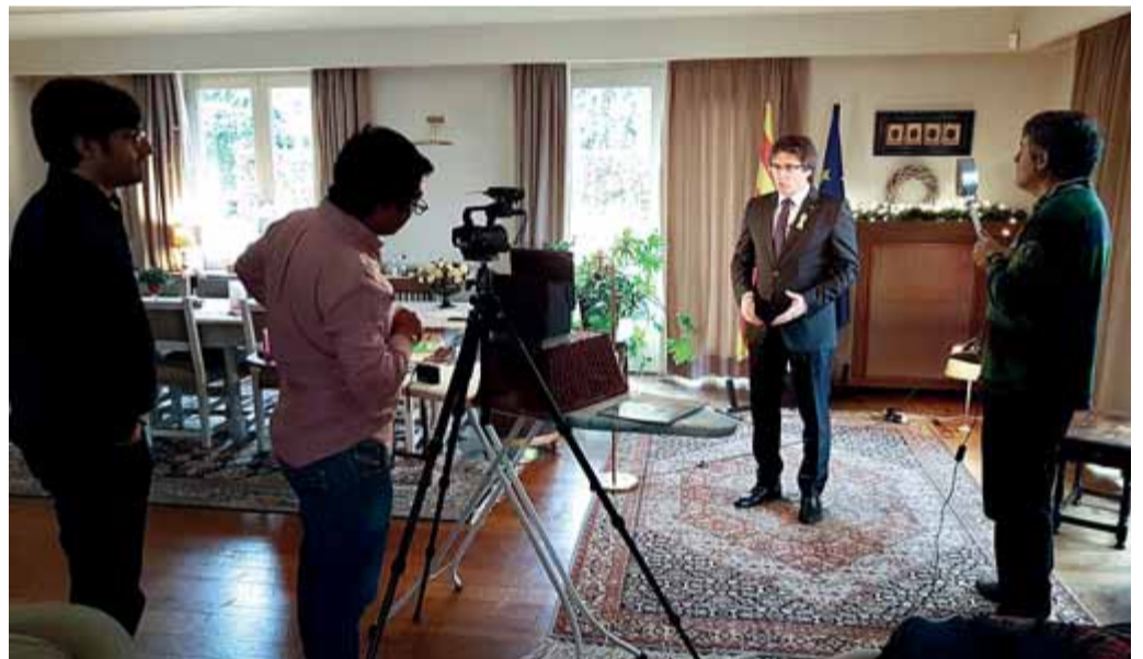
El missatge de Cap d'Any del 2018 el va enregistrar a Saint-Nicolas, prop d'Anvers. La fusta de planxar i el cistell que aguanta la càmera, i un col·laborador aguantant un focus amb la mà, deixen constància de les condicions en què el president ha hagut de treballar des de l'exili per donar una imatge de normalitat.