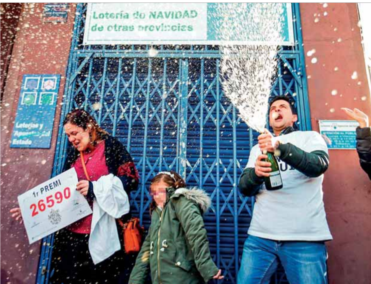
La família que gestiona l'administració de la rambla Guipúscoa de Barcelona celebra que han repartit el primer premi

SORT • Deu dels tretze grans premis recauen al país i un veí de Mollerussa s'endú 18 milions