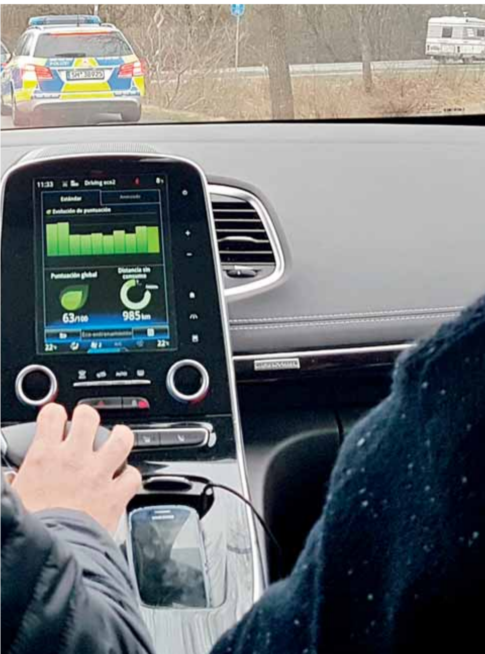
La detenció de Puigdemont a Alemanya , el mes de març del 2018, va commocionar el país. La foto, inèdita, correspon al moment en què la policia alemanya fa senyals al conductor del vehicle on viatjava el president perquè abandonés l'autopista i s'aturés en una àrea de servei.