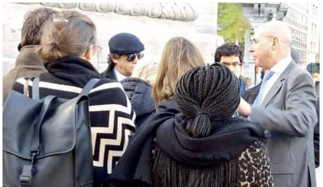
Un mes després d'arribar a Bèlgica , el president Puigdemont –amb ulleres de sol i gorra per passar desapercbut– es presenta voluntàriament (ell i la resta de consellers que són al país) a la policia belga per respondre a l'euroordre del jutge Llarena. A la foto, envoltat de col·laboradors i advocats.