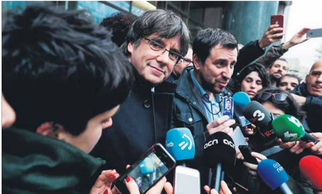
Puigdemont i Comín, el dia que van rebre les acreditacions provisionals per accedir a l'eurocambra

El ministeri públic considera que a partir d'ara cal primer de tot que la cambra els retiri la immunitat, tot i que indica que