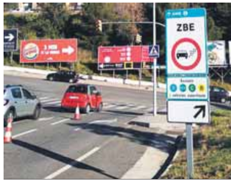
Cartells indicadors ■ M. MEMBRIVES

Tot a punt per a l'entrada en vigor de la zona de baixes emissions a Barcelona