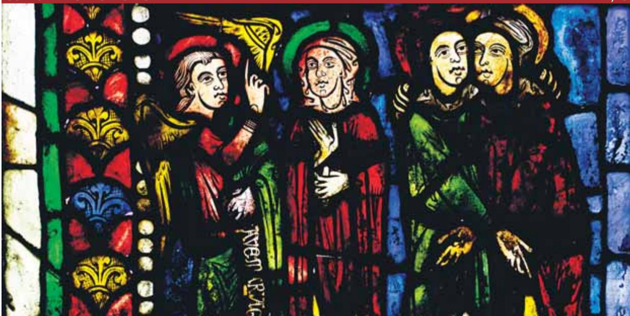
Detall d'un dels plafons del vitrall, que mesura en total uns tres metres d'alçada