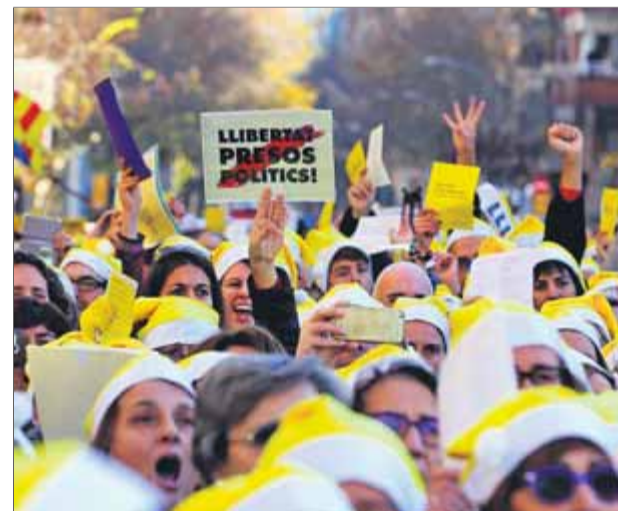
Cantaires concentrats davant de la presó Model el Nadal del 2017 per cantar nades pels presos

El primer Nadal que els presos van estar tancats a la presó es van organitzar cantades multitudinàries en diversos punts del país. Una de les més secundades es va celebrar al carrer Entença de Barcelona amb centenars de cantaires que van interpretar diverses nades i una adaptació especial de la cançó És Nadal . ■