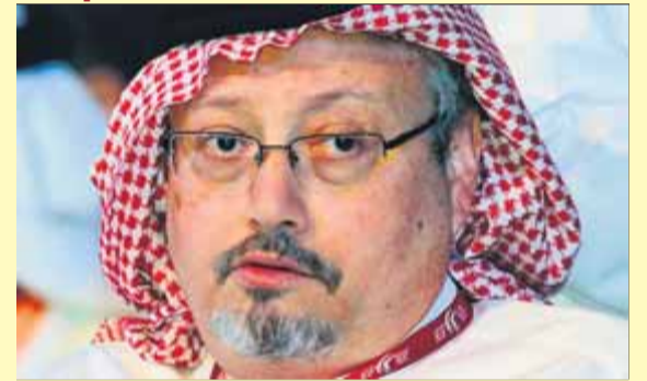
Jamal Khashoggi, en una imatge del 2012 a Dubai