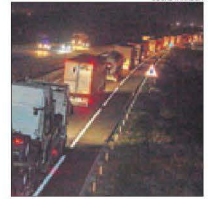
Imatge de la retenció.