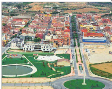
Vista aèria d'Almacelles.

Considera que els bancs no van exigir a la promotora una assegurança en cas de no entregar els habitatges