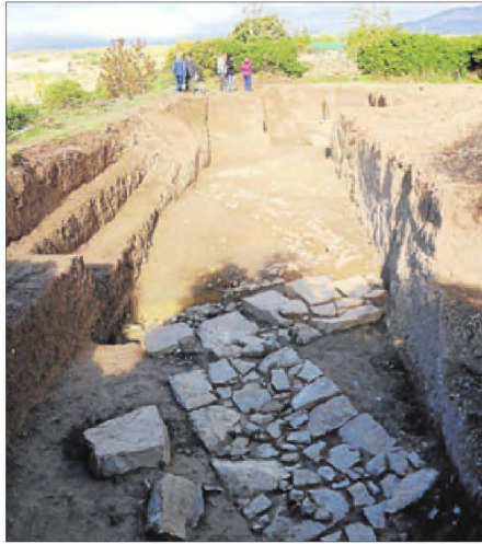
Restes romanes de l'última excavació a Aeso, l'octubre passat.

Amorós també va anar més enllà al considerar que "Isona és un diamant en brut patrimonial per explicar la història des de la paleontologia i els dinosaures, passant per l'època ibèrica i romana i fins al patrimoni romànic i medieval".