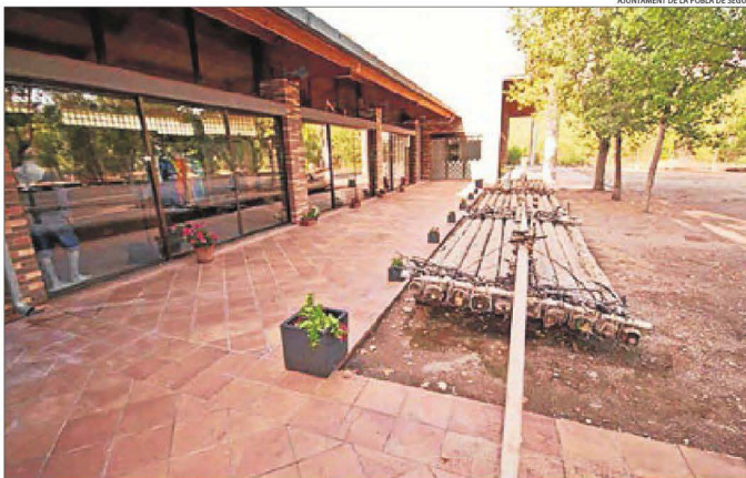
L'edifici de la Pobla on ara està ubicat l'espai Raier de la Pobla acollirà el nou centre.

El conveni també inclou la col·laboració d'empreses i organitzacions de la zona d'influència del sector, així com de les fundacions i entitats sense ànim de lucre que hi puguin col·laborar.