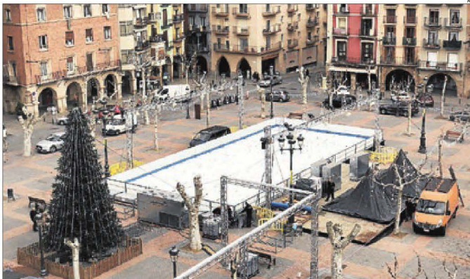
La pista de patinatge sobre gel de Balaguer entrarà en funcionament aquest pont de la Puríssima.

| SORT/BALAGUER | Sort i Balaguer tindran aquest hivern una pista de patinatge sobre gel. Les dos iniciatives tenen com a objectiu la promoció turística i dels comerços d'aquestes dos capitals de comarca en aquestes dates marcades per les compres nadalenes. A la capital del Sobirà, és la primera vegada que es posa en marxa una iniciativa d'aquestes característiques després que la idea es descartés fa dos anys a causa de la falta de temps per organitzar-ho. En aquesta ocasió, la pista estarà ubicada a la plaça Major i entrarà en funcionament des d'aquest divendres dia 6 i fins al 6 de gener de les 17 hores a les 21 hores. A més, l'alcalde de la ciutat, Raimon Monderde, va explicar que "estem estudiant que grups de nens de centres educatius de la zona puguin aprofitar les instal·lacions també durant el dia" i va afegir que "la proposta ha tingut molt bona acollida, ja que suposa un incentiu tant per al turisme com per a la gent del territori". La instal·lació tindrà un cost de 14.000 euros i preten