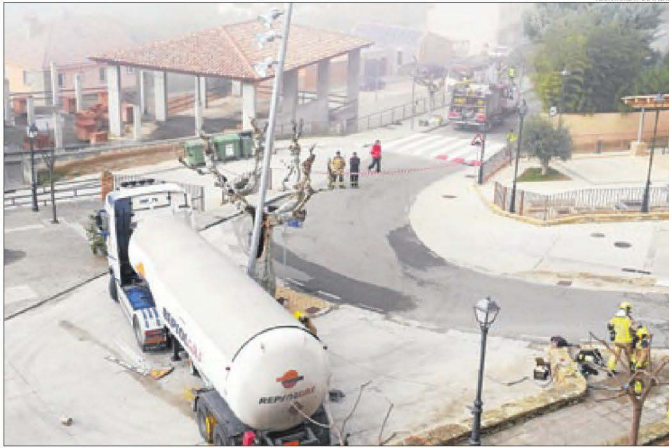
Imatge del camió cisterna que va impactar contra el fanal quan maniobrava.

Poc després es va iniciar el transvasament i cap a les 14.34 hores es va comprovar que la vàlvula afectada ja no vessava gas. Els treballs es van allargar