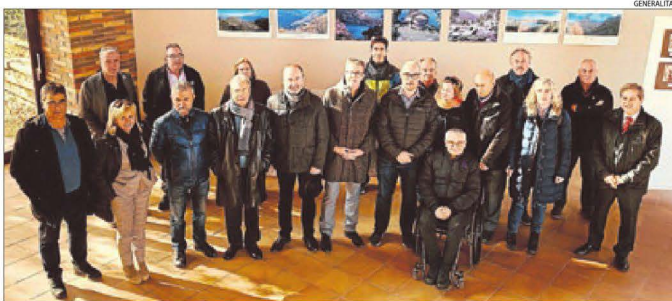
Els principals impulsors del projecte, ahir després de firmar el protocol sobre línies d'actuació.