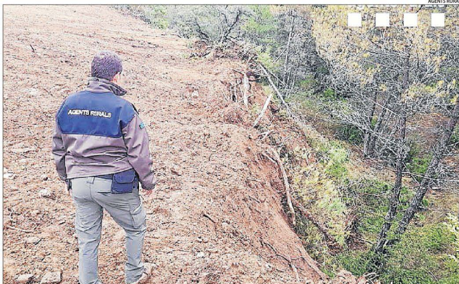
Imatge d'un rural a la zona de la rompuda al terme d'Abella de la Conca.

TREMP | Els Agents Rurals van interposar una denúncia per haver talat prop de 200 arbres en terreny forestal d'Abella de la Conca, al Pallars Jussà, i haver incomplert les condicions de la tala. Segons van informar els forestals, l'infractor tenia autorització per dur a terme la tala i convertir la zona en terreny agrícola, encara que va sobrepassar la superfície autoritzada en mitja hectàrea i va afectar dos barrancs limítrofs a conseqüència del moviment de terra. Fa uns mesos, els Agents Rurals també van interposar una denúncia per una tala d'arbres sense autorització a la Nogue-