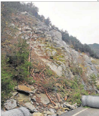
Imatge del desprendiment d'ahir a la C-13 a Llavorsí.

LLAVORSÍ | Carreteres de la Generalitat treballa en la retirada de roques a la C-13 després d'un desprendiment a Llavorsí a causa de les pluges dels últims dies i al fred. L'allau va obligar a tancar un carril i donar pas alternatiu fins a primera hora de la tarda. Les pedres no van envair la calçada ja que el pendent està reforçat amb malles. Els treballs continuaran una setmana fins a retirar totes les pedres i assegurar el talús de la muntanya al seu pas per aquest municipi del Sobirà. Les pluges van deixar ahir gairebé 10 litres per metre quadrat a Raimat i 9,4 litres a Torres de Segre. Al Pirineu, les precipitacions van ser més escasses.