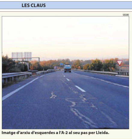
Imatge d'arxiu d'esquerdas a l'A-2 al seu pas per Lleida.