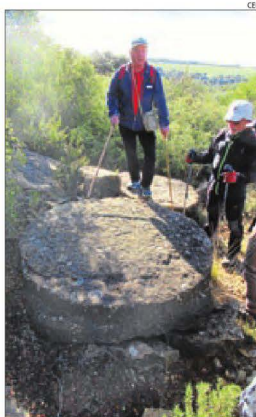
Una de les rodes de molí al clot de Moles (Vilamitjana).