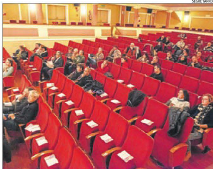
Imatge de la xarxa que es va celebrar ahir a Bellpuig.

El sector del transport és responsable del 42,9% del consum d'energia final a Catalunya