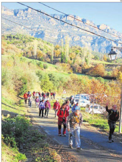
Inici de la caminada cap al pessebre.

Des de l'Hostal anem a la font de Balasc. Després ens enfilem cap al Grau del Vigatà (on posarem el pessebre) i finalment pujarem al tossal de la Campaneta (1.250 m). Un pastor ens va afirmar fa anys que aquests rodals es