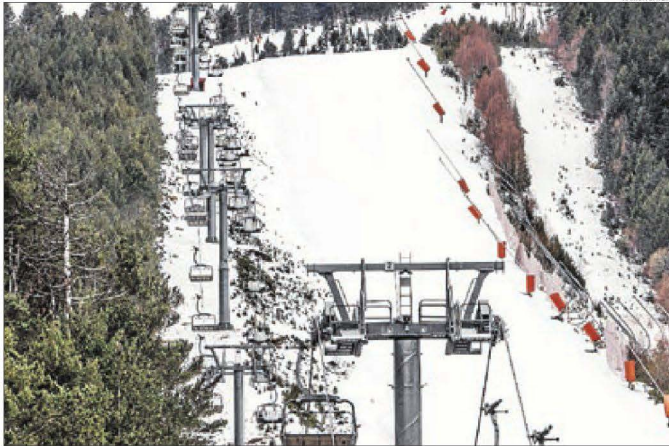
Imatge de les proves de càrrega que es van dur a terme ahir al nou telecadira d'Espot.