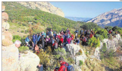
Cantada de nades al cim d'una muntanya.

Podeu trobar la caminada a l'entrada de Wikiloc: https://ca.wikiloc.com/rutes-senderisme/tolo-serra-de-campaneta-tolo-36705059 . Aquest track ens ha estat facilitat per la casa de turisme rural de Lo Cel de Toló.