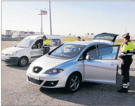
Imatge d'arxiu d'un control dels Mossos d'Esquadra.

A mitjans de juliol, els Mossos van arrestar un camioner de 57 anys de nacionalitat romanesa i veí de Montsó com a presumpte