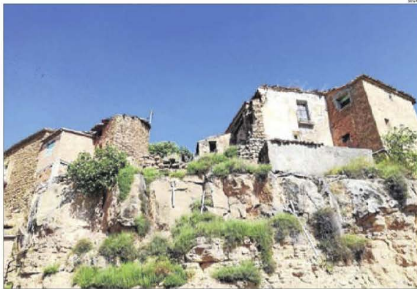
Les cases degradades que ara s'enderrocaran per evitar riscos i poder dinamitzar la Clua.

La CHE va expropiar en la dècada dels noranta les cases que ara s'enderrocaran. Ho va fer a petició dels propietaris que tenien terres de cultiu a l'entorn del poble que havien de quedar negades pel pantà. Aquests veïns es van traslladar a altres poblacions i a la Clua només van quedar tres famílies. Des de fa anys exigeixen a la CHE que actuï en aquests immobles atesa la progressiva degradació que els ha fet irrecuperables. Això ha arribat a ser un problema i fins i tot ha obligat els veïns a fer reparacions. "És una qüestió de seguretat ja que els habitatges poden caure en qualsevol