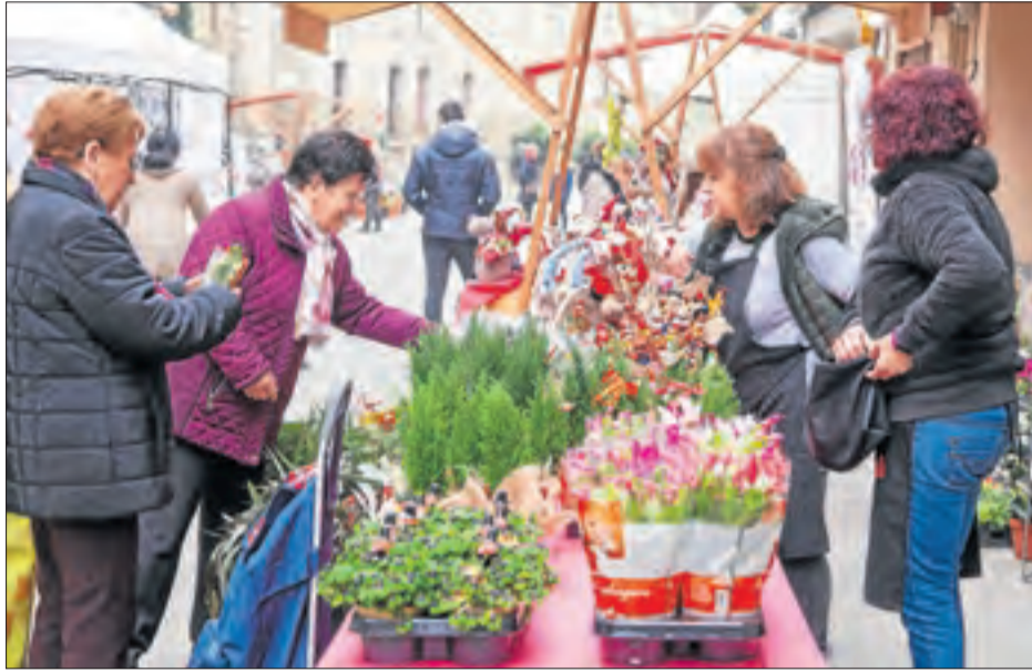
Una de les parades del Mercat de Nadal que va acollir ahir Cervera.