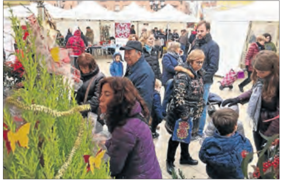
Arbres i decoració nadalenca, estrelles al Mercat de Santa Llúcia de Mollerussa.