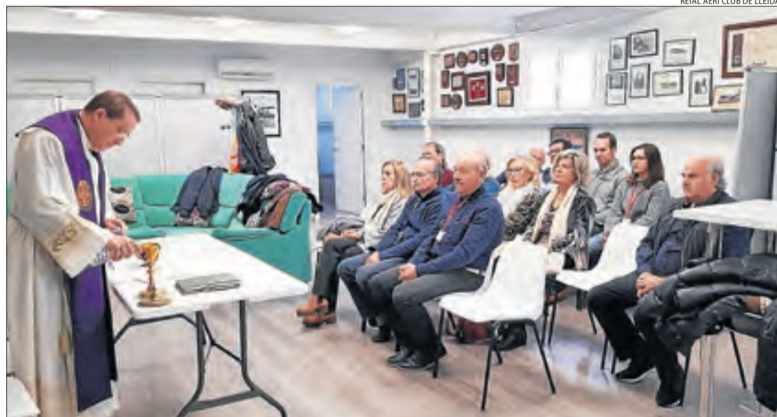
Missa a l'hangar de l'aeroclub a Alguaire amb motiu de la festa patronal de l'aviació.

una altra fins a Amposta. Així mateix, preveu que la ruta des de la capital del Segrià fins a Girona inclogui ramals en direcció a Barcelona a Calaf, Manresa i Vic. Altres ramals secundaris al llarg d'aquesta mateixa ruta hauran de conduir a Cardona, Berga, Castellar de n'Hug i Ripoll (vegeu el mapa).