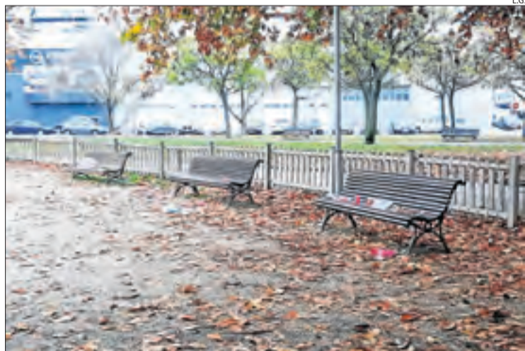
Vasos i botelles de plàstic es barrejava amb les fulles al parc.