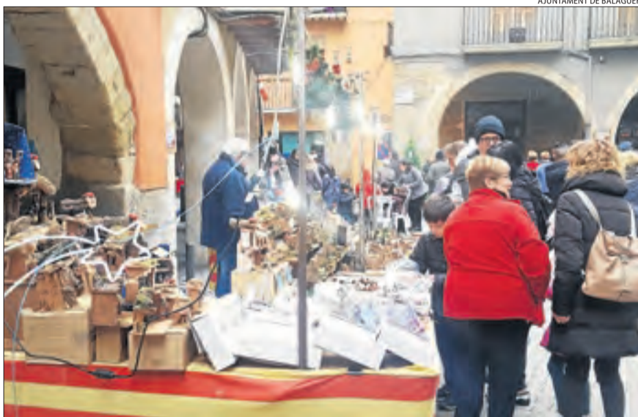
Nova edició de la Fira Mercat de Santa Llúcia ahir a Balaguer.