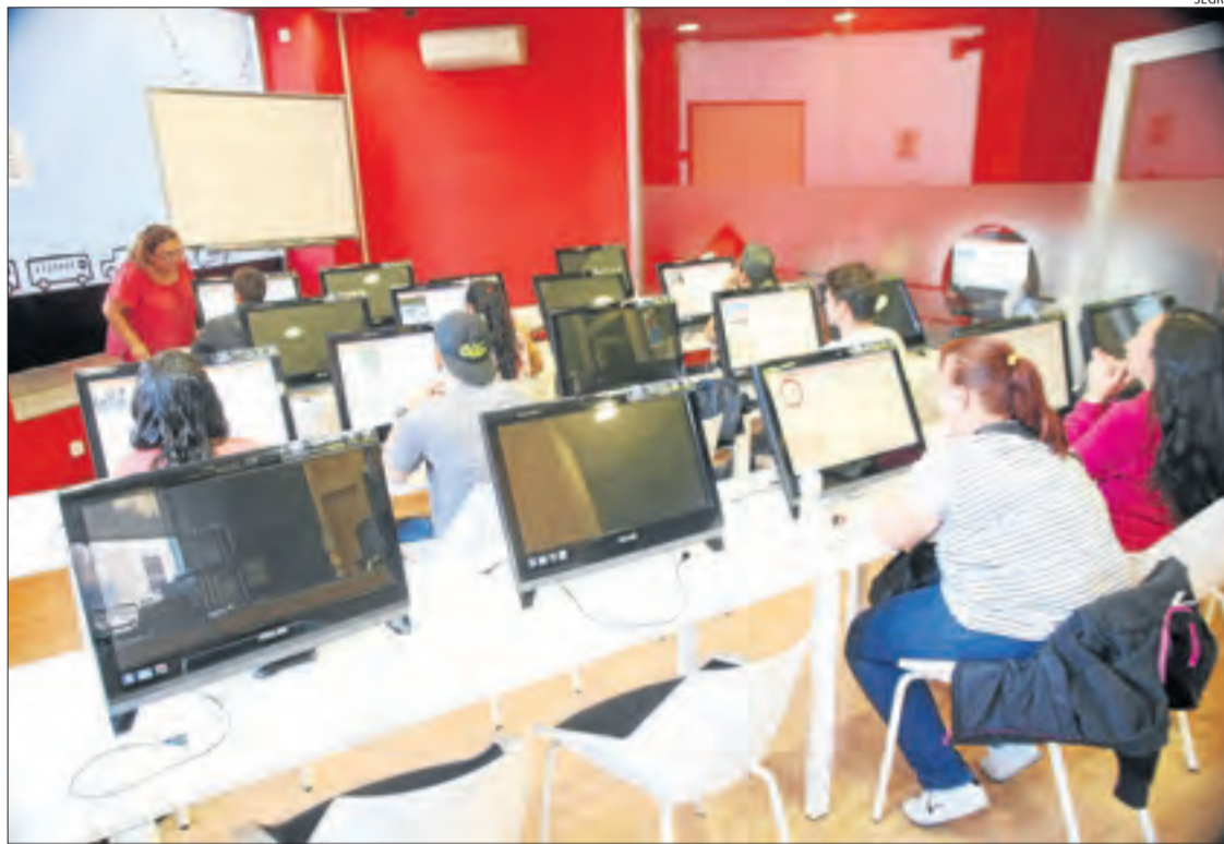
Imatge d'arxiu d'unes classes teòriques a l'Autoescola Pallars de la ciutat de Lleida.