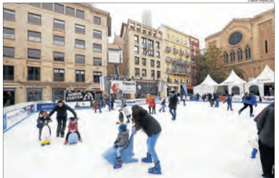
Usuaris gaudeixen de la pista de gel a la plaça Sant Joan de Lleida.