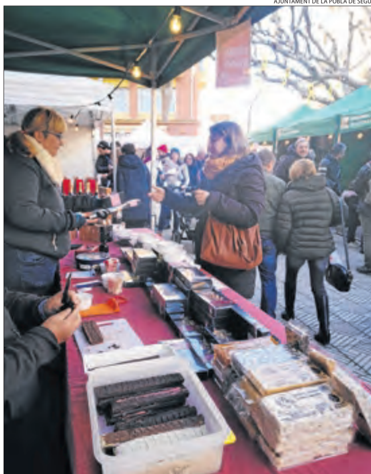
Torrans i productes tradicionals ahir a la Pobla de Segur.

Per la seua part, la plaça de l'Ajuntament de Mollerussa va acollir el Mercat de Santa Llúcia amb una vintena de parades que van oferir tota mena d'objectes nadalencs, com regals o decoració.