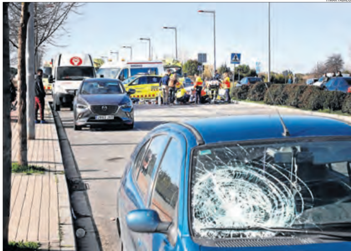
Dilluns passat va morir a Lleida una dona atropellada per un conductor drogat i que es va escapar.

En total, a falta de la jornada d'avui per tancar l'exercici, un total de 36 persones han mort aquest any d'accident de trànsit a Lleida, una menys que el 2018.