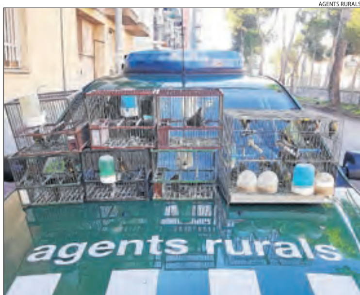
Vista de les quatre gàbies trampa detectades a Cervera.

BARCELONA | El DOGC va publicar ahir la convocatòria per incorporar 25 noves places de la categoria de subinspector del cos de Bombers de la Generalitat. El termini per presentar sol·licituds comença avui i s'allargarà fins al pròxim 29 de gener. Un any després del desplegament del Projecte Bombers 2025, un total de 150 aspirants ja han iniciat el període de pràctiques i està prevista la seua incorporació el mes de maig. Així mateix, el proper 8 de gener 250 aspirants a Bombers iniciaran el curs bàsic de formació i el passat 23 de desembre es va fer pública la convocatòria de 250 noves places.