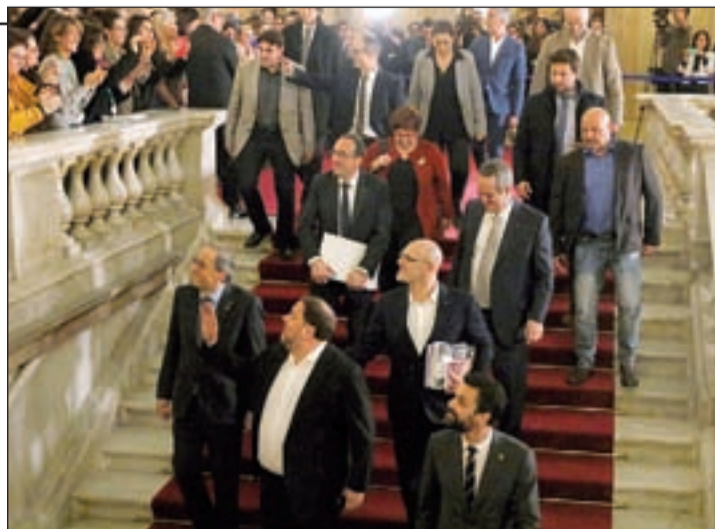
Los políticos presos, ayer en el Parlament

con aplausos. Todos dejaron claro que no se arrepentían de la organización de la jornada del referéndum del 1 de octubre de 2017. El primero en declarar fue Junqueras, quien insistió en que no renunciará al diálogo incluso con los que aplauden sus encarcelamientos de una forma "entusiasta". TEMA DEL DIA | PÁG. 3-4