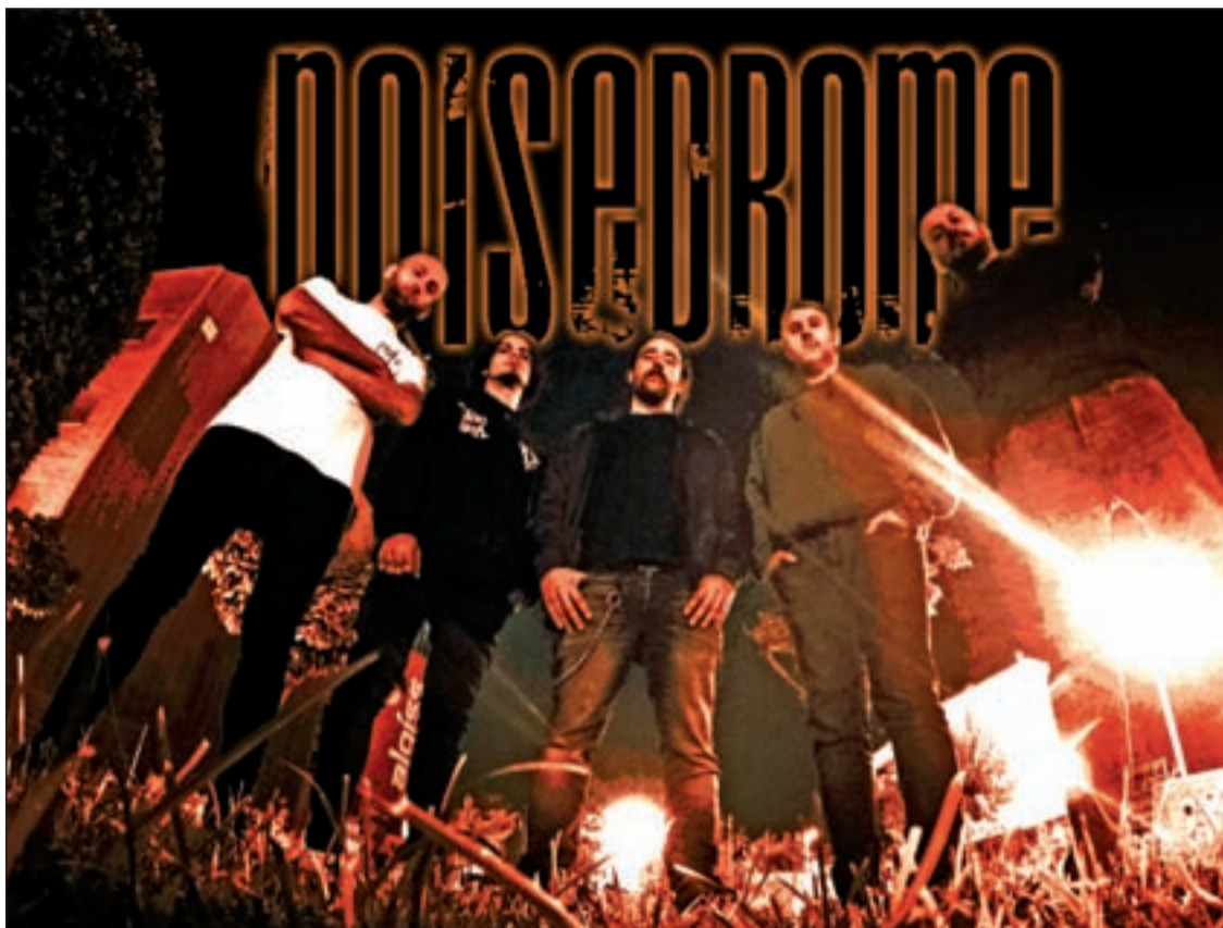
'December's in Bloom' es el álbum que la banda publicó antes de separarse en 2009

Al año siguiente optaron por el cambio de nombre pasando a llamarse Hollow Cry y logrando publicar en septiembre de 2018 su disco de debut, 'From ashes to flames', grabado en el leridano Nomad Studio. Como promoción se extrajo la pieza 'Last call' que se convirtió en videoclip.