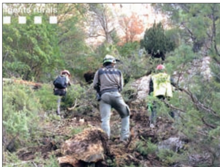
Els geòlegs van inspeccionar la zona el dilluns