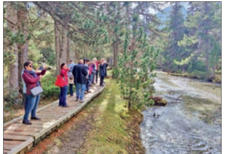
El Parc Nacional és un dels atractius turístics del Pirineu

El Parc Nacional d'Aigüestortes i Estany de Sant Maurici ha registrat el 2019 un total de 560.723 visitants. La xifra representa un augment de l'1,6% respecte l'any anterior i trenca la tendència a la baixa produïda l'any 2018. D'aquesta manera, el parc se situa per sobre del mig milió de visitants anuals per cinquè any, i es configura com un dels espais naturals protegits representatius dels Pirineus. Per sectors, Espot i la Vall de Boí són els municipis que concentren el gruix principal de visitants (72%). La resta es reparteixen per altres zones del Pallars Sobirà i l'Alta Ribagorça, així com el Pallars Jussà i la Val d'Aran. Pels accessos de l'Aran hi van anar 64.489 persones i per la Vall Fosca 28.623. El senderisme, en qualsevol de les seves vessants (com ara travesses de l'estil de la Carros de Foc o Camins Vius) i l'alpinisme, són les activitats principals, a més del gaudi del paisatge i del patrimoni cultural del territori. Durant l'any passat, els guies-interpretadors han acompanyat prop de 2.000 persones en diferents itineraris.