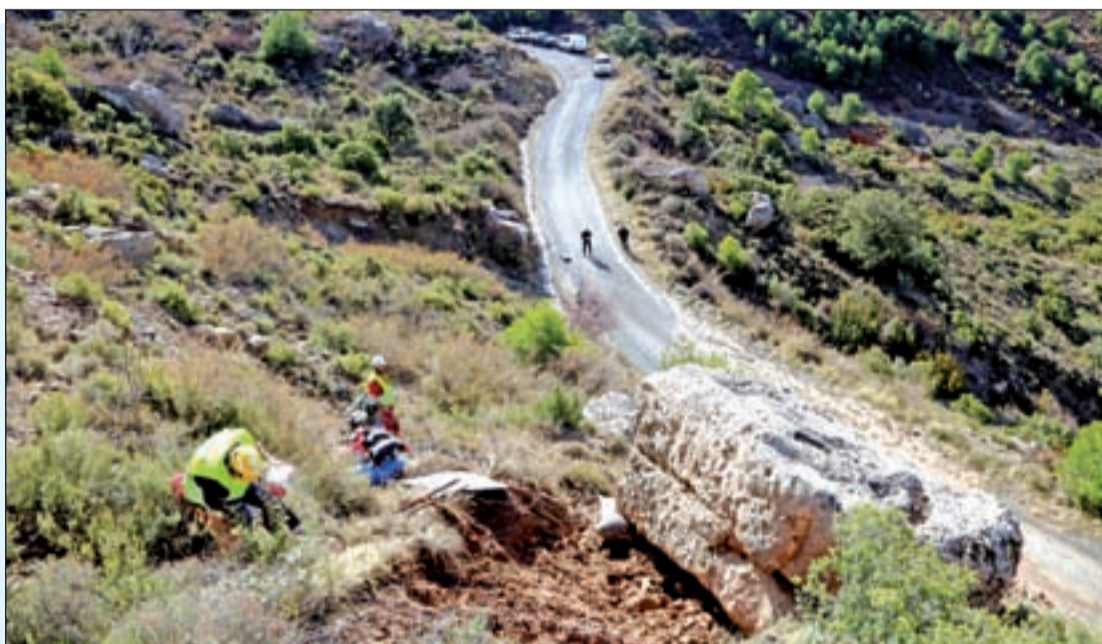
Els operaris van fer precipitar la gran pedra amb un sistema d'airbag