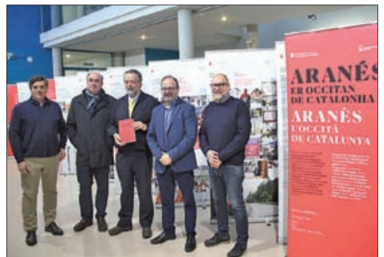
Un moment de la presentació ahir a Lleida