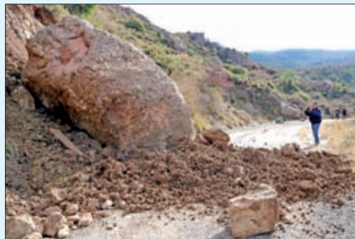
Moment en què la pedra va caure a la carretera