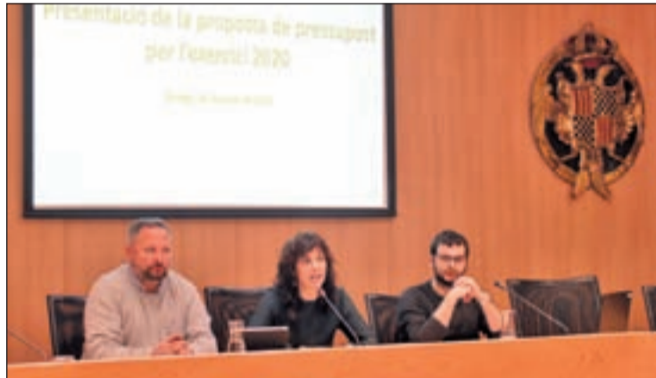
Presentació dels nous comptes, ahir a Tàrrega

L'Equip de Govern de l'Ajuntament de Tàrrega va presentar ahir la proposta de pressupost municipal corresponent a l'exercici 2020. Els nous comptes ascendirán a 17.862.429 euros, xifra un 2,8% inferior als comptes de l'any 2019. Sumant els 8.000 euros de la Societat Urbanística Municipal d'Habitatge Social de Tàrrega (SUMTA) i 1.109.200 euros de l'EPEL Fira Tàrrega, l'import consolidat per al 2020 ascendeix fins als 18.979.629 euros. El nou pressupost s'ha dissenyat amb pragmatisme i ajustant-se a una reducció prevista d'ingressos (s'estima, per exemple, que les recaptacions de l'IBI urbà i les plusvàlues baixin un 1,75% i un 33% respectivament). Tot i això,