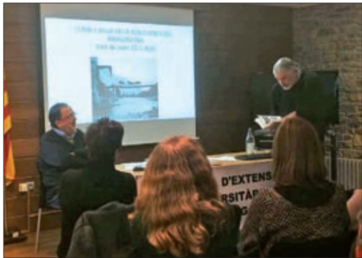
Moment de la jornada de l'aula universitària