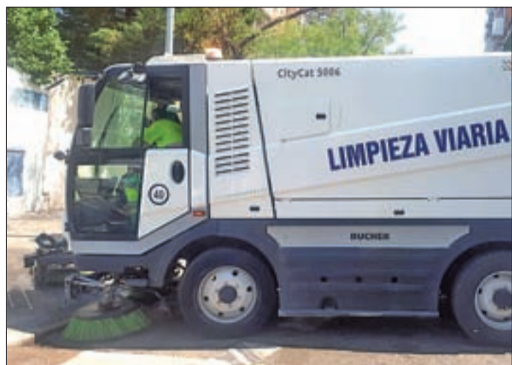
Imatge de la màquina que s'adquirirà

A grans trets, el pressupost de l'exercici 2020 aposta per les àrees socials, la protecció dels sectors més vulnerables garantint la cobertura de necessitats bàsiques així com el foment de l'educació i la cultura. Així queda reflectit també en la despesa per programes amb 2,8 M.€ assignats a benestar comunitari.