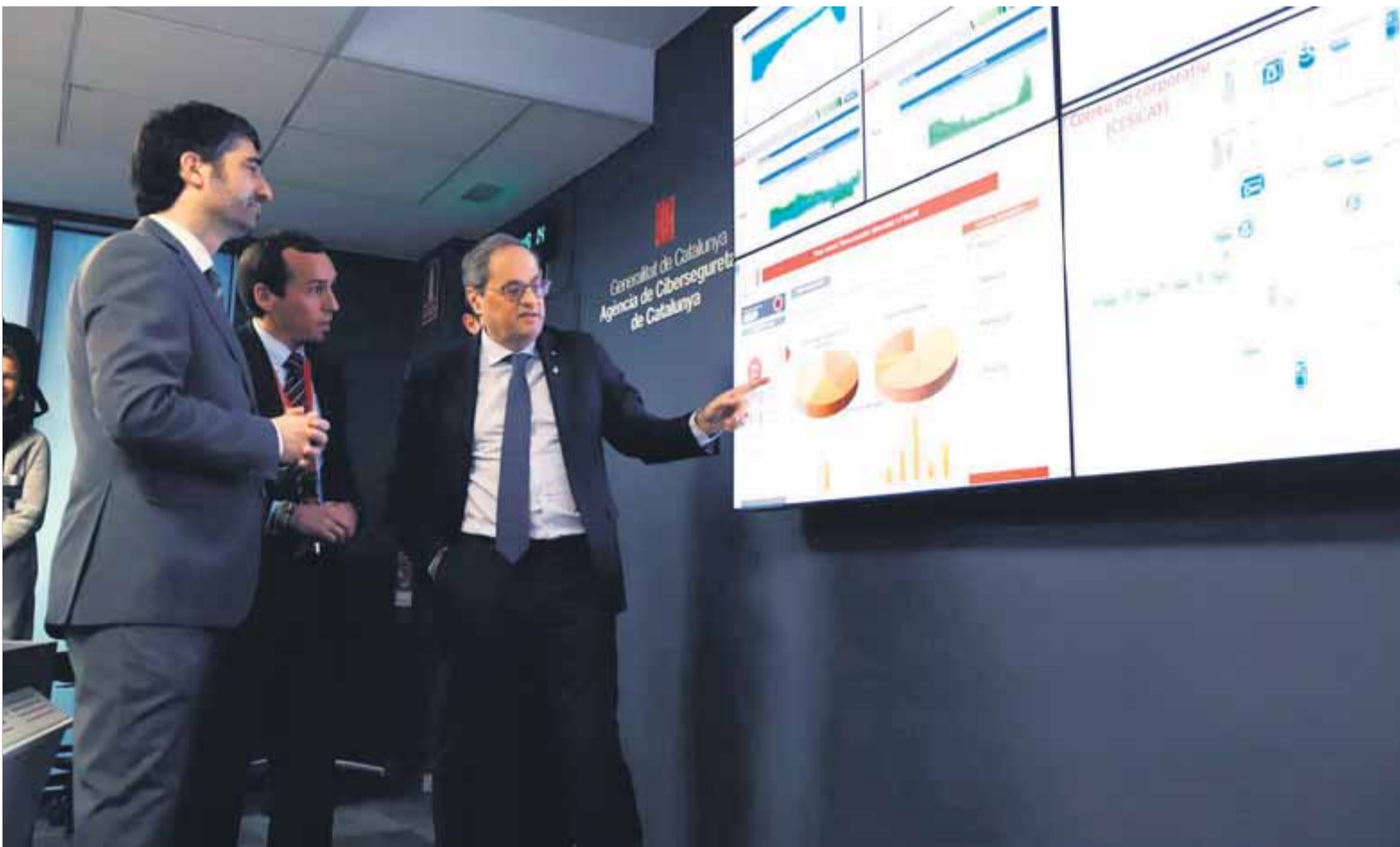
El president de la Generalitat i el conseller de Polítiques Digitals i Administració Pública, durant la visita que van fer ahir a l'Agència de Ciberseguretat ■ G.C.