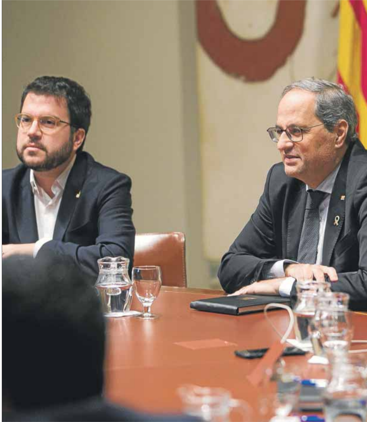
Pere Aragonès i Quim Torra, durant la reunió extraordinària d'ahir del consell executiu que es va fer a Palau

En línia amb el relat que ha anat sostenint les darreres setmanes, Torra va ratificar que no pensa renunciar digui el que digui la Junta Electoral, ja que, segons ell, la seva condició tant de president com de diputat està circumscrita, únicament i exclusivament, als designis del Parlament. “Em dec a la cambra; només la cambra pot decidir qui exerceix el càrrec i qui no”, va proclamar, enmig d'un reduït auditori, on també hi havia els diputats de JxCat Eduard Pujol, Albert Batet, Elsa Artadi i Josep Costa, a més de col·laboradors i alts càrrecs de l'executiu. Davant de tots ells, el cap de govern va anunciar que ja havia contactat amb el president del Parlament, Roger Torrent, per forçar la convocatòria d'un ple extraordinari per avui mateix, a les 17 hores, emparant-se en les prerrogatives que li concedeix l'article 78.2 del seu reglament. La intenció inicial, segons van explicar diverses fonts, seria presentar una proposta de resolució —si pot ser, consensuada entre tots els partits independentistes— en favor de Torra, amb la voluntat que obtingui un suport de l'hemicicle tan explícit i majo-