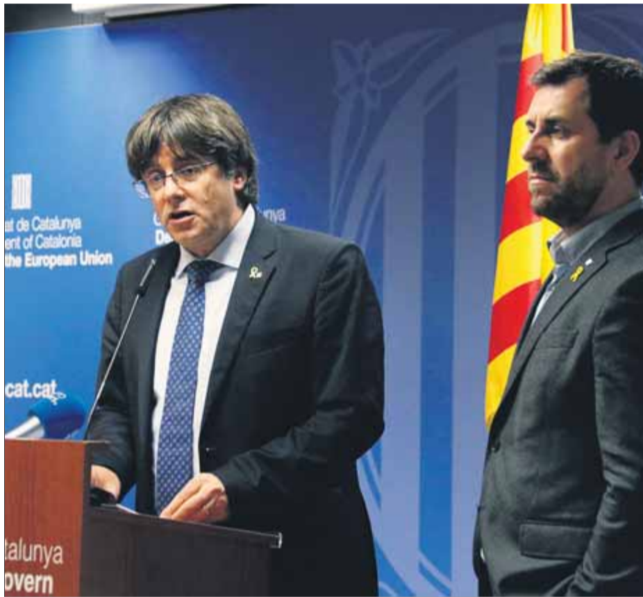
Puigdemont i Comín, a la seu de la delegació del govern a Brussel·les

Puigdemont començava el seu plantejament mostrant respecte envers l'acord ERC-PSOE que farà possible la investidura de Sánchez, però alhora reivindica que es respecti els que tenen “reserves” sobre aquest pacte. L'expresident assenyala que, fins ara, les etapes decisives del procés d'independència “haviem estat compartides i decidides enmig d'un consens molt ampli”, i lamenta que això no hagi estat així amb l'acord ERC-PSOE. “Els teòrics de la desunió tenen una nova oportunitat de demostrar