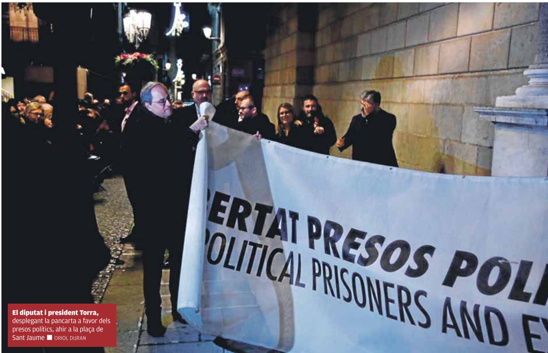
El diputat i president Torra, desplegant la pancarta a favor dels presos polítics, ahir a la plaça de Sant Jaume

guns insults quan entraven a Palau amb apel·latius com "botiflers" i "traïdors". I així com la nit electoral els congregats davant la seu del PSOE clamaven "con Iglesias, sí", els manifestants de Sant Jaume demanaven ahir que "Sánchez, no".