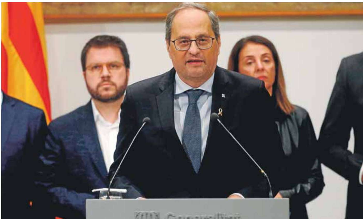
El president de la Generalitat, Quim Torra, en la seva compareixença d'ahir a la nit

RESPOSTA • El president anuncia que hi presentarà recurs i demana un ple que el ratifiqui, que es farà aquesta mateixa tarda