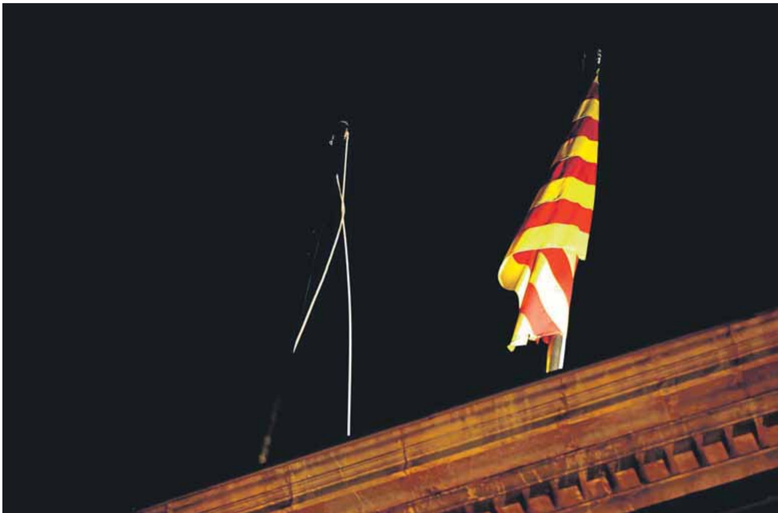
El Palau de la Generalitat va viure ahir al vespre la retirada de la bandera espanyola durant uns minuts en què la senyera va onejar en solitari

■ La Junta Electoral s'ha de renovar amb cada constitució de les Corts i els tretze membres són els de la legislatura passada ■ Casado fa de portaveu de l'ens vantant-se d'eliminar Torra i Junqueras