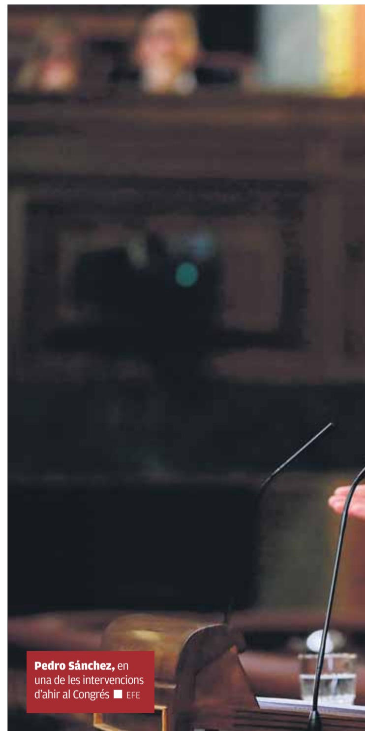
Pedro Sánchez, en una de les intervencions d'ahir al Congrés

Constitució i Espanya Desplegada la seva part de la coreografia perquè ERC s'abstingui, Sánchez va anar més enllà de l'acord i ahir sí que va citar el “marc constitucional” com a sostre del que podrà ser acordat en la taula de negociació entre els dos governs. L'èxit de l'entesa, de fet, havia estat eliminar la Constitució com a paraula i apostar perquè la taula actuï “sense més límits que el respecte als instruments i als principis que regeixen l'ordenament jurídic democràtic”. L'al·lusió a la Constitució era explotada aviat per dirigents de JxCat, que van burxar la ferida de Rufián i els seus per afermar el seu no. “Sánchez ha fet una modificació in voce