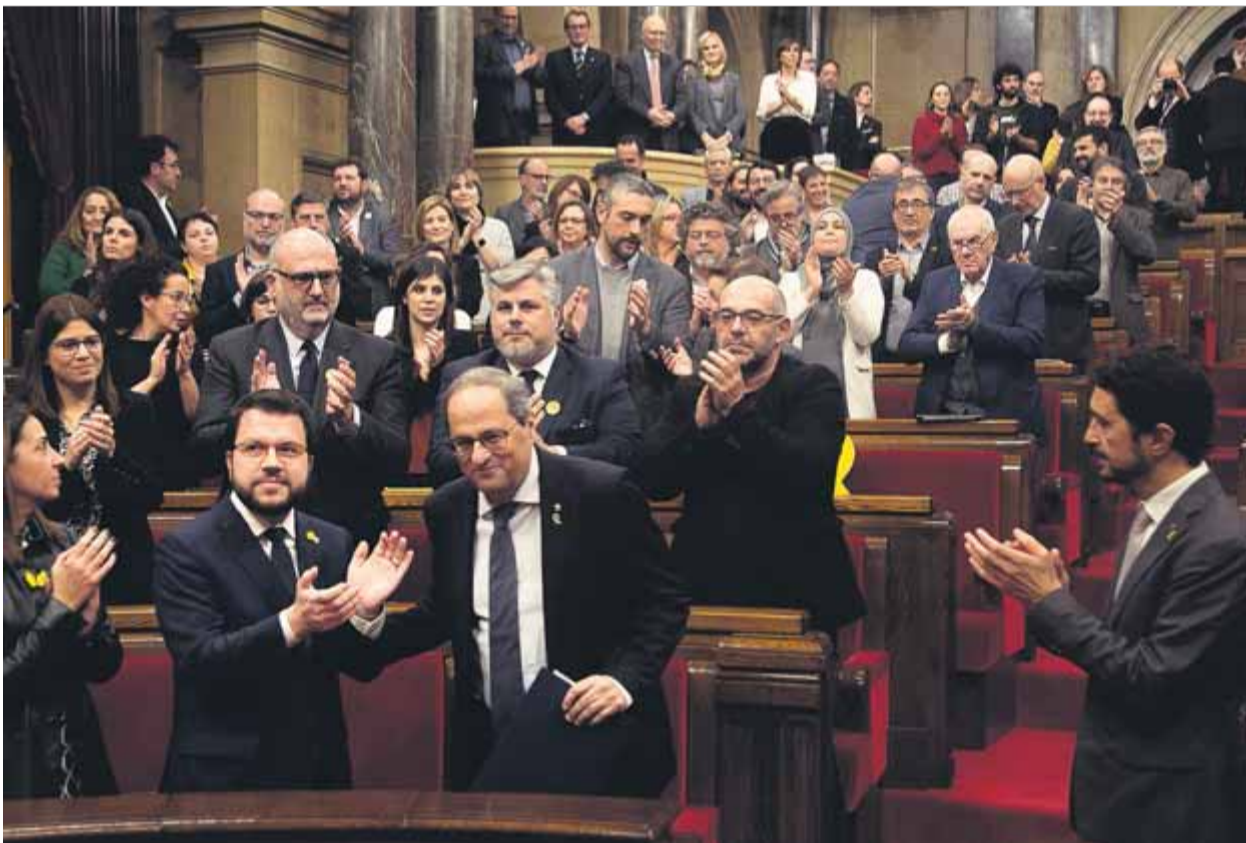
Els diputats independentistes mostren el seu suport a Torra just quan el president entra a l’hemicicle

ACORD • JxCat, ERC i la CUP aproven una declaració de suport al president que titlla de “cop d’estat” la inhabilitació RECURS • Torra anuncia el recurs i els juristes critiquen la decisió de la JEC