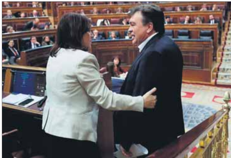
Pablo Casado a la bancada del PP. A baix, Joan Baldoví recomanant til·la, i Adriana Lastra i Tomás Guitarte

Com si sospités que Espanya és un ordinador que viu penjat a la pàgina judicial, Sánchez va pujar a la tribuna disposat a prémer alhora les tres tecles de Ctrl+Alt+Supr i fer un reset de la vida política espanyola. A més d’oferir-se com a president de tots i presentar ja sense insomnis el vicepresident Pablo Iglesias, Sánchez va viure un fervor inèdit: l’aplaudien els d’Unides Podem que anhelaven ser ministres amb virulència equiparable a aquella amb què era aplaudit pels actuals ministres socialistes que aspiren a repetir fins al punt d’encreuar els dits per no rebre una trucada el dia de Reis amb carbó en forma de “gràcies pels serveis prestats” acompanyat de l’entrega de la cartera ministerial. “Sí que es pot! En-