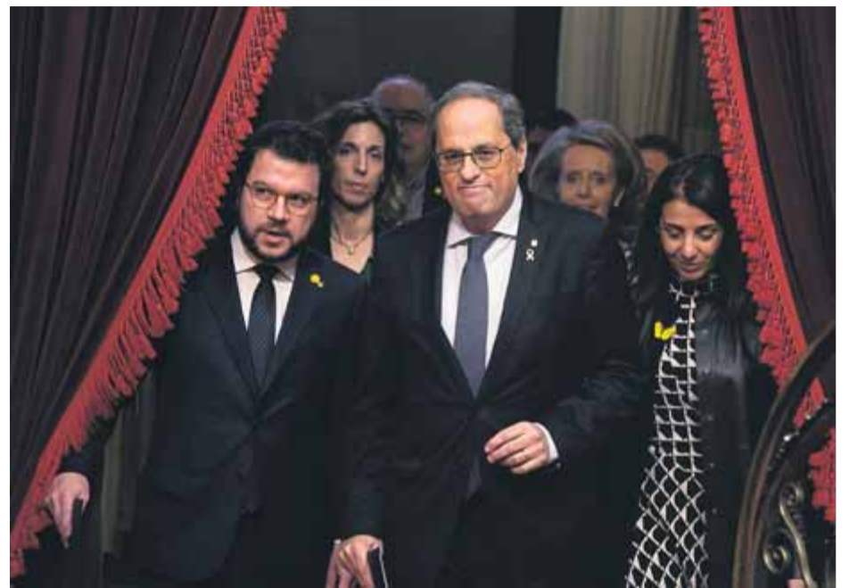
El president Torra, amb el vicepresident i consellers, en entrar al ple, ahir

■ La JEC, en la resolució, ordena a la junta de Barcelona que deixi sense efecte la credencial de diputat de Torra quan es "notifiqui íntegrament l'acord", és a dir amb el raonament del vot en contra de sis dels seus membres. Tenen de termini fins al 14 de gener. No obstant això, el presi-