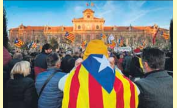
La concentració al parc de la Ciutadella