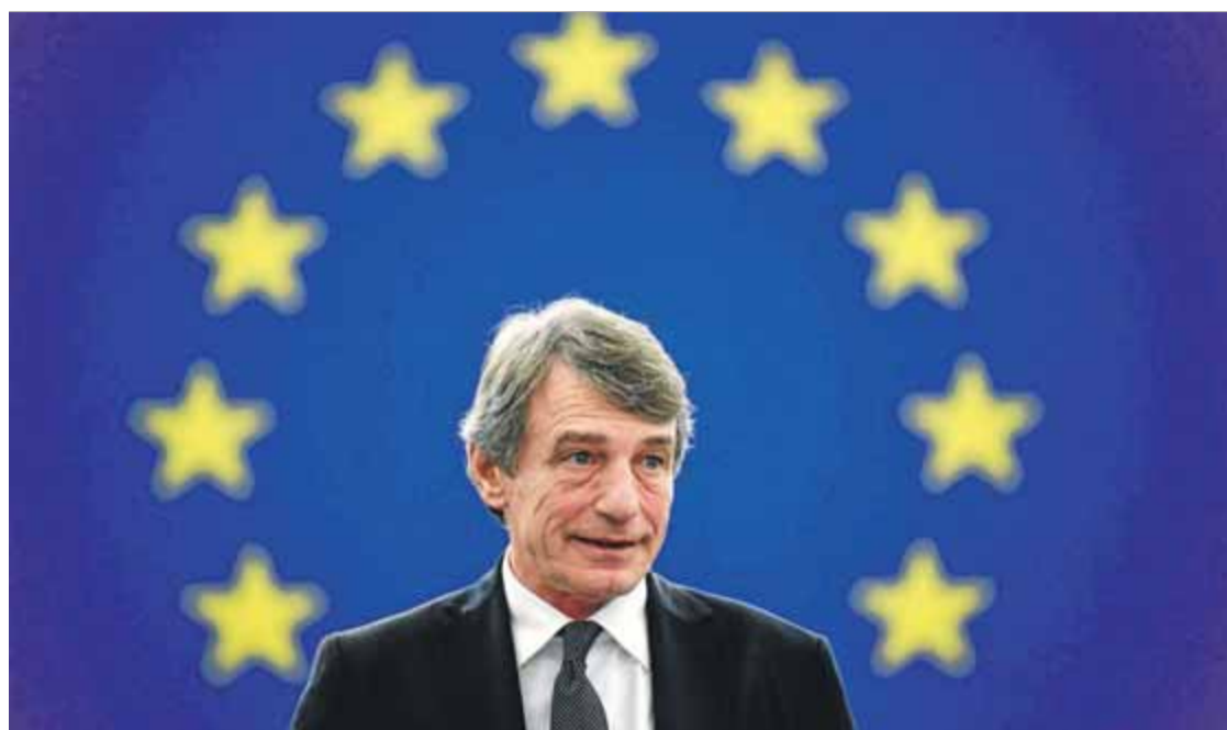
David Sassoli, president del Parlament Europeu

El cop d'estat de la JEC només es pot entendre com una desesperació per boicotejar la investidura d'aquest estat profund. I pretendre la suspensió del president de Catalunya i enfrontar-se a la sentència del TJUE despos-