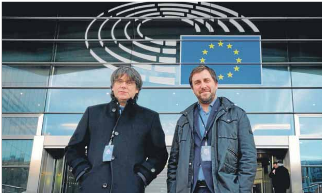
Puigdemont i Comín, a l'entrada del Parlament Europeu després de recollir les acreditacions definitives, dilluns

El mateix va fer l'eurodiputat Toni Comín, que a Europa es va presentar com a número dos de Puigdemont però al Parlament