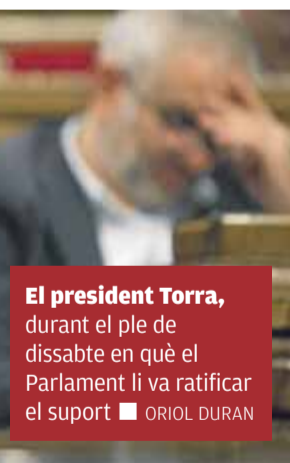
El president Torra, durant el ple de dissabte en què el Parlament li va ratificar el suport

consideren que tampoc hauria d'haver acceptat les alegacions del Parlament pel mateix motiu.