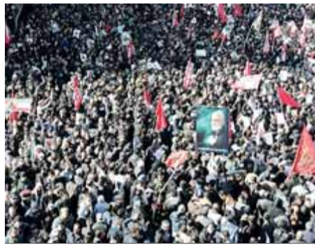
Massiu funeral de Soleimani

Mig centenar de persones moren per una allau humana en els funerals de Soleimani