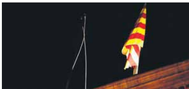
L'asta del terrat de Palau, sense la bandera

per presentar-lo al Parlament per a la seva tramitació, a fi que es pugui aprovar definitivament al llarg del primer trimestre. El vicepresident va afirmar que els nous comptes "són un pas endavant", ja que preveuen un augment de la despesa global per al conjunt de departaments de 2.900 milions respecte als del 2017, els darrers aprovats. En aquest sentit, va confirmar algunes de les novetats que preveuen, com ara un increment de la despesa en salut de 900 milions "per reforçar l'atenció primària i fer front al problema de les llistes d'espera"; la reducció del 30% de les taxes universitàries, que ell mateix va anunciar fa uns mesos, i la recuperació de la despesa en llars d'infants, amb l'aportació de 70 milions. ■ REDACCIÓ