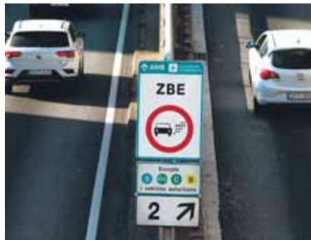
Un dels rètols de la ZBE

L'abast real de la mesura se sabrà a partir del mes d'abril, quan es comenci a multar