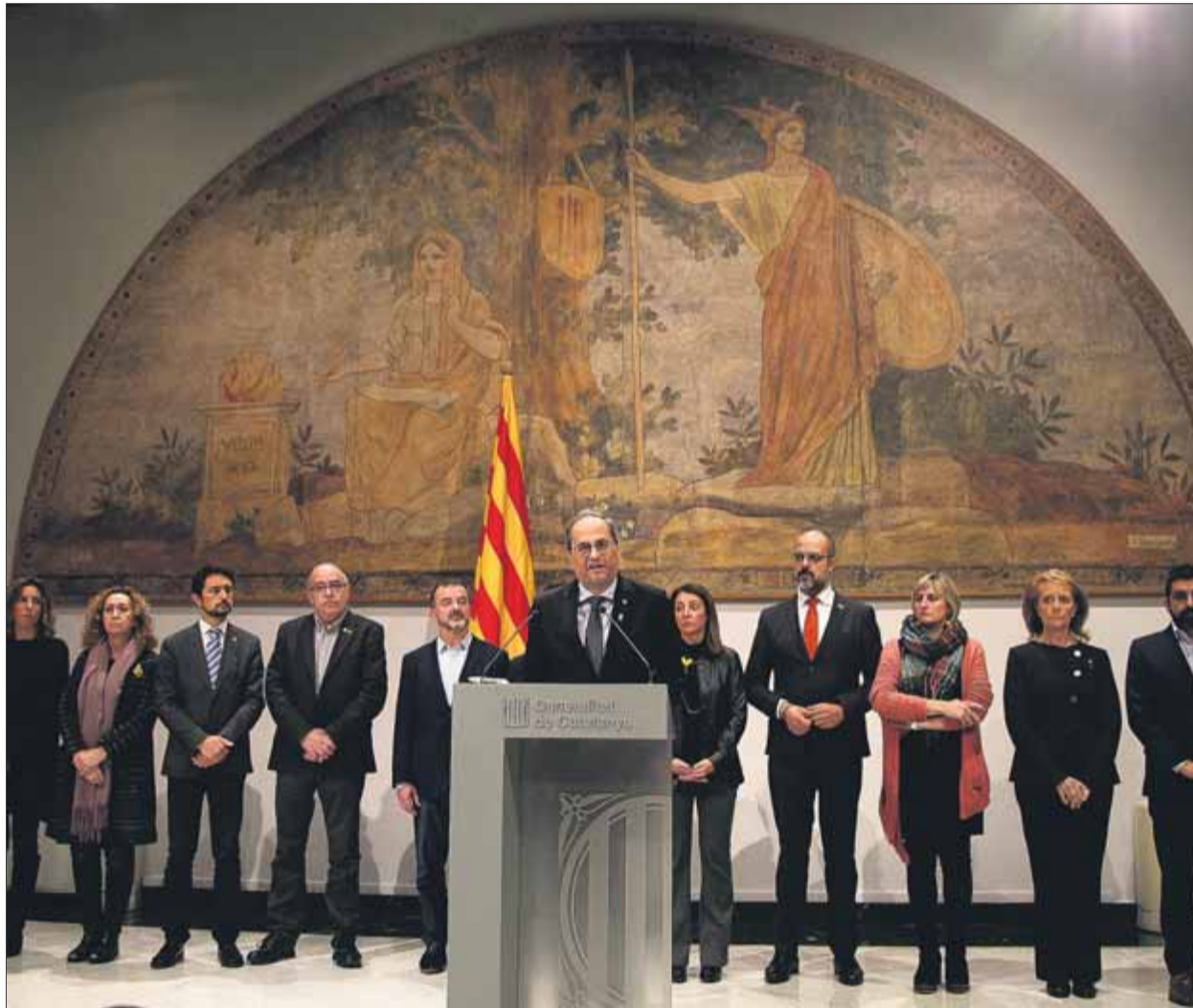
Declaració institucional de Quim Torra del dia 3 de gener quan es va conèixer la resolució de la JEC

El recurs presentat per Torra s’acompanyarà en breu d’una segona apel·lació també al Suprem que presentarà el Parlament de Catalunya després que el seu president, Roger Torrent, instés ahir els serveis jurídics a presentar un nou recurs davant la sala tercera reiterant també l’argument que treure la condició de diputat al president és una decisió que correspon al Parlament. La junta electoral provincial ja va dirigir-se al Parlament per saber la seva posició sobre el compliment de la decisió de la JEC, però des de la cambra catalana els van demanar que no s’executi la resolució en espera de la decisió del Suprem. D’aquesta manera, el Parlament també dona resposta legal a la declaració aprovada per JxCat, ERC i la CUP en un ple fet a correueta disabte passat en què ratificaven el president i consi-