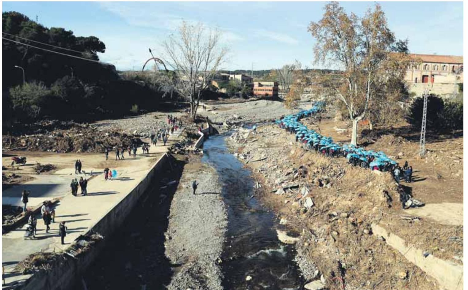
La Riumuntada va ser una de les últimes actuacions de solidaritat amb els afectats per les riuades del Francolí de l'octubre

Els dies següents vingueren representants de les institucions catalanes a visitar les poblacions afectades, especialment el president de la Generalitat, el molt honorable Quim Torra; el