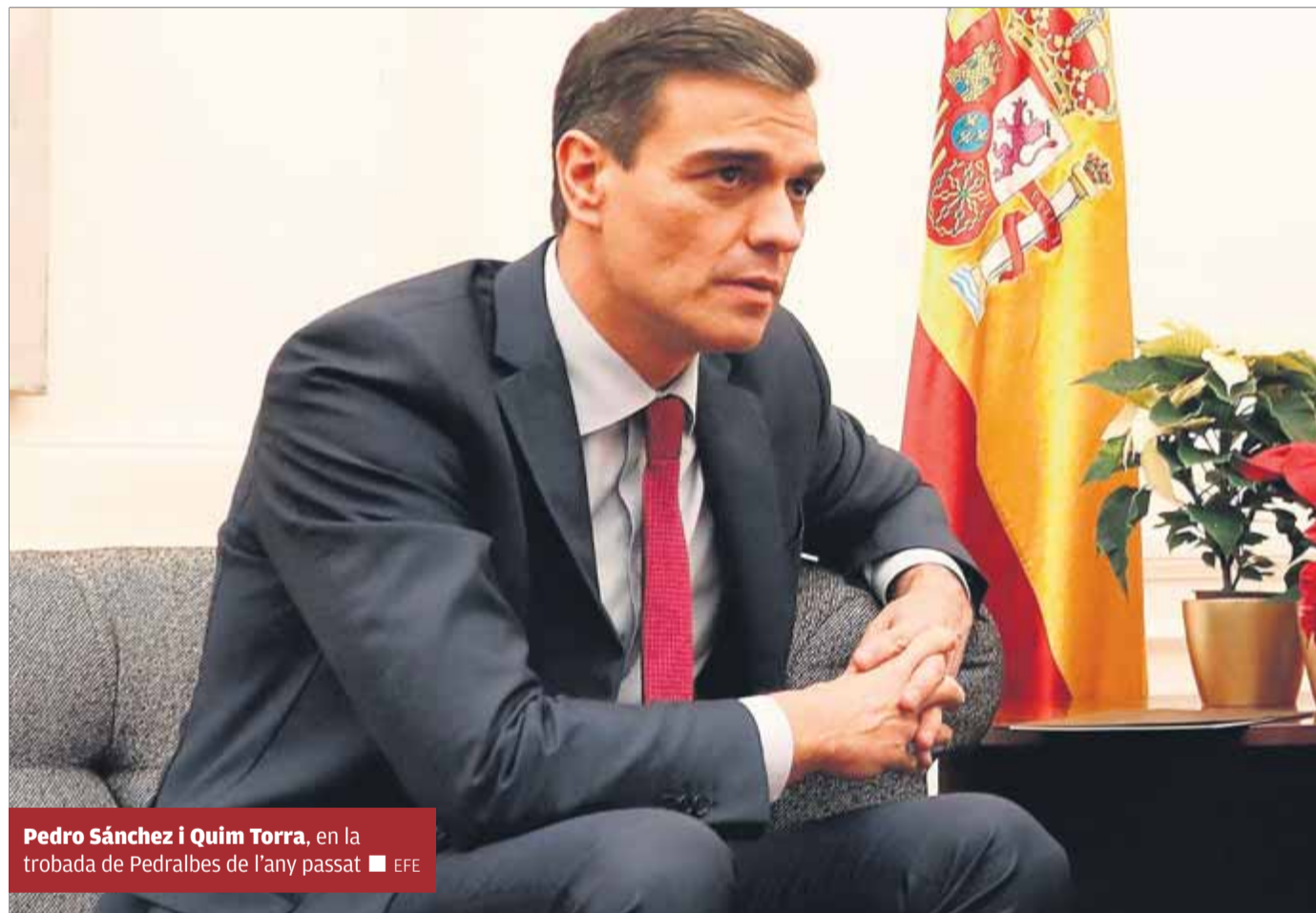
Pedro Sánchez i Quim Torra , en la trobada de Pedralbes de l'any passat

Torra vol implicar el conjunt de l'independentisme per afrontar amb "molta més força" el diàleg amb l'Estat, més enllà dels dos grups parlamentaris que sustenten l'executiu. "Hem intentat preservar el govern de les negociacions entre partits. Vam