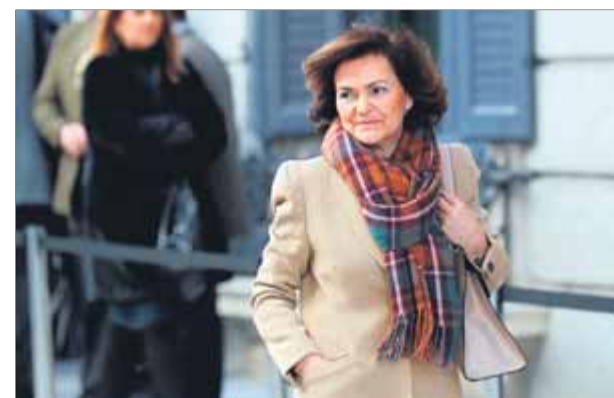
La vicepresidenta del govern estatal, Carmen Calvo, entrant al Congrés dels Diputats

Pel que fa a la cita pendent amb Torra, Sánchez va amb peus de plom. Per telefonar Torra 15 minuts –de les 9.19 a les 9.34 h del 17 de desembre–, Sánchez va creure necessari diluir la trucada en una gran tanda de 17 cops de