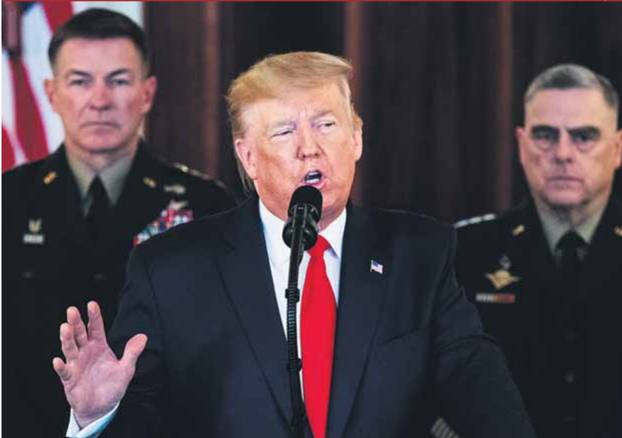
Donald Trump, durant la seva intervenció d'ahir a la tarda després de l'atac iranià de la nit