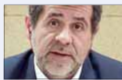
Jordi Sànchez Expresident de l'ANC (JxCat)