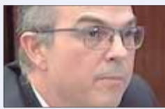
Jordi Turull Exconseller de Presidència (JxCat)