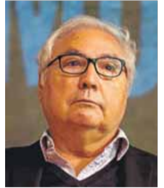
Els futurs quatre vicepresidents, Carmen Calvo, Nadia Calviño, Teresa Ribera i Pablo Iglesias; la pròxima portaveu, María Jesús Montero, i el ministre dels comuns, Manuel Castells