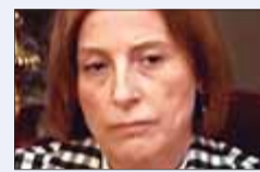
Carme Forcadell Expresidenta del Parlament de Catalunya