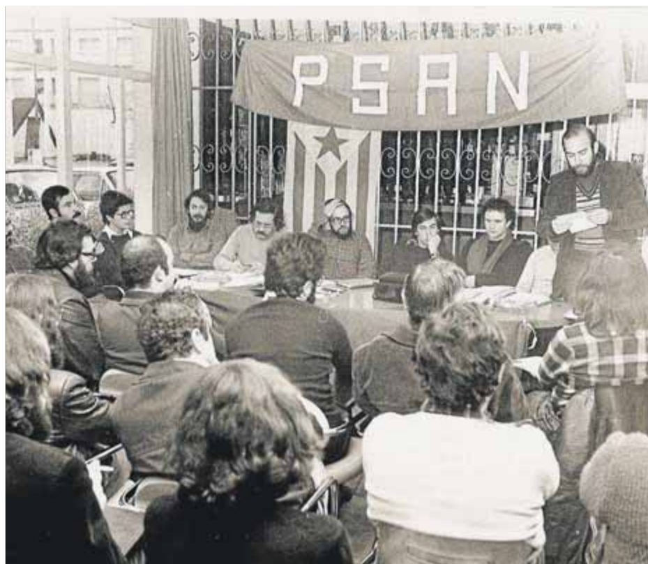
Assemblea del PSAN , un dels partits que van mantenir la flama independentista des dels anys setanta