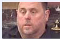
Oriol Junqueras Exvicepresident (ERC)