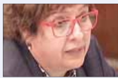
Dolors Bassa Exconsellera de Treball, Benestar i Famílies (ERC)