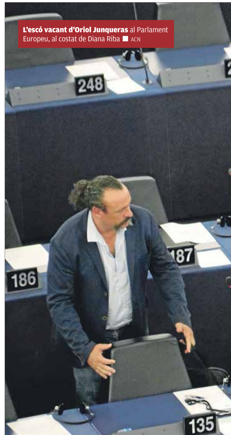
L'escó vacant d'Oriol Junqueras al Parlament Europeu, al costat de Diana Riba

El tribunal espanyol –que l'únic que admet implícitament és que la JEC