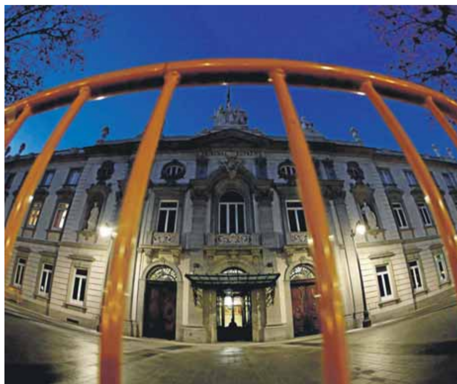
Façana del Tribunal Suprem espanyol

Els vots particulars dels membres de la JEC, que va acordar dividida per 7 vots a 6 la retirada de l'acta, argumenten que l'àrbitre electoral no és competent