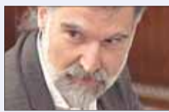
Jordi Cuixart President d'Òmnium Cultural