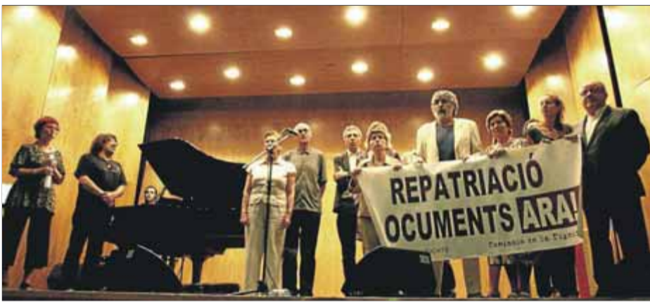
L'acte d'entrega dels premis, en l'edició celebrada l'any 2011