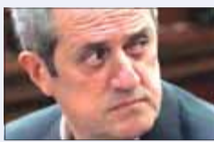
Joaquim Forn Exconseller d'Interior (JxCat)