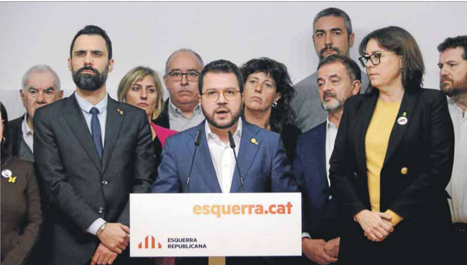
Aragonès compareixia ahir a la seu d'ERC acompanyat de Roger Torrent, l'eurodiputada Diana Riba i consellers, senadors i diputats