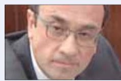
Josep Rull Exconseller de Territori i Sostenibilitat (JxCat)