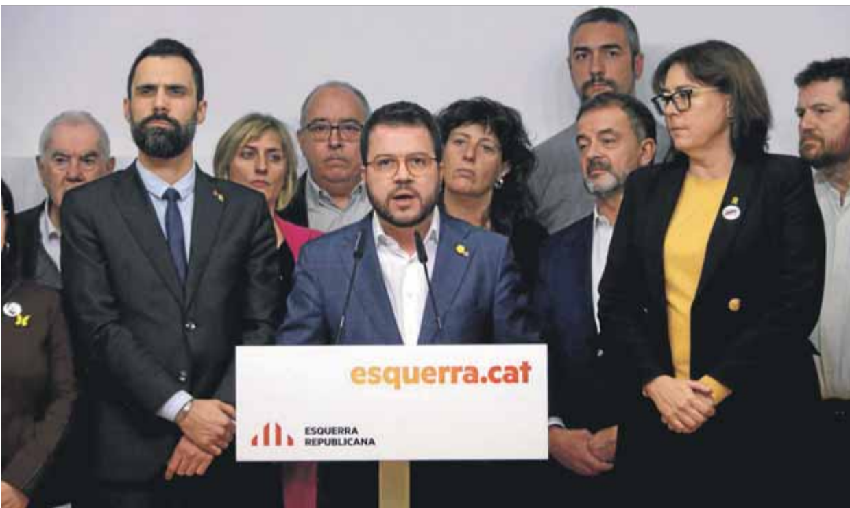
El vicepresident, Pere Aragonès, durant la compareixença d'ahir a la tarda amb la plana major d'ERC

EXCUSA • Afirma que la seva condemna ferma comporta l'exclusió com a eurodiputat