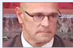
Raül Romeva Exconseller d'Afers Exteriors (ERC)