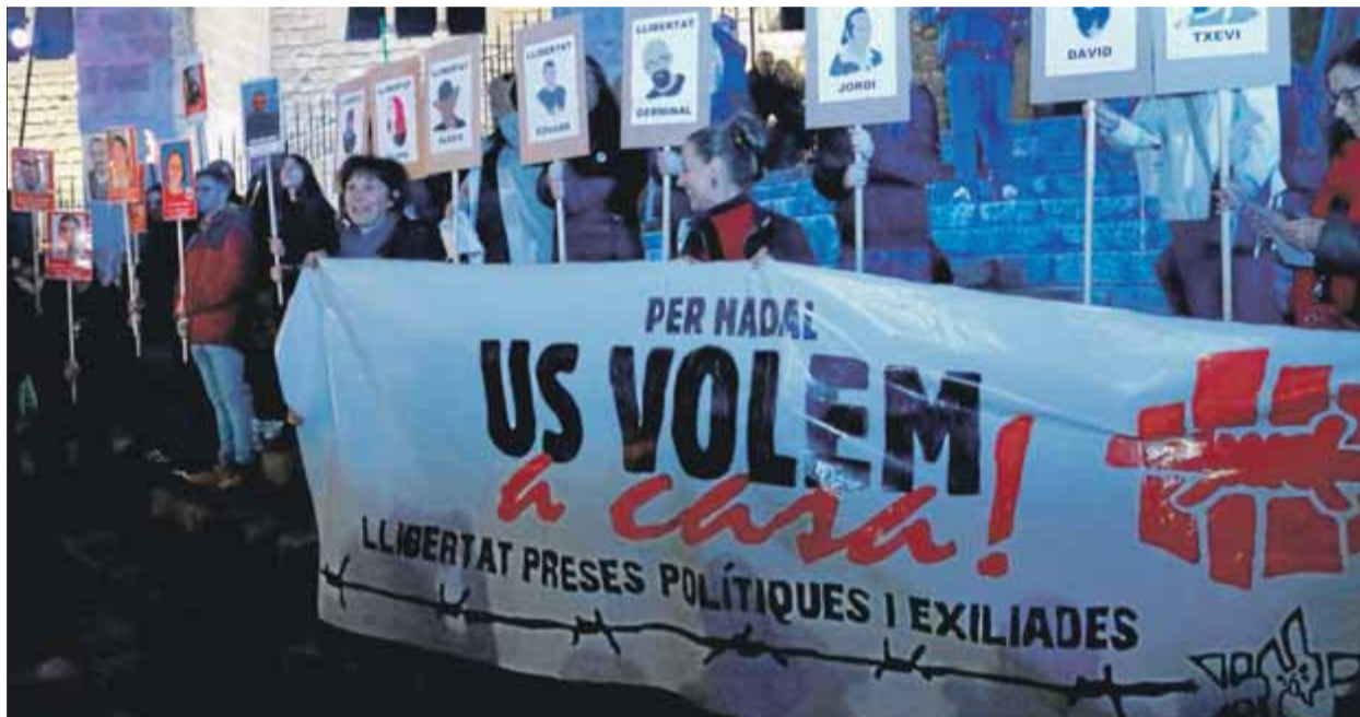
Una de les manifestacions a la plaça del Rei de Sabadell per reclamar l'alliberament dels membres dels CDR i els presos

Per prendre aquesta decisió, García Castellón estima l'arrelament familiar, laboral i social de tots dos, i també la situació en què està la investigació. A més, considera que amb les mesures cautelars que hauran d'acatar en sortir