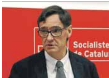
Salvador Illa, número dos del PSC i nou ministre de Sanitat

■ Per a Pablo Iglesias –segur que havia pactat ser vicepresident segon amb Carmen Calvo (vicepresidenta primera) i Nadia Calviño (vicepresidenta