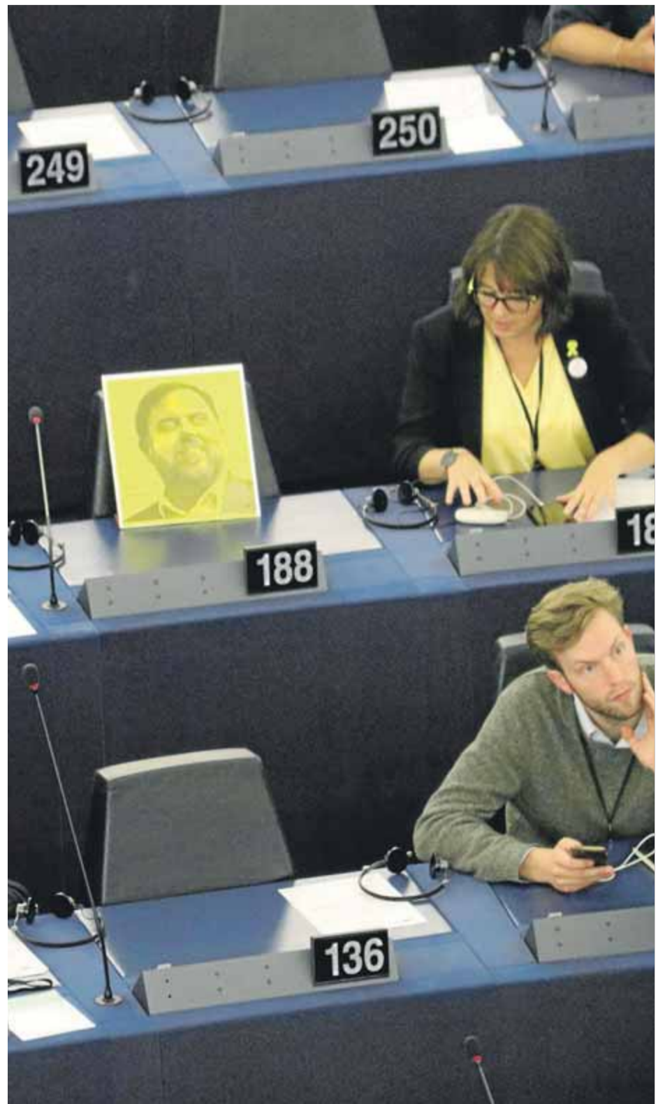
L'escó d'Oriol Junqueras al Parlament Europeu, al costat del de Diana Riba

Mentrestant, Brussel·les es mirava al matí amb lupa el vet del Tribunal Suprem al mandat d'eurodiputat d'Oriol Junqueras. La Comissió Europea va anunciar ahir que està "estudiant" la situació legal, però no sense insistir en diverses ocasions que la sentència del Tribunal de Justícia de la Unió Europea que reconeixia la immunitat del líder d'ERC és "vinculant" per a l'Estat espanyol. En concret, l'executiu europeu va alertar que quan Luxemburg respon a una pregunta prejudicial els jutges estatals l'han