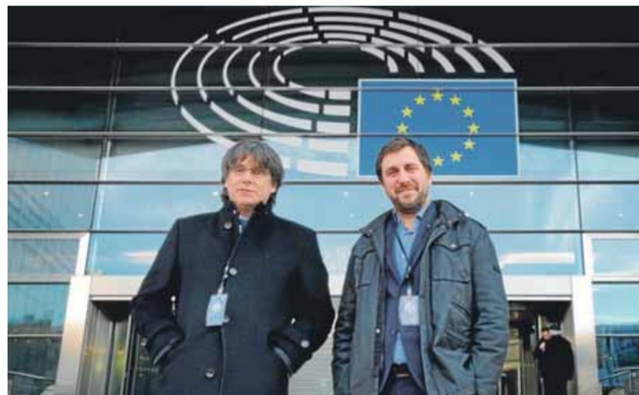
Els eurodiputats Puigdemont i Comín, recollint les acreditacions