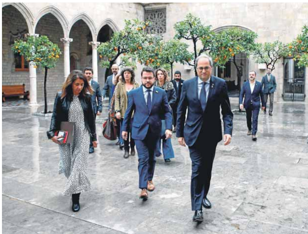
El president Torra amb el govern en ple, ahir al pati dels Tarongers del Palau de la Generalitat

SUPORT • Compareix amb tot el govern i assegura que la decisió és un intent d'alterar la voluntat política dels catalans