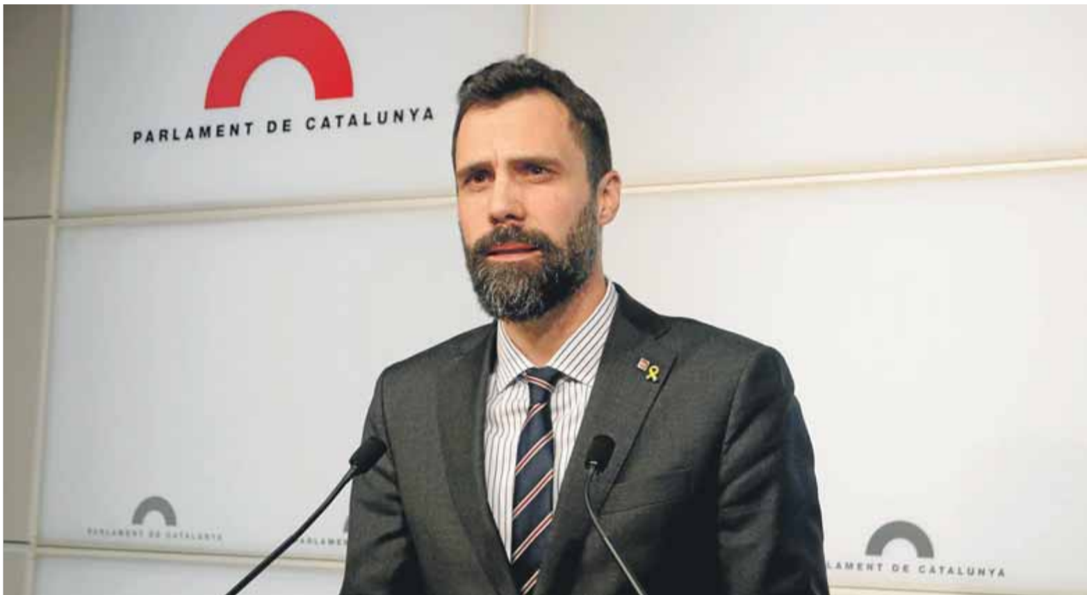
El president del Parlament, Roger Torrent, compareixia ahir a la tarda a la sala de premsa de la cambra per explicar la posició institucional

Reitera que suspendre com a diputat el president no correspon a la JEC, sinó a la cambra i en cas de condemna ferma ■ Torra es reafirma com a diputat i president amb el suport del govern, JxCat, ERC i la CUP