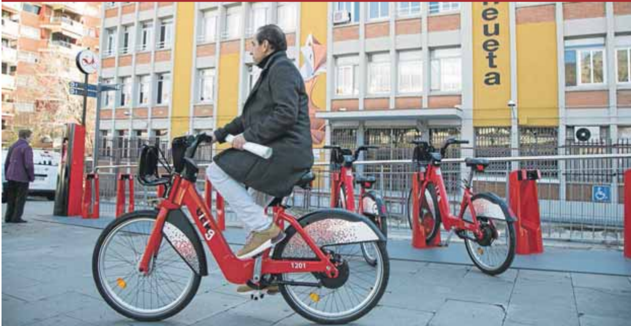
Un usuari, fent servir una de les bicicletes que s'han instal·lat a la Guineueta, a Nou Barris, ahir

DESPLAÇAMENT • La reestructuració del sector fa que molts ciutadans hagin de traslladar-se a poblacions veïnes