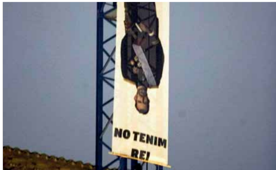
Pancarta del Borbó de cap per avall, a la plaça Major de Vic

En total, són dinou les persones que estan cridades a donar explicacions a la Guàrdia Civil per les protestes. Els investiguen per delictes de desordres públics i danys, i contra la seguretat viària. De moment, les defenses no tenen accés a les diligències prèvies i per això descobreixen més detalls del cas.