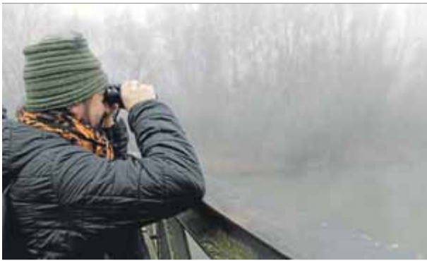
Un dels participants durant la sortida, amb molta boira, per pensar ocells aquàtics hivernants a Lleida