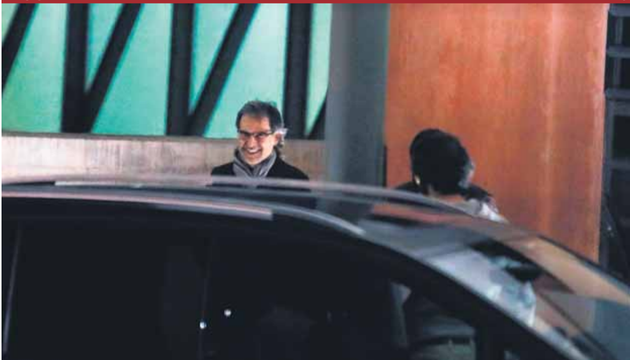
El president d'Òmnium sortint ahir al vespre del centre penitenciari de Lledoners