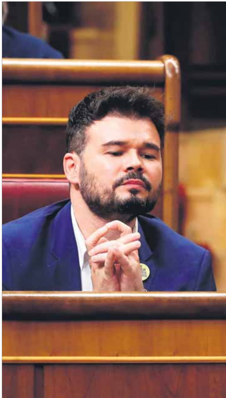
Rufián, al seu escó del Congrés dels Diputats

Continuo sent la mateixa persona. Al final jo soc portaveu d'un grup molt important. Cadascú ha de tenir el seu paper en el seu moment. Les circumstàncies són diferents. Ja no tenim a davant Juan Ignacio Zoido [ministre de l'Interior amb Rajoy] i tota aquesta gent. Estem davant d'un govern amb Podem. No pots dir que Podem és el mateix que Vox, per exemple. I jo el que no he de fer és aïllar el meu grup. Si jo faig segons quines coses, els altres ho tenen molt fàcil per aïllar-nos. I vaig entendre un dia que amb les regles de joc