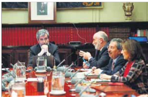
El CGPJ ahir, presidit per Lesmes, va avaluar Delgado

El Ple del Consell General del Poder Judicial (CGPJ), presidit per Carlos Lesmes, va considerar ahir amb una gran divisió interna –per 12 vots a 7– que la fiscal Dolores Delgado compleix els requisits legals exigits per al càrrec de fiscal general de l'Estat, tal com ha proposat el president del govern espanyol, Pedro Sánchez. Els requisits fixats inclouen ser jurista de nacionalitat espanyola amb reconegut prestigi i amb més de quin-