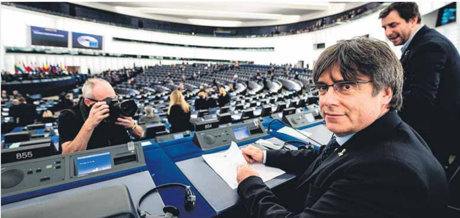
Carles Puigdemont i Toni Comín als seus escons del Parlament Europeu, aquest dilluns passat

■ Engega el procediment per decidir si es concedeix el suplicatori al Tribunal Suprem ■ El comitè d'Afers Jurídics portarà el cas, que pot trigar mesos a resoldre's i no comporta la pèrdua de l'escó