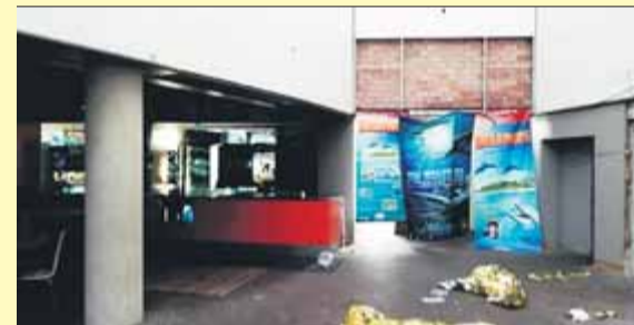
Interior de les instal·lacions, ahir ■ JORDI PANVELLA