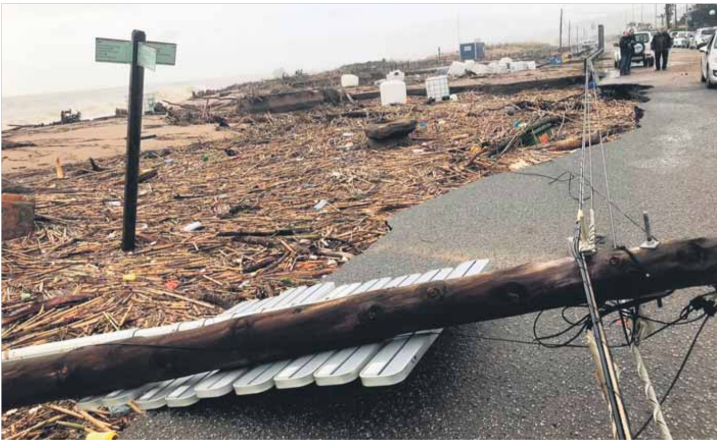
Destrosses a la platja de Malgrat de Mar, després del temporal desfermat per la borrasca 'Glòria'

GENERAL • Més de la meitat dels municipis catalans, amb danys pel pas de la borrasca 'Glòria'