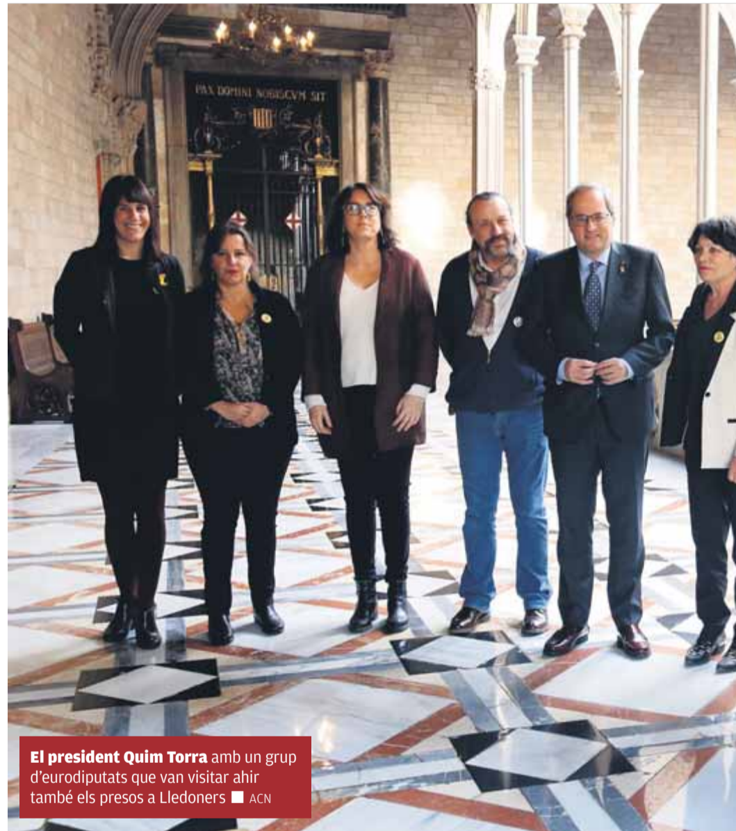
El president Quim Torra amb un grup d'eurodiputats que van visitar ahir també els presos a Lledoners

El focus sobre els republicans era ahir evident; però, tot i les reunions que se succeïen de bon matí a la