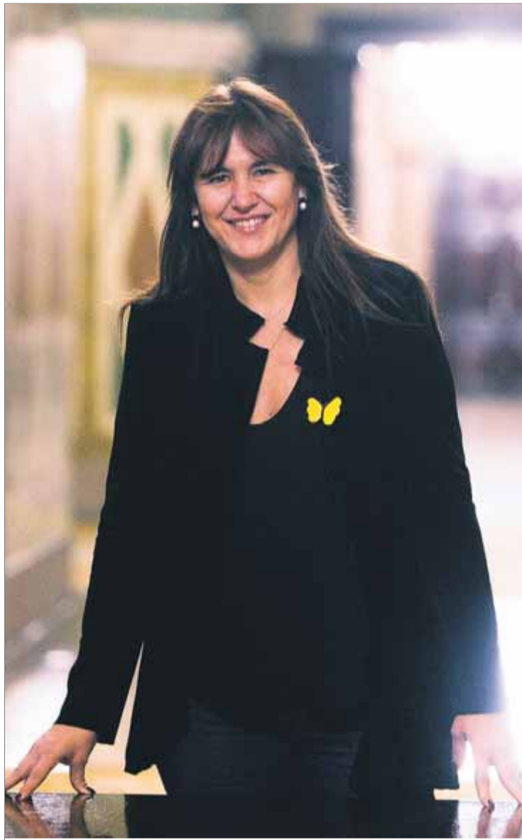
Laura Borràs, al saló de passos perduts del Parlament

No podem frivoltzar això, perquè hi havia moltes altres coses concretes que s'haurien pogut aconseguir en aquesta negociació. Per què cal gravar més la fiscalitat dels catalans quan resulta que hi ha un incompliment