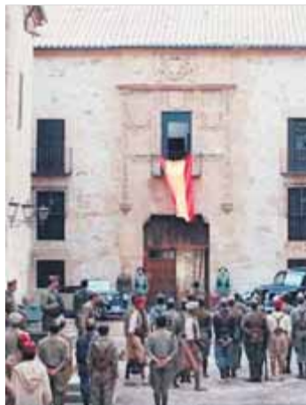
'Mientras dure...' d'Amenabar

Catalunya ha hagut de persistir sola i aïllada, perseguida, reprimida, lluitant a través de la història per poder ser qui som sense perjudicar a ningú. "No son de los nuestros", ens deien; "A por ellos", ens diuen ara.