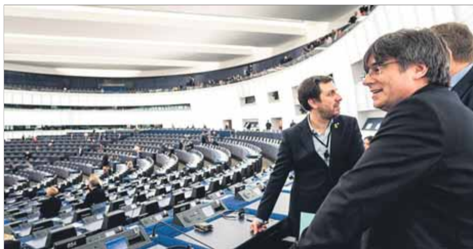
Carles Puigdemont i Toni Comín a la seu del Parlament Europeu